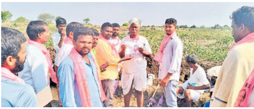
అవుసుపల్లి గ్రామంలో ఉపాభి కూలీలను ఓటు అభ్యర్థిస్తున్న ధారూరు మండల బీఆర్ఎస్ పాల్టీ నాయకులు