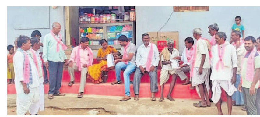
ధారూరు : నాగసముందర్ గ్రామంలో ఎన్మికల ప్రచారం నిర్వహిస్తున్న ధారూరు మండల పార్టీ నాయకులు