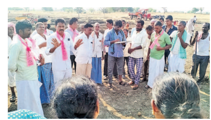
పర్పుమళ్ల లో ఉపాభి కూలీలను ఓటు అభ్యర్థిస్తున్న జీఆర్ఎస్ నాయకులు