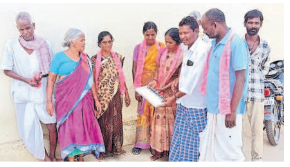
దోమ: తిమ్మాయిపల్లిలో మహిళ కు ఓటు వేసే విధానాన్ని వివరిస్తున్న నాయకులు