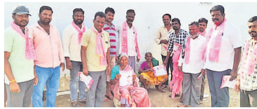
ధారూరు : నాగారం గ్రామంలో ఇంటింటికీ ఎన్మికల ప్రచారం నిర్వహిస్తున్న ధారూరు మండల పార్టీ నాయకులు