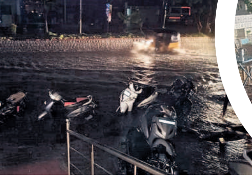
వరంగల్ నగరంలో జలమయమైన ములుగు రోడ్డు