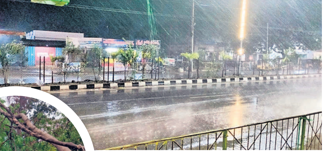
ములుగులో కురుస్తున్న వర్షం