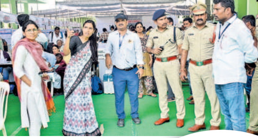
సిబ్బందికి సూచనలు చేస్తున్న వరంగల్ అల్లీ ప్రావీణ్య