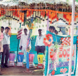
పస్తానాగారం పోలింగ్ కేంద్రంలో తాగునీటిని అందించేందుకు ఏర్పాటు చేసిన చలివేండ్రం