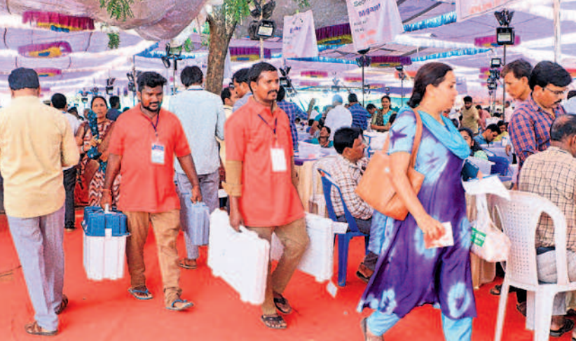
ములుగు డిస్ట్రిబ్యూషన్ సెంటర్ నుంచి పోలింగ్ సామగ్రిని తీసుకెళ్తున్న సిబ్బంది