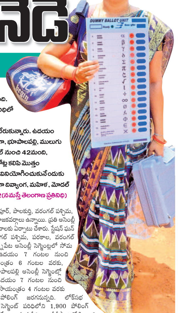
పోలింగ్ కేంద్రాలను ఏర్పాటు చేశారు.

ఓట్ల పండుగకు వేళ ఉంది. లోక్సభ ఎన్నికల్లో భాగంగా సోమవారం పోలింగ్ జరుగుతుండగా అధికార యంత్రాంగం అన్ని ఏర్పాట్లు చేసింది. ఉమ్మడి జిల్లాలోని వరంగల్, మహబూబాబాద్ లోక్సభ స్థానాల పరిధిలో మొత్తం 3709 పోలింగ్ కేంద్రాలను ఏర్పాటు చేయగా ఆదివారం సాయంత్రంలో పూర్తిగా సామగ్రితో సిబ్బంది పోలింగ్ సెంటర్లకు చేరుకున్నారు. ఉదయం 7 గంటల నుంచి సాయంత్రం 6 గంటలకు పోలింగ్ కొనసాగుతుండగా, భూపాలపల్లి, ములుగు వంటి సమస్యాత్మక ప్రాంతాల్లో 4 గంటలకే ముగియనుంది. వరంగల్ నుంచి 42 మంది, మానుకోట నుంచి 23 మంది అభ్యర్థులు బరిలో నిలువారు. రెండు చోట్ల కలిపి మొత్తం 33,56,832 మంది ఓటర్లు ఉన్నారు. ఓటర్ల స్వేచ్ఛగా ఓటు హక్కు వినియోగించుకునేందుకు అన్ని ఏర్పాట్లు చేయడంతో పాటు ప్రతి అసెంబ్లీ సెగ్మెంట్ లో ప్రత్యేకంగా దివ్యాంగ, మహిళ, మోడల్ పోలింగ్ కేంద్రాలను ఏర్పాటు చేశారు.