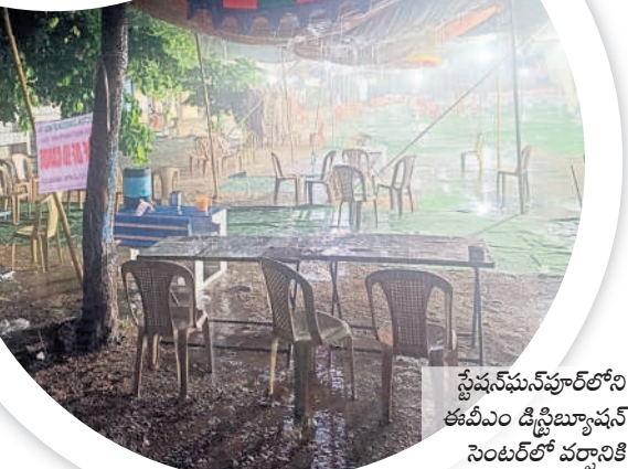
స్వేచ్ఛపూర్ లోని కమీషనరీ డిస్ట్రిబ్యూషన్ సెంటర్ లో వర్షానికి తడిసిన టెంట్