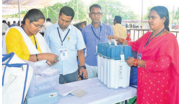
సంగారెడ్డి అంబేద్కర్ గ్రాండ్ లో సామగ్రితో సిబ్బంది

మెడక్లో ఈపీఎంలు, వీపీ ప్యాట్లతో పోలింగ్ స్టేషన్కు బయలుదేరుతున్న పోలింగ్ సిబ్బంది చారు. టాయిలెట్ల స్వీదించడంతో పాటు తాగునీటికి ఇబ్బందులు కలుగకుండా ఏర్పాట్లు చేశారు. ఆశ వర్షం, ఓఆర్ఎస్ ప్యాకెట్లు అందుబాటులో ఉండేలా చర్యలు తీసుకుంటున్నారు. యువ, దివ్యాంగ, మహిళా మోడల్ పోలింగ్ కేంద్రాల్లో మరిన్ని సౌకర్యాలు కల్పించారు. పోలింగ్ కేంద్రాల్లో మొత్తం ఫోన్ అనుమతి లేదన్నారు.