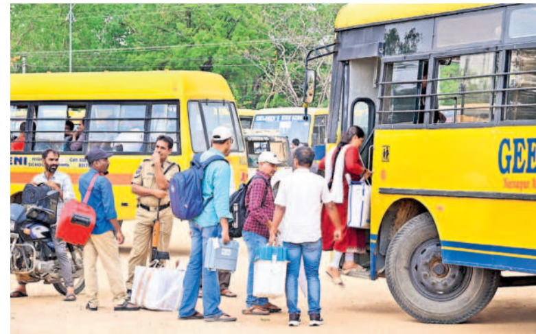
మెడక్: బస్సులో ఆపివెత్తి పోలింగ్ స్టేషన్కు బయలుదేరుతున్న సిబ్బంది