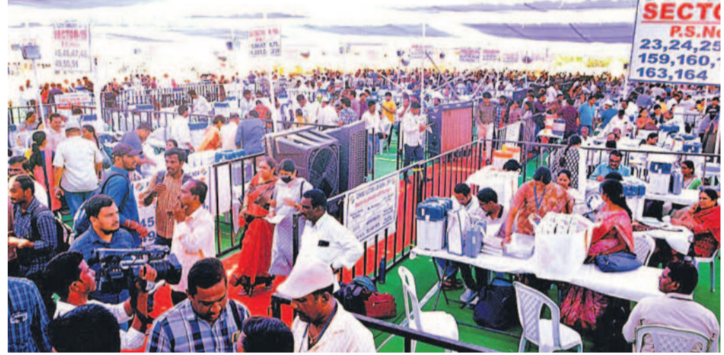
సంగారెడ్డి అంబేద్కర్ గ్రాండ్ లో సామగ్రిని నలచూసుకుంటున్న సిబ్బంది