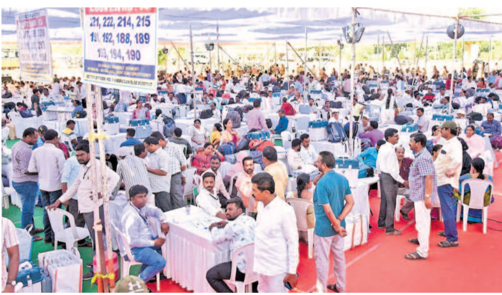
సిద్దిపేట లద్దన్ : ఇందూర్ కళాశాలలోని దిస్ట్రీబ్యూషన్ సెంటర్ వద్ద పోలింగ్ సామగ్రిని తీసుకెళ్లేందుకు సిద్దమైన సిబ్బంది