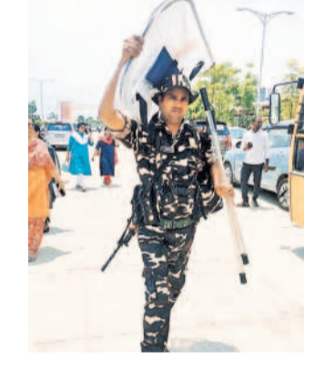
గజ్వీల్ : పోలింగ్ కేంద్రాలకు ఎన్నికల సామగ్రితో వెళ్తున్న సిబ్బంది