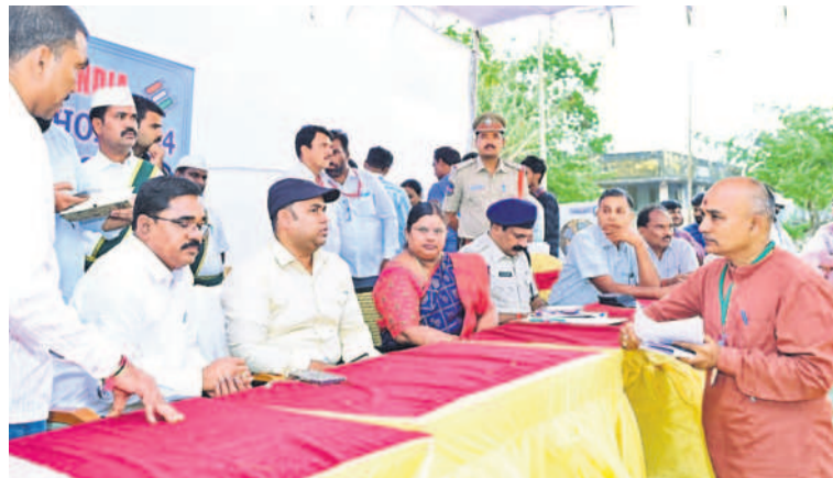
మెడక్ పోలింగ్ సిబ్బందికి సూచనలిస్తున్న అల్లా ఎన్నికల అధికారి, కలెక్టర్ రామలక్ష్మణ్