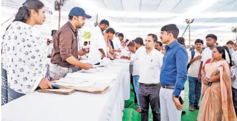
మేరీ నాట్ స్కూల్లో ఏర్పాటు చేసిన డిస్ట్రిబ్యూషన్ కేంద్రాన్ని పరిశీలిస్తున్న వికారాబాద్ కలెక్టర్, ఎన్నికల అధికారి నారాయణరెడ్డి