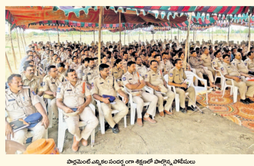
పార్లమెంటు ఎన్నికల సందర్భంగా శిక్షణలో పాల్గొన్న పోలీసులు