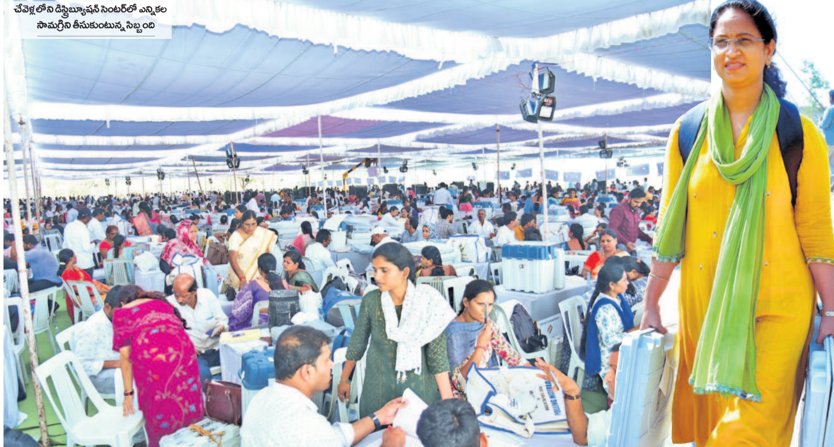
చేవెళ్లలోని డిస్ట్రిబ్యూషన్ సెంటర్లో ఎన్నికల సామగ్రిని తీసుకుంటున్న సిబ్బంది