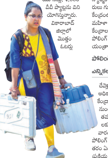
వికారాబాద్ జిల్లాలో మొత్తం ఓట్లు

రంగారెడ్డి, మే 12 (నమస్తే తెలంగాణ) : చేవెళ్ల లోక్సభ ఎన్నికకు ఉమ్మడి రంగారెడ్డి జిల్లా ఎన్నికల యంత్రాంగం అన్ని ఏర్పాట్లు పూర్తి చేసింది. 43 మంది అభ్యర్థులు బరిలో ఉండగా.. 29,38,370 మంది ఓట్లు వారి భవితవ్యాన్ని తేల్చునున్నారు. ఓటింగ్ కోసం మొత్తం 2,877 పోలింగ్ కేంద్రాలను ఏర్పాటు చేశారు. ఉదయం 7 నుంచి సాయంత్రం 6 గంటల వరకు పోలింగ్ కోసం సాగనున్నది. 13,443 మంది ఎన్నికల సిబ్బంది విధుల్లో పాల్గొంటున్నారు. 3,591 కంట్రోల్ యూనిట్లు, 10,757 బ్యాలెట్ యూనిట్లు, 4,008 వీవీ ప్యాట్లను వినియోగిస్తున్నారు.