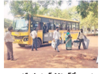
న్యాలల్ : హద్దూర్ పోలింగ్ కేంద్రాలకు ఎన్నికల సామగ్రితో వెళ్తున్న సిబ్బంది

మెడక్ ఎంపీ పథకం 2124 పోలింగ్ కేంద్రాలు మెడక్ పార్లమెంట్ పరిధిలో ఏడు సెగ్మెంట్లు ఉన్నాయి. మెడక్ లో 277 పోలింగ్ కేంద్రాలు, సర్కూలర్ 807, సిద్దిపేటలో 273, దుబ్బాకలో 253, గజ్వెల్ లో 322, సంగారెడ్డిలో 281, పటాన్ చెరులో 411 మొత్తం 2124 పోలింగ్ కేంద్రాలు ఉన్నాయి. ఎన్నికల నిర్వహణకు 2336 మంది ఓటర్లు, 2336 మంది ఏపీఎస్ లు, 4672 వోటర్లు, 166 మంది మైక్రో ఆఫీసర్లు, 214 మంది సెక్యూరిటీ అఫీసర్లు, 2124 పోలింగ్ కేంద్రాల్లో సీసీ కెమెరాలు, వెబ్ క్యామెరా ఏర్పాటు చేశారు. 7,961 బ్యాలెట్ యూనిట్లు, 2,652 కంట్లోల్ యూనిట్లు, 2,970 వీటి ప్యాజెట్లు ఉన్నాయి.