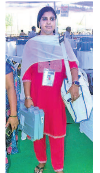
సంగారెడ్డి నుంచి పోలింగ్ కేంద్రాలకు ఎన్నికల సామగ్రితో వెళ్తున్న సిబ్బంది

ఉన్న అభ్యర్థి పోటీ నుంచి తప్పుకున్నాడని కేసీఆర్ సమ క్లంలో బీఆర్ఎస్ లో చేరాడని ఒక తప్పుడు వీడియోను ఎన్నికల సమయానికి కొద్ది గంటల ముందు విడుదల చేసి రాజీయంగా అభ్యర్థిని ప్రయత్నం చేశారు. ఫేక్ వీడియోలు తప్పుడు వార్తలను సోషల్ మీడియా వేదిక ప్రచారం చేస్తున్నారు. దయచేసి యువత, ప్రజలు ఫేక్ వీడియోలను, సోషల్ మీడియాలో వచ్చే దుప్రచారాన్ని నమ్మవద్దు. ఎందుకంటే వాళ్ళ గత చరిత్ర అట్ట ఉంది. ఇవాళ్ళ కొన్ని బోగస్ సర్వేలను కాంగ్రెస్, బీజేపీలు సోషల్ మీడియాలో విడుదల చేస్తూ మైండ్ గేమ్ ఆడు తున్నాయి. ఎంతోపాటు, గతంలో పుగ్గా, వివిధ యూనియన్ సంఘాలకు అధ్యక్షుడిగా పనిచేసే లేదా యూనియన్లను, కార్యకలకులను మోసం చేశారు. అక్కడ కార్మికుల నుంచి ఆయన తీవ్రవ్యతిరేకత ఎదురయ్యాయి. అధ్యక్షుడిగా పనిచేసే చోట హామీలు నిలుపుకోలేదు. వ్యతిరేకంగా ఉన్న బీజేపీ పార్టీలకు కొంతగా ఉన్నారు. బీడీ కార్మికులకు 30 ఏండ్ల పనిచేస్తే సీఎఫ్, పెన్షన్ అవ్వాలి. రెక్కాడితో డొక్కాడని బీడీ కార్మికులకు ఉన్న పీఎఫ్ పెన్షన్ ను బీజేపీ తీసివేసింది. మనకు వచ్చేదే 500 - 1000 రూపాయలు, ఆ వచ్చే పీఎఫ్ పెన్షన్ కలిపి నిబంధనలు పెట్టి పీఎఫ్ పెన్షన్ ను బీడీ కార్మికులను దూరం చేసింది. అదే బీడీ కార్మికుల కేసీఆర్ రూ.2 వేల భృతి ఇచ్చి వారిని కాపాడుతున్నారు. బీడీ కట్టల మీద 28 శాతం జీఎస్ టీ విధించిన బీజేపీ ఓడించాలని బీడీ కార్మికులందరూ కోగా ఉన్నారు. కలిసేమైన చట్టాలు తెచ్చి కార్మికుల కష్టాన్ని దోచుకుంటున్న బీజేపీ పార్టీ కులు తీవ్ర వ్యతిరేకంగా ఉన్నారు.