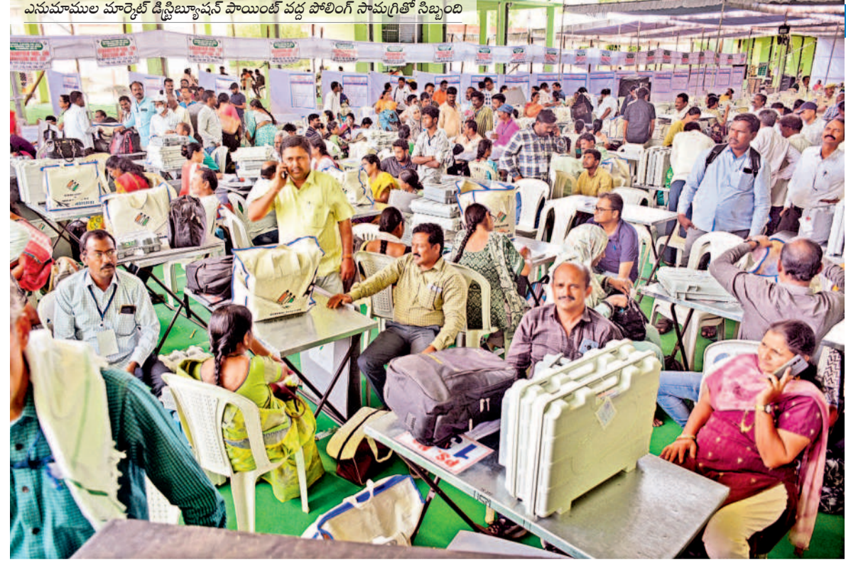
ఎనుమాముల మార్కెట్ డిస్ట్రిబ్యూషన్ పాయింట్ వద్ద పోలింగ్ సామగ్రితో నిబ్బంది