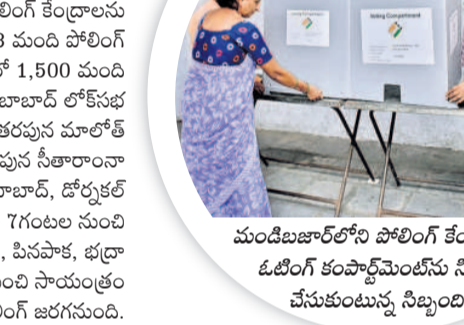
మండిబజార్ లోని పోలింగ్ కేంద్రంలో ఓటింగ్ కంపార్ట్ మెంట్ ను సిద్ధం చేసుకుంటున్న సిబ్బంది