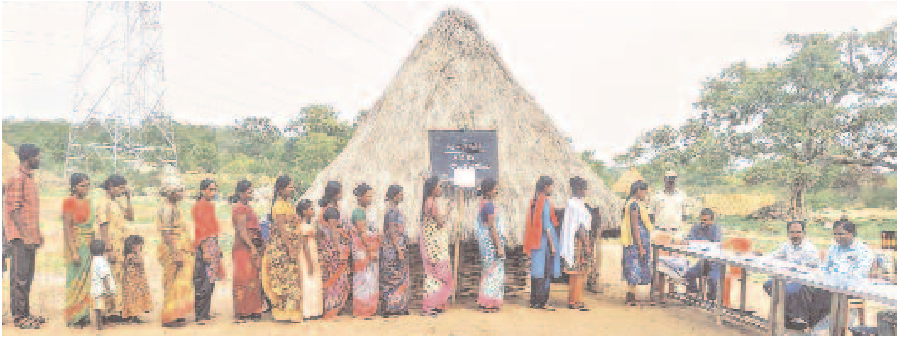
నాగర్ కర్నూల్ జిల్లాలో తాత్కాలిక పోలింగ్ కేంద్రంలో సోమవారం తమ ఓటు హక్కును వినియోగించుకుంటున్న చెంచు మహిళలు

మంగళవారం TUESDAY 14.5.2024 కరీంనగర్ KARIMNAGAR పేజీలు: 12 Pages: 12 సప్తమి మంగళవారం, సూర్యోదయ: 5-44, సూర్యాస్తమయం: 6-41. శ్రీ శ్రీ నామ సంవత్సరం ఉత్తరాయణం వసంత రుతువు వైశాఖ మాసం శుక్ల పక్షం తిథి: సప్తమి తెల్లవారుజామున 4-19 వరకు. నక్షత్రం: పుష్యమి వగలు 1-05 వరకు. వర్షం: రాత్రి 3-08 నుంచి తెల్లవారుజామున 4-54 వరకు. రాహుకాలం: వగలు 8-26 నుంచి సాయంత్రం 5-02 వరకు. దుర్భుహార్యం: ఉదయం 8-20 నుంచి ఉదయం 9-11 వరకు, పునరుద్ధార్యం: రాత్రి 11-05 నుంచి రాత్రి 11-50 వరకు. అమృతకాలం: ఉదయం 6-14 నుంచి ఉదయం 7-56 వరకు, వృషభ సంక్రమణం సాయంత్రం 5-53 గంటలకు. PUBLISHED FROM KARIMNAGAR • HYDERABAD • WARANGAL • KHAMMAM • NALGONDA • MAHABUBNAGAR • NIZAMABAD www.ntnews.com 00 /ntdailyonline