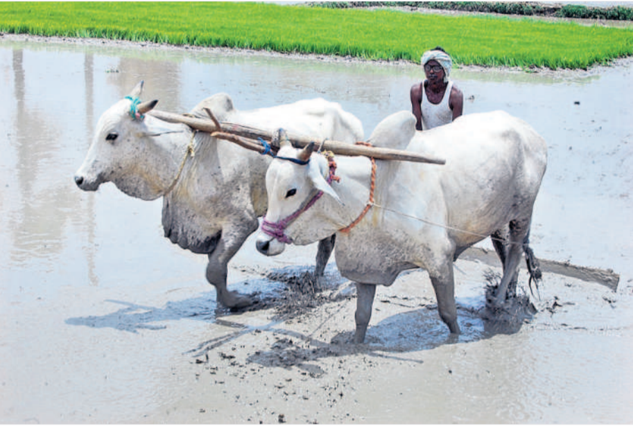
సాయరంగంపై దశారుల కన్నుపడింది. చిన్న, సన్నకారు రైతులను లోబర్చుకొని దశారులు నేరుగా రుణాలివ్వడం పురుషేకారు. తద్వారా అప్పు కోసం రైతులు బ్యాంకులను ఆశ్రయించడం మానేసి దశారుల వద్ద బారులు తిరారు. ఆ విధంగా గ్రామీణ వ్యవసాయరంగం, రైతులు పక్కనూ పట్టారు. దీన్ని అడగనూ చేసుకున్న కాంగ్రెస్ ప్రభుత్వం, ఇతర రాజకీయ పార్టీలు తమ సార్వ ప్రయోజనాల కోసం రుణాలు మాఫీ చేస్తామంటూ ముందుకు వచ్చాయి. క్రమంగా చర్యలు ఉండాలని కొన్ని నిబంధనలను అమలుచే రైతులకు ప్రభుత్వాల రుణమాఫీ చేయడం, కొందరికి చేయకపోవడం వల్ల దేశంలో రైతుల ఆత్మహత్యలు పెరిగిపో

2015లో రిజర్వ్ బ్యాంక్ ఆఫ్ ఇండియా నిబంధనలు కఠినంగా ఉన్నప్పటికీ గత బీఆర్ఎస్ ప్రభుత్వం రాష్ట్రంలో రైతు రుణమాఫీ పథకాన్ని చలు దఫాలుగా అమలుచేసింది. 2018 వరకు రూ.లక్ష వరకు రుణమాఫీ చేసింది. కానీ అప్పుడు ప్రతిపక్షంలో కాంగ్రెస్ పార్టీ రుణమాఫీ విషయంలో ప్రజలను పక్కనూ బిజినెస్ బీఆర్ఎస్ ప్రభుత్వంపై విషం విమ్మింది. అంతేకాకుండా తాము అధికారంలోకి వస్తే డిసెంబర్ 9న రైతులకు రూ.2 లక్షల రుణమాఫీ చేస్తామని హామీ ఇచ్చింది. తీరా అధికారంలోకి వచ్చాక డిసెంబర్ 9న రూ.2 లక్షల రుణమాఫీ ఏమీ కానీ, కనీసం లక్ష రూపాయల రుణమాఫీని కూడా చేయలేకపోయింది. ఇది కాంగ్రెస్ ప్రభుత్వ ఆసమర్థతకు పరాకాష్ఠ. ఇదిలా ఉంటే ఆగస్టు 15 వరకు రూ.2 లక్షల రుణమాఫీ చేస్తామని మరోసారి ప్రజలను మోసం చేయడానికి ప్రయత్నిస్తున్నది.