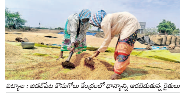
చిట్టాల : జడల్పేట కొనుగూలో కేంద్రంలో ధాన్యాన్ని ఆరబెడుతున్న రైతులు