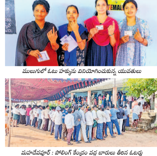
ములుగులో ఓటు హక్కును వినియోగించుకున్న యువతులు