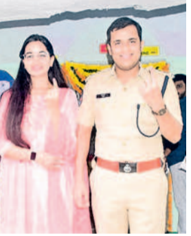
ఏటూరునాగారం : బీఆర్ఎస్ ములుగు జిల్లా అభ్యర్థులు అత్తివరగంపట్టణం దంపతులు