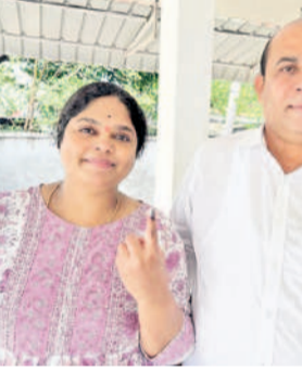
ములుగు దుర్రలో : సెల్ఫీ ప్యాంట్ వద్ద ఎన్నికల సిబ్బందితో కలెక్టర్ ఇలా శ్రీమతి, అదనపు కలెక్టర్ శ్రీజి