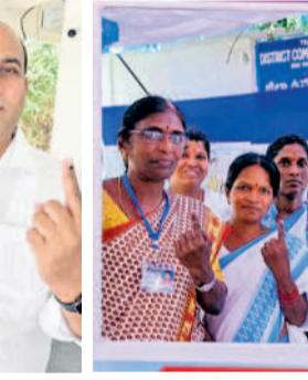
ములుగులో మంత్రి సీతక్క, కాటారం మండలం దన్నారంలో ఓటు హక్కును వినియోగించుకున్న మంత్రి శ్రీధర్ బాబు