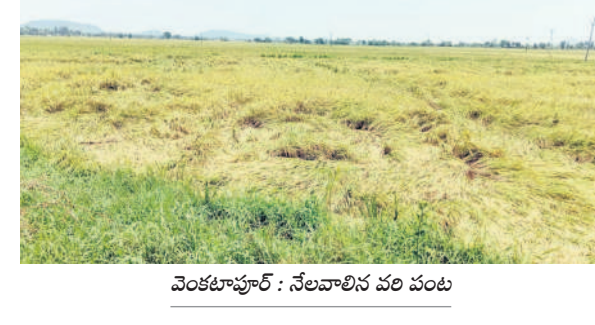
వెంకటాపూర్ : నేలవాలిన వరి పంట