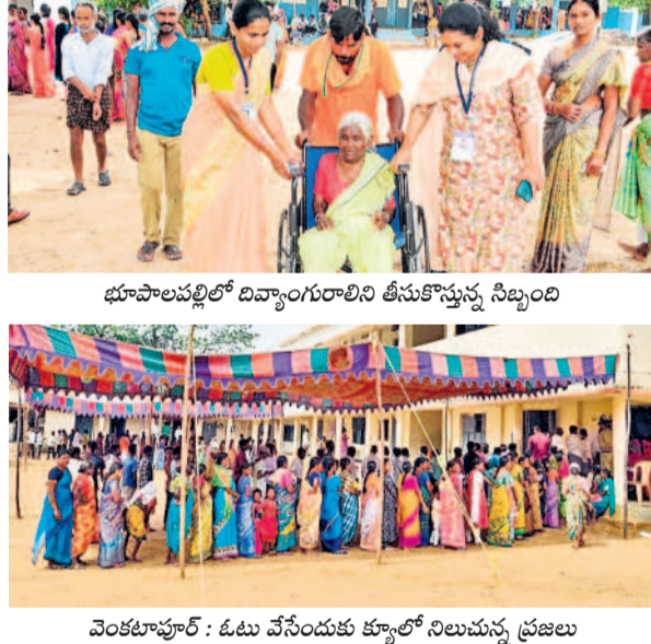
భూపాలపల్లిలో దివ్యాంగులాలిని తీసుకొస్తున్న సిబ్బంది