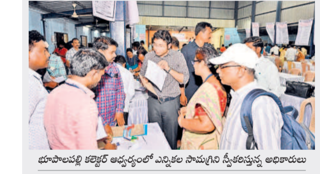
భూపాలపల్లి కలెక్టర్ అదనపు ఎన్నికల సామగ్రిని స్వీకరిస్తున్న అధికారులు