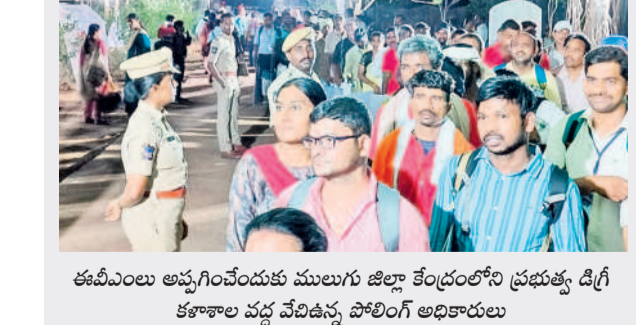
ఈవీఎంలు అప్పగించేందుకు ములుగు జిల్లా కేంద్రంలోని ప్రభుత్వ డిగ్రీ కళాశాల వద్ద వేచిఉన్న పోలింగ్ అధికారులు