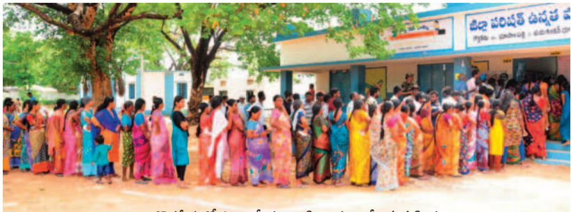
గొర్రపేటలో ఓటు వేయడానికి బారులు తీసిన మహిళలు

■ అసెంబ్లీ ఎన్నికల కంటే తగ్గిన ఓటింగ్ ■ పోలింగ్ సరళిని పరిశీలించిన అభ్యర్థులు ■ ఓటిసిన మంత్రులు, ఎమ్మెల్యేలు, ప్రజా ప్రతినిధులు