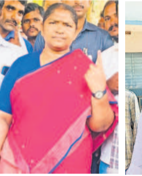
గణపతి : బుద్ధారంలో ఎమ్మెల్యే గండ్ర దంపతులు