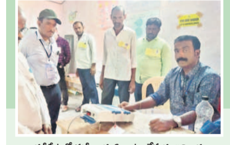
నవీపేటలో ఈవీఎంలను ఏర్పాటు చేస్తున్న అధికారులు