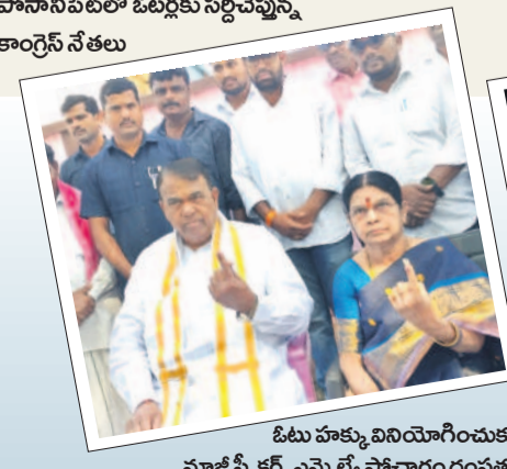
పోసానపేట్లో ఓటర్లకు సర్కిచ్చే కాంగ్రెస్ నేతలు

రామారెడ్డి, మే 13: రామారెడ్డి మండలం పోసానపేట్ గ్రామంలోని కొంతమంది మహిళలు ఓటు వెయ్యబోమని కాలనీలో భైరాంతులున్నారు. ఓ వర్గం కాంగ్రెస్ నాయకుడు మరోవర్గం మహిళలను ఓటు వెయ్యకపోతే ఓటింగ్ ఏంలేదని అన్నాడని ఆరోపిస్తూ మహిళలు నిరసన తెలిపారు. మరోవర్గం కాంగ్రెస్ నాయకులు మహిళలను సముదాయించడంతో పోలింగ్ కేంద్రానికి వెళ్లారు.