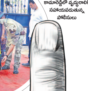
కామారెడ్డిలో వృద్ధులకు సహాయపడుతున్న పోలీసులు

-నిజామాబాద్, మే 13 (నమస్తే తెలంగాణ ప్రతినిధి)