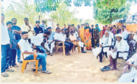
ఓటు వేయకుండా నిరసన తెలుపుతున్న రాంసాగర్ తండావాసులు

ఇంద్రావతి, మే 13: ఇంద్రావతి మండలం సిర్పాపల్లి గ్రామపరిధిలోని రాంసాగర్ తండాలో గిరిజనలు మధ్యాహ్నం వరకు ఓటియలేదు. గ్రామానికి రోడ్డు సౌకర్యం, ఇతర సమస్యలను పరిష్కరించాలని డిమాండ్ చేస్తూ తొలుత పోలింగ్ ను బహిష్కరిస్తున్నామని స్పష్టం చేశారు. విషయం తెలుసుకున్న పలువురు నాయకులు తండాకు చేరుకొని ఎన్నికల కోడ్ ముగిసిన తర్వాత పనులు ప్రారంభిస్తామని హామీనివ్వడంతో గిరిజనలు పోలింగ్ కేంద్రానికి కదిలారు.