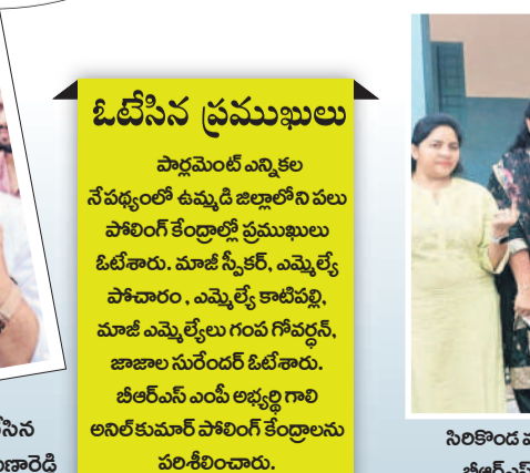
నల్లమడుగులో ఓటిసేన మాజీ ఎమ్మెల్యే జాజాల