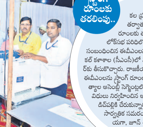
పోలింగ్ అనంతరం డివైపిలోని సీఎస్సీ వద్ద ఈవీఎంలను స్టాంక రూరాలకు తరలించారు

సాంస్కృతిక సమారంలో ప్రజా చైతన్యం వేల్పింది. పోలింగ్ కేంద్రాలకు ఇందూరు ప్రజా 'ఓటిత్తింది'. ఎవ్వరిలాగో పట్టణాల కన్నా పల్లెల్లోనే పోలింగ్ ఎక్కువగా నమోదైంది. చెదురుమదురు ఘటనలు మినహా నిజామాబాద్, జహీరాబాద్ లోక్సభ సెగ్మెంట్లలో సోమవారం ఓటింగ్ ప్రశాంతంగా జరిగింది. అలివల్లి పనులు చేపట్టడం లేదని కొన్ని తండాల్లో ఎన్నికలను బహిష్కరించారు. అధికారులు హడావిడి చేసిన వెళ్లి వారిని సమదాయించి ఓటింగ్ను ప్రారంభించారు. రాత్రి 10 గంటల వరకు 'నిజామాబాద్'లో 71.47 శాతం, జహీరాబాద్'లో 72.48 శాతం పోలింగ్ నమోదై నట్లు అధికారులు తెలిపారు. వెలిగిన ఓటింగ్ శాతం ఎవరికి అనుకూలంగా మార నున్నదనే అంశంపై జోరుగా వర్త సాగు తున్నది. జూన్ 4వ తేదీన ప్రజాతీర్పు వెలు పడనున్నది.