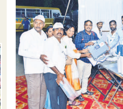
పోలింగ్ అనంతరం డివైపిలోని సీఎస్సీ వద్ద ఈవీఎంలను స్టాంక రూరాలకు తరలించారు

స్టాంక యాలకు తరలింపు.. ఎన్నికల ప్రక్రియ ముగిసిన తర్వాత ఈవీఎంలను స్టాంక రూరాలకు తరలించారు. నిజామాబాద్ లోక్సభ పరిధిలోని ఏడు అసెంబ్లీ సెగ్మెంట్లకు సంబంధించిన ఈవీఎంలను డివైపిలోని క్రిస్టియన్ మెడికల్ కళాశాల (సీఎస్సీ)లో ఏర్పాటు చేసిన కంటింగ్ సెంటర్ కు తీసుకొచ్చారు. రాజీయ పార్టీల ప్రతినిధుల సమక్షంలో ఈవీఎంలను స్టాంక రూరాలలో భద్రపరిచారు. కొంట్ల, జగిత్యాల అసెంబ్లీ సెగ్మెంట్లలోని దూర ప్రాంతాల్లో ఎన్నికల విధులు నిర్వహించిన అధికారులు అర్ధరాత్రి తర్వాత డివైపికి చేరుకున్నారు. నెలవారీ పాటు సాగిన సాంస్కృతిక సమారంభం తరువాత అంకం ముగియగా, జూన్ 4న కంటింగ్ నిర్వహించనున్నారు.