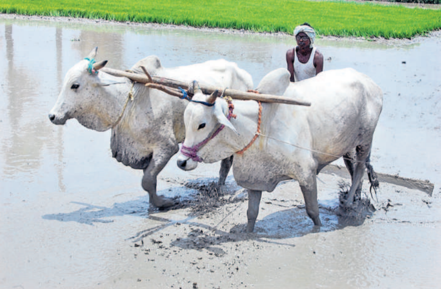
సాయరంగంపై దశారుల కన్నపడింది. చిన్న, సన్నకారు రైతులను లోబర్చుకొని దశారులు నేరుగా రుణాలివ్వడం పురుషాణాలు. తద్వారా అప్పు కోసం రైతులు బ్యాంకులను ఆశ్రయించడం మానేసి దశారుల వద్ద బారులు తీరారు. ఆ విధంగా గ్రామీణ వ్యవసాయరంగం, రైతులు పక్కనూర్చి పట్టారు. దీన్ని అడగనూ చేసుకున్న కాంగ్రెస్ ప్రభుత్వం, ఇతర రాజకీయ పార్టీలు తమ సార్వత్్ర ప్రయోజనాల కోసం రుణాలు మాఫీ చేస్తామంటూ ముందుకు వచ్చాయి. క్రమంగా చర్యలు ఉండాలని కొన్ని నిబంధనలను అమలుచే రైతులకు ప్రభుత్వాల రుణమాఫీ చేయడం, కొందరికి చేయకపోవడం వల్ల దేశంలో రైతుల ఆత్మహత్యలు పెరిగిపో

2015లో రిజర్వ్ బ్యాంక్ ఆఫ్ ఇండియా నిబంధనలు కఠినంగా ఉన్నప్పటికీ గత బీఆర్ఎస్ ప్రభుత్వం రాష్ట్రంలో రైతు రుణమాఫీ పథకాన్ని చలు దఫాలుగా అమలుచేసింది. 2018 వరకు రూ.లక్ష వరకు రుణమాఫీ చేసింది. కానీ అప్పుడు ప్రతిపక్షంలో కాంగ్రెస్ పార్టీ రుణమాఫీ విషయంలో ప్రజలను పక్కనూర్చి బీఆర్ఎస్ ప్రభుత్వంపై విషం విమ్మింది. అంతేకాకుండా తాము అధికారంలోకి వస్తే డిసెంబర్ 9న రైతులకు రూ.2 లక్షల రుణమాఫీ చేస్తామని హామీ ఇచ్చింది. తీరా అధికారంలోకి వచ్చాక డిసెంబర్ 9న రూ.2 లక్షల రుణమాఫీ ఏమీ కానీ, కనీసం లక్ష రూపాయల రుణమాఫీని కూడా చేయలేకపోయింది. ఇది కాంగ్రెస్ ప్రభుత్వ ఆసమస్తకకు పరాకాష్ఠ. ఇదిలా ఉంటే ఆగస్టు 15 వరకు రూ.2 లక్షల రుణమాఫీ చేస్తామని మరోసారి ప్రజలను మోసం చేయడానికి ప్రయత్నిస్తున్నది.