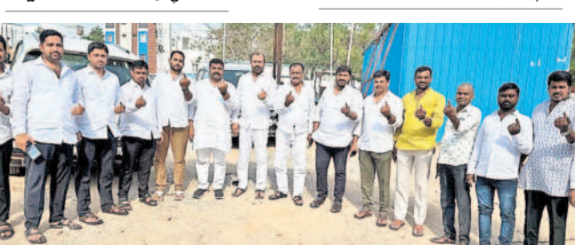
నార్సింగ్ లో ఓటు వేసిన బీఆర్ఎస్ నాయకులు, మున్సిపల్ కమిటీ సభ్యులు, మున్సిపల్ కమిటీ సభ్యులు