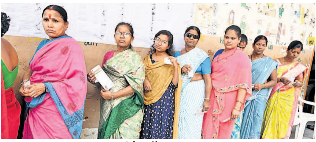
ఫిలింగ్ లో ఓటు వేసేందుకు వచ్చిన మహిళలు