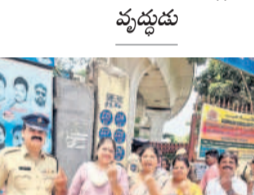
యూ.సుప్రగూడలో ఓటు వేసిన అనంతరం ఓటర్లు..