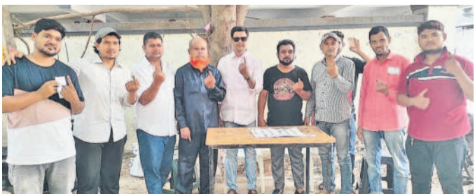
హిమాయత్ నగర్ లో సీనియర్ నాయకులు, మున్సిపల్ కమిటీ సభ్యులు, తదితరులు