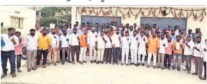
ఖానాపూర్ లో ఓటు హక్కును వినియోగించుకున్న నాయకులు, ప్రజలు