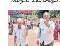
ఓటు వేసిన 82 ఏండ్ల వృద్ధుడు