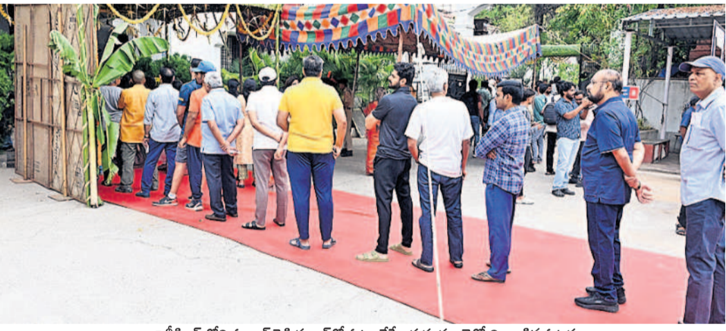
జూబ్లీహిల్స్ లోని ఓటుల రెడ్డి స్కూల్ లో ఓటు వేసేందుకు క్యూలైన్లో నిలబడిన ఓటర్లు