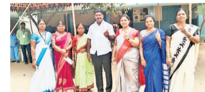
నర్సూరులో ఓటు హక్కును వినియోగించుకున్న జెడ్పీటీసీ తస్మి దంపతులు, తదితరులు