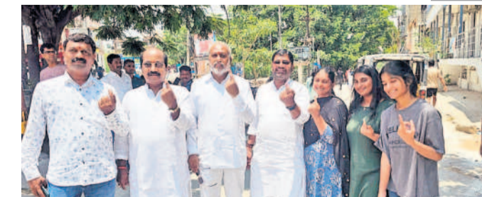
మణికోండలో మున్సిపల్ కమిటీ సభ్యులు, మున్సిపల్ కమిటీ సభ్యులు