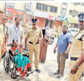
నార్సింగ్ మున్సిపాలిటీ పరిధిలో ఓటు హక్కును వినియోగించుకునేందుకు పోలింగ్ కేంద్రానికి వచ్చిన వృద్ధులు