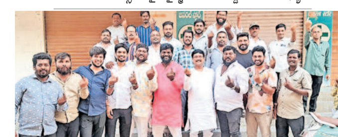
మైలారదేవప్పల్లి లక్ష్మీగూడలో సీనియర్ నాయకులు, మున్సిపల్ కమిటీ సభ్యులు