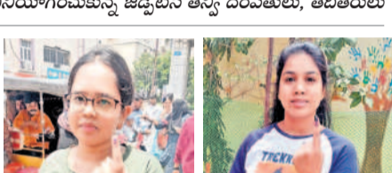
లోక్ సభ ఎన్నికల్లో మొదటిసారి ఓటు హక్కును వినియోగించుకున్న యువ ఓటర్లు