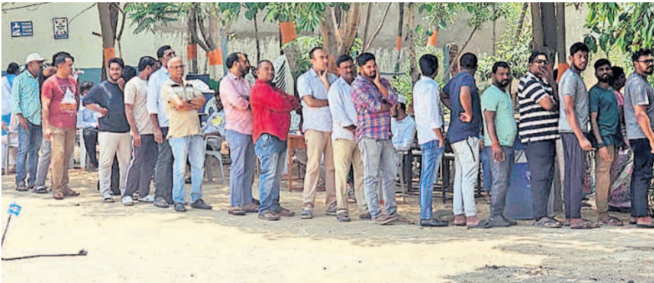
రాజేంద్రనగర్ నియోజకవర్గంలోని నార్సింగ్ పోలింగ్ కేంద్రంలో బారులు తీరిన ఓటర్లు

పుణ్య సాగినప్పటికీ పోలింగ్ బూత్ లు దొరక్కపోవడంతో అనేక మంది ఓటర్లు ఇబ్బందులను ఎదుర్కొవలసి వచ్చింది. వెబ్ కార్యక్రమం ఏర్పాటుతో పోలీసు అధికారులు సైతం మంచి సహకారాన్ని అందించారు. కొన్ని పోలింగ్ స్థానాల వద్ద తాగునీటి పనితీరును కచ్చితంగా పర్యవేక్షించి ఓటర్లు ఇబ్బంది పడకుండా సున్నితమైన ప్రాంతాల్లో పోలీసు బలగాలు ముందుగానే దృష్టిసారించి పటిష్టమైన చర్యలు చేపట్టి ఎన్నికలను సజావుగా నిర్వహించేందుకు తోడ్పాటునందించారు. కొన్ని చోట్ల ఈవీఎంలకు మొరాయింపారు.