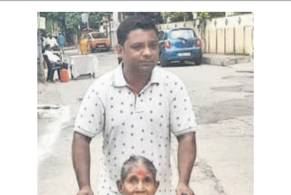
సిబ్బంది సాయంతో వృద్ధురాలు..