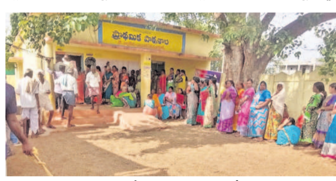
నవాబుపేట: యెల్లకొండ గ్రామంలో..