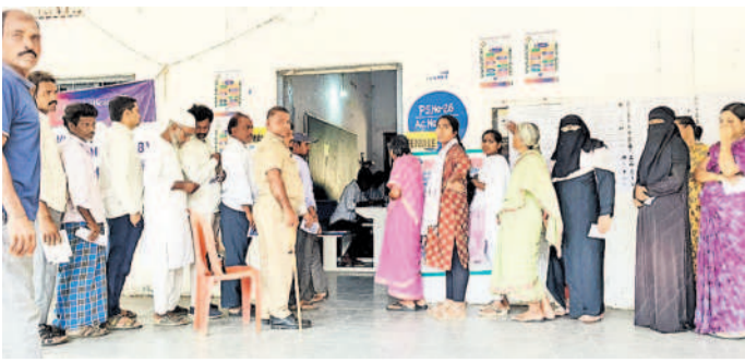
తాండూరు : ఓటిసేనందుకు క్యూలో ఉన్న ఓటర్లు