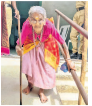
పరిగి: ఓటు వేసే వస్తున్న వృద్ధురాలు