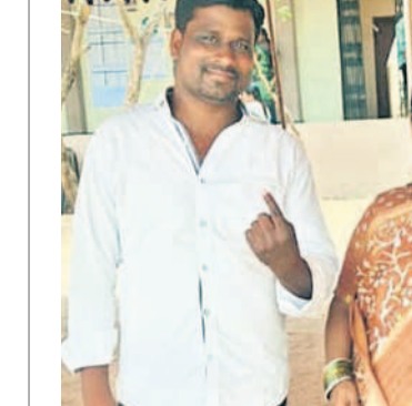
అబ్దుల్లాపూర్ మెట్ల: ఓటు హక్కు వినియోగించుకున్న అబ్దుల్లాపూర్ మెట్ల ఎంపీ