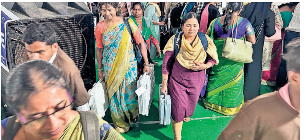
పోలింగ్ కేంద్రాల నుంచి ఈవీఎలను చేపల్లలోని కొంటింగ్ సెంటర్ కు తీసుకొచ్చిన ఎన్నికల సిబ్బంది