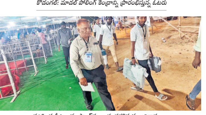
పరిగి: ఈవీఎలను స్టాంబింగ్ దారులకు తరలిస్తున్న అధికారులు