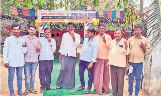
ధారూరు: బింకకుంట అదర్స్ పోలింగ్ కేంద్రంలో..