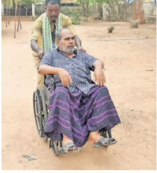
దోమ: ఓటు వేసేందుకు వెళుతున్న దివ్యాంగుడు