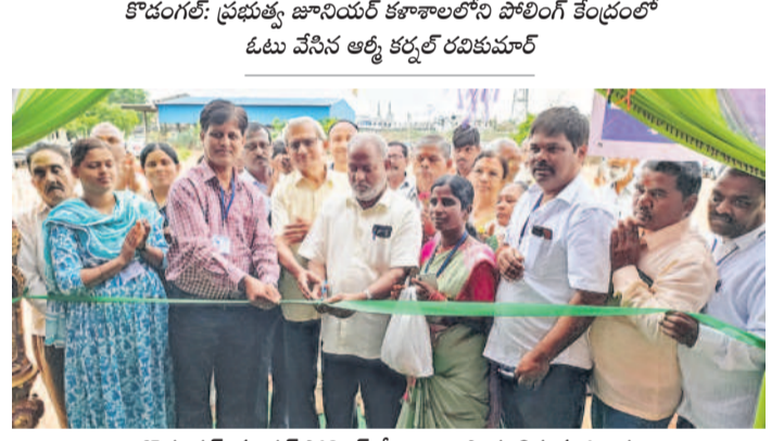
కొడంగల్: మాడల్ పోలింగ్ కేంద్రాన్ని ప్రారంభిస్తున్న ఓటర్లు