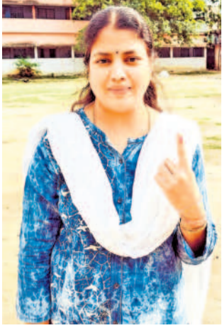
తాండూరు: ఓటు హక్కు వినియోగించుకున్న యువతి