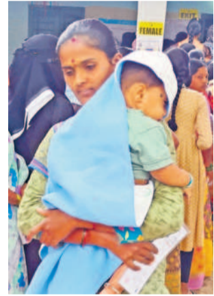
బొంరాసపేట: తుంజిమెట్లలో చంటిపాపతో వచ్చి ఓటిసేన మహిళ