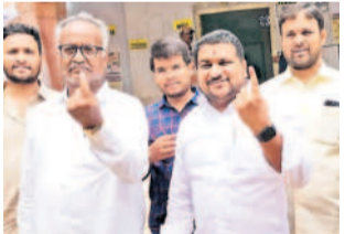
తాండూరు: ప్రభుత్వ పాఠశాలలో ఓటు వినియోగించుకున్న రాష్ట్ర బీసీ కమిషన్ సభ్యుడు శుభప్రదీప్ కేలే