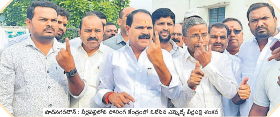
పాదనగరం: వీరపల్లిలోని పోలింగ్ కేంద్రంలో ఓటిసిన ఎమ్మెల్యే వీరపల్లి శంకర్