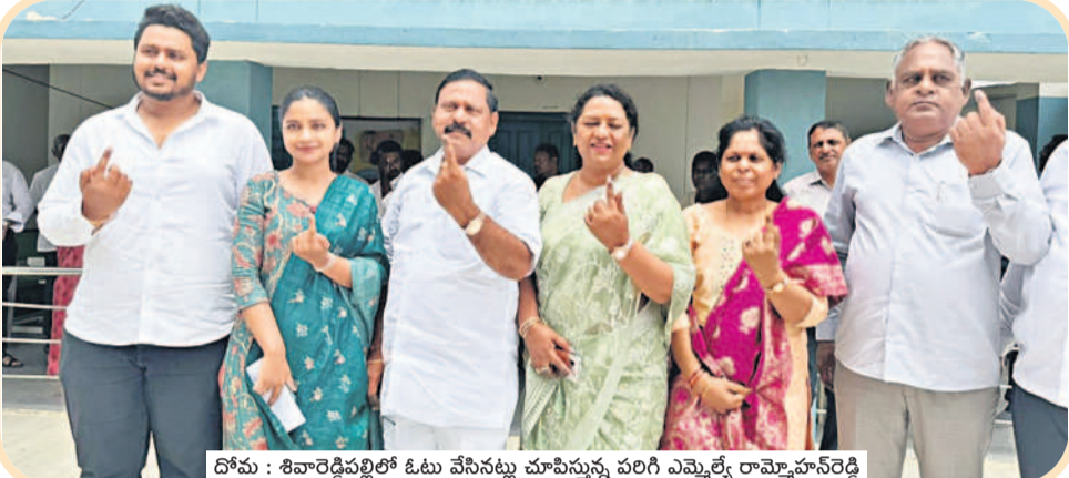
దోమ: శివారెడ్డిపల్లిలో ఓటు వేసినట్లు చూపిస్తున్న పరిగి ఎమ్మెల్యే రామ్మోహన్ రెడ్డి