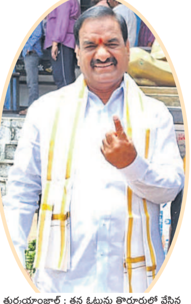
కుర్రాయంజూర్: తన ఓటును తొర్రూరులో వేసిన ఇబ్రహీంపట్నం ఎమ్మెల్యే మల్లారెడ్డి రంగారెడ్డి