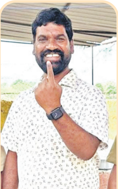
వేణ్కటేశ్వరారావు: పామనలో ఓటిసిన బత్తిరి సత్తి