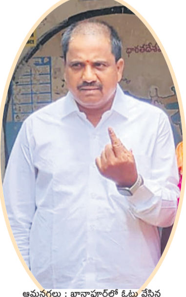
అమనగల్లు: ఖాసాపూర్లో ఓటు వేసిన కల్వకుర్తి ఎమ్మెల్యే కనీరెడ్డి నారాయణరెడ్డి