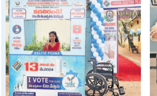
మొయినాబాద్లోని అజీజ్ నగర్లో సెల్ఫీ పాయింట్ వద్ద పోలింగ్ కేంద్రాలకు రావటంపై ఓటర్లు