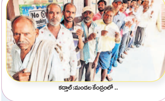
కడ్రాల్: మండల కేంద్రంలో..