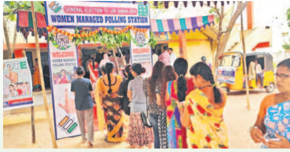
మొయినాబాద్లోని హిమాయత్ నగర్లోని పోలింగ్ స్టేషన్లో ఓటు వేసేందుకు క్యూలో నిల్చున్న మహిళలు