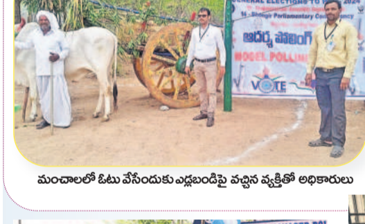
మండలంలో ఓటు వేసేందుకు ఎడ్లబండిపై వచ్చిన వ్యక్తికి అధికారులు