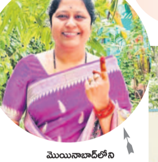
మొయినాబాద్లోని హిమాయత్ నగర్లో..