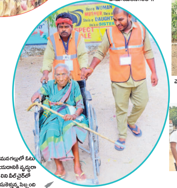
అమనగల్లులో ఓటు వేసేందుకు వచ్చిన వృద్ధురాలిని వీల్ చైర్లో తీసుకెళ్తున్న సిబ్బంది