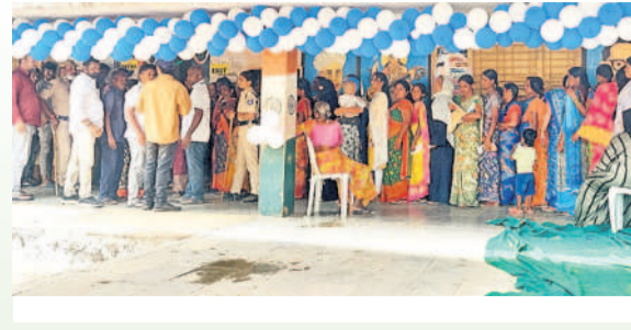
ఫాబాద్: పోలీసు పోలింగ్ కేంద్రానికి ఓటు వేసేందుకు వచ్చిన జనాలు