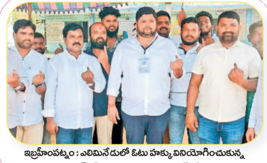
ఇబ్రహీంపట్నం: ఎలిమినేషన్లో ఓటు హక్కు వినియోగించుకున్న టీఆర్ఎస్ రాష్ట్రపాలకుడు ప్రశాంత్ రెడ్డి