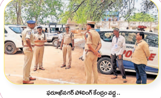
ఫరూఖ్ నగర్ పోలింగ్ కేంద్రం వద్ద..