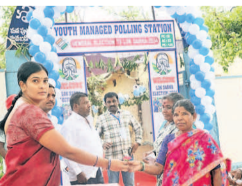
మొయినాబాద్లోని అజీజ్ నగర్లో ఓటు వేసేందుకు వచ్చిన మహిళా ఓటరును గులాబీ ఫుల్లు ఇచ్చి ఆహ్వానిస్తున్న రెవెన్యూ సిబ్బంది