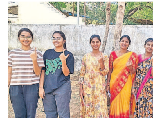
ఫాదీనగర్లో ఓటు హక్కును సద్వినియోగం చేసుకున్న మహిళలు, యువతులు