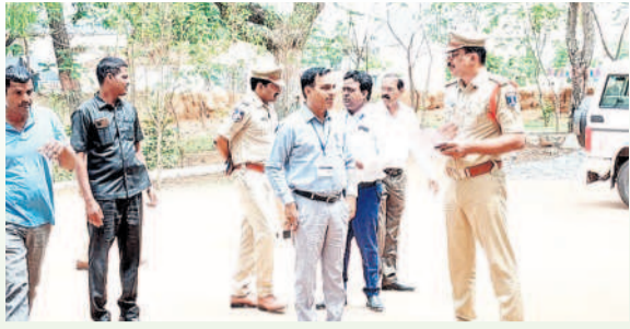
ఫరూఖ్ నగర్ పోలింగ్ కేంద్రాన్ని పరిశీలించి వివరాలు తెలుసుకుంటున్న ఎన్నికల పోలీస్ అధికారుల సమూహం