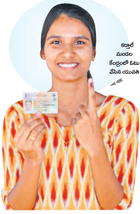
కడ్రాల్ మండల కేంద్రంలో ఓటు వేసిన యువతి

- నమస్తే తెలంగాణ, న్యూస్ నెట్వర్క్, మే 13