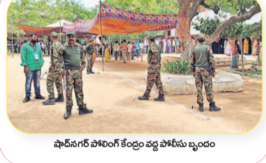
ఫాదీనగర్ పోలింగ్ కేంద్రం వద్ద పోలీసు బృందం