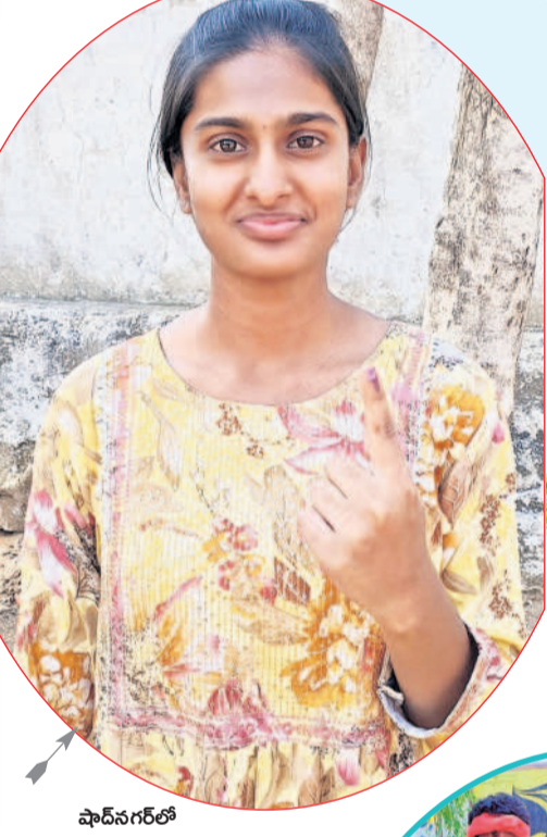
ఫాదీనగర్లో ఓటు వేసిన యువతి