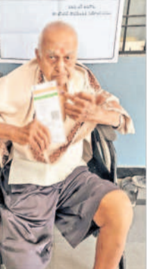
ఇబ్రహీంపట్నంలో ఓటు హక్కు వినియోగించుకున్న వృద్ధుడు