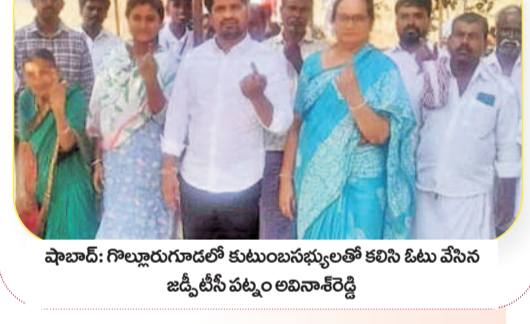
ఫాబాద్: గొల్లూరుగూడలో కుటుంబ సంఘాలలో కలిసి ఓటు వేసిన జడ్పీటీసీ చట్టం అధికారి రెడ్డి