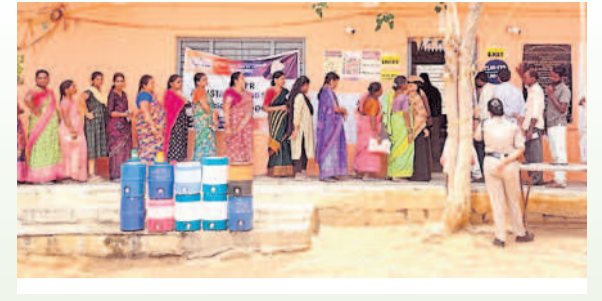
ఫాబాద్లో బారులుదీరిన ఓటర్లు