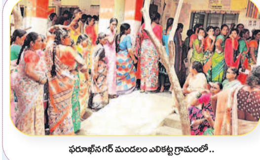
ఫరూఖ్ నగర్ మండలం ఎలికట్ల గ్రామంలో..