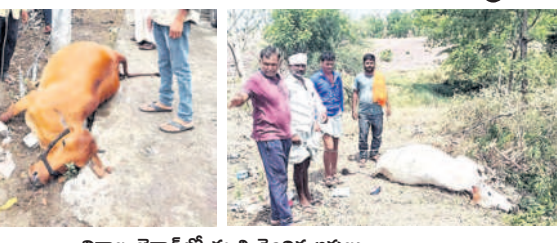
నిరాల, బెల్లూరిలో మృతి చెందిన ఆవులు