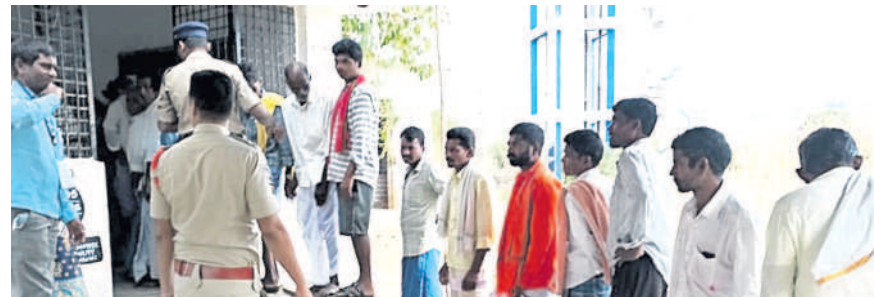
ఓటు వేసేందుకు క్యూలో నిలబడ్డ ఓటర్లు

బోధ, మే 14 : ఆదిలాబాద్ పార్లమెంట్ ఎన్నికలో భాగంగా సోమవారం జరిగిన ఎన్నికల పోలింగ్ బోధ నియోజకవర్గం పరిధిలో 78.16 శాతం పోలింగ్ నమోదైంది. 2,11,913 ఓటర్లకు గాను లక్షా 65,157 మంది తమ ఓటు హక్కు వినియోగించుకున్నారు. 9 మండలాల పరిధిలోని 908 పోలింగ్ కేంద్రాలకు గాను పది పోలింగ్ కేంద్రాలలో 90 శాతానికి పైగా పోలింగ్ నమోదైంది. పోలింగ్ కేంద్రం-45 అంబూగల్ 90.30, 62 సాకినపూర్ 90.19, 69 మేకు గూడలో 90.58, 72 రత్నపూర్లో 92.06, 75 కోసాయిలో 92.54, 77పల్లి(బీ)లో 90.37, 140 అడెంగా(బీ)లో అత్యధికంగా 93.86, 156 సల్యాడలో 93.35, 168/పి జోగిశంకర్ 93.33, 277 గజలిలో 91.25 శాతం పోలింగ్ నమోదైంది. అత్యల్పంగా ఇక్కడలోని పోలింగ్ కేంద్రం-131లో కేవలం 58.93 శాతం మాత్రమే పోలింగ్ నమోదైంది.