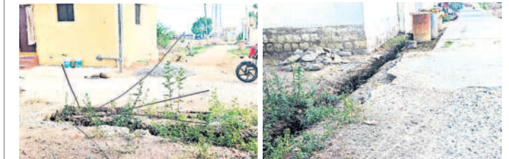
నాడు ప్రమాదకరంగా ఉన్న ఇనుప కడ్డీలు