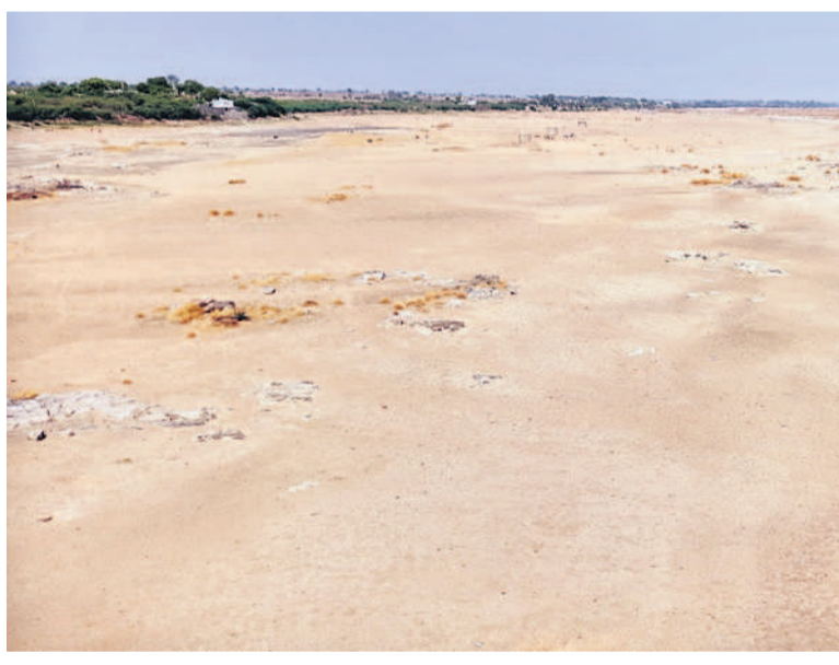
తుంగభద్ర నదిలో తేలిన రాళ్లు, ఇసుక మేటలు