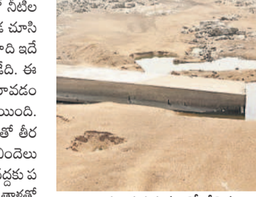
తుంగభద్ర నదిలో తేలిన రాళ్లు, రప్పలు

అయిది, మే 14 : తుంగభద్ర నది తడారించింది. దాదాపు ఐదు నెలలుగా నీటి ప్రవాహం అడుగంటింది. నదిలో నీటి లభ్యత లేకుండా పోయింది. ప్రస్తుతం రాళ్లు తేలి ఎక్కడ చూసినా ఇసుక మేటలు కనిపిస్తూ నీటిజాడ కరువైంది. గతేడాది ఇదే సమయంలో నదిలో నీటి ప్రవాహం స్వల్పంగా ఉండేది. ఈ ఏడాది ఎగువ నుంచి వరద అంతంత మాత్రంగానే రావడంతో అక్షిణం, నవంబర్ నెలల్లోనే ప్రవాహం నిలిచిపోయింది. ప్రస్తుతం నదిలో చుక్క నీరు కనిపించిన దుస్థితి. దీంతో తీర ప్రాంత పల్లెల్లో గొంతెండుతున్నది. నీళ్ల కోసం ఖాళీ బిందెలు పట్టుకొని కిలోమీటర్ల దూరంలోని వ్యవసాయ బోర్ల వద్దకు పరుగులు పెడుతున్నారు. మరికొందరు బైకెలు, సైకిళ్లపై తాళ్లతో బిందెలు కట్టుకొని నీటిని తెచ్చుకుంటున్నారు. తాగునీటి కోసం ప్రజలు అలమటిస్తున్నారు. కొందరికే నదిలో వెలిమెల ద్వారా నీటిని తెచ్చుకుంటున్నారు. తెలంగాణ-ఏపీ సరిహద్దులోని నదిలో రెండు, మూడు కిలోమీటర్ల వెళ్లి.. సుమారు 2 గంటల పాటు నీటిని తోడి తెచ్చుకుంటున్నారు. ప్రజలతోపాటు పశుపక్షా