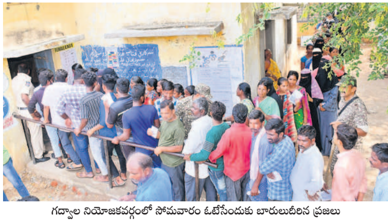
గద్వాల నియోజకవర్గంలో సోమవారం ఓటింగుకు బూతులుదీరిన ప్రజలు