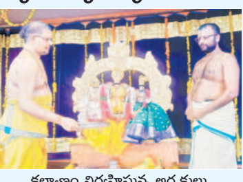
కల్యాణం నిర్వహిస్తున్న అర్చకులు

భద్రాచలం, మే 15: భద్రాచలం స్వామి ఆలయం లోని బేడా మండ పంలో రామయ్యకు అర్చకులు బుధ కల్యాణం నిర్వహిం