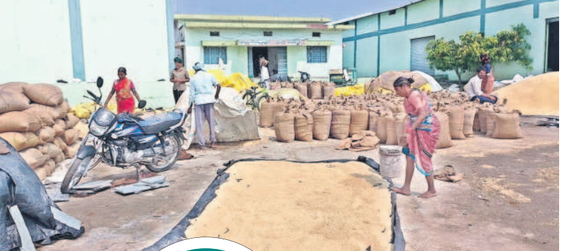
తడిసిన దాన్యాన్ని ఆరబెడుతున్న రైతులు