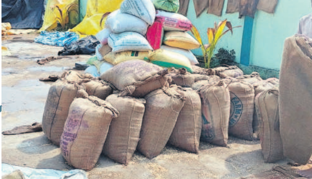
పెద్దకొడవగల్ సాస్టెబిల్ తడిసిన జొన్న బస్తాలు