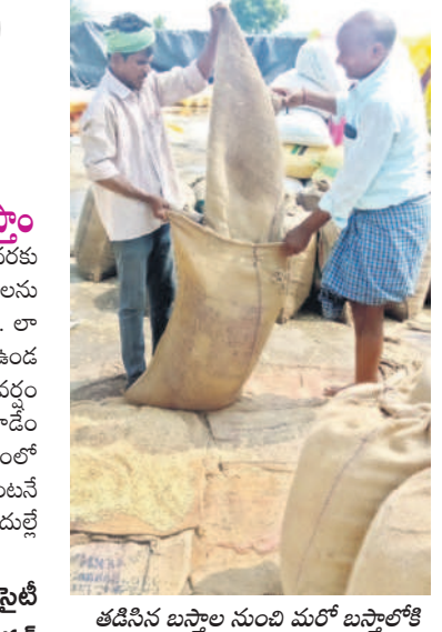
తడిసిన బస్తాల నుంచి మరో బస్తాలోకి జొన్నలను మారుస్తున్న రైతులు