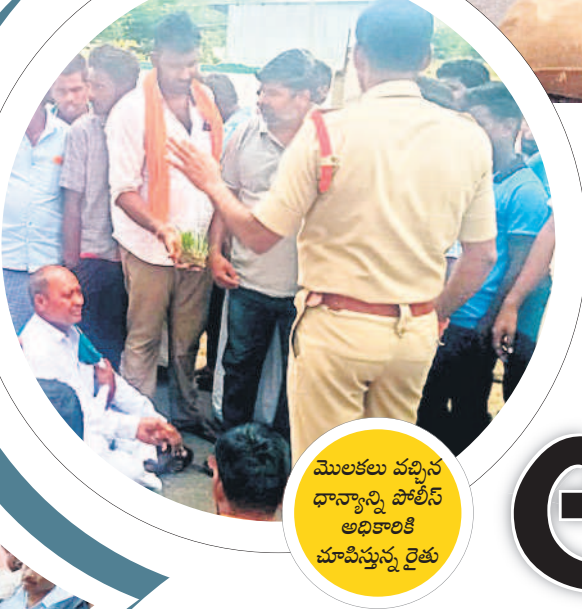
మొలకలు వచ్చిన ధాన్యాన్ని పోలీస్ అధికారికి చూపిస్తున్న రైతు