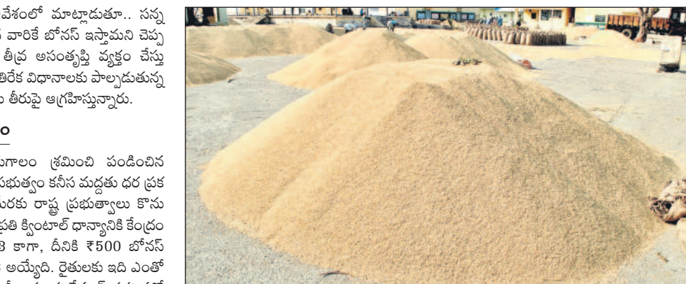
రైతులను దగా చేసింది

రైతుల్లో ఆగ్రహం రైతులు అరుగుల శ్రమించి పండించిన పంటకు కేంద్ర ప్రభుత్వం కనీస మద్దతు దగ్గర కు ఉండాలి. ఈ మేరకు రాష్ట్ర ప్రభుత్వం కొను గోలు చేయాలి. ప్రతి క్లింటాలో ధాన్యానికి కేంద్రం ఇచ్చేది ₹2,208 కాగా, దీనికి ₹500 బోనస్ తోపాటు ₹2,708 అయ్యింది. రైతులకు ఇది ఎంతో ఉపయోగపడుతుంది. కానీ, ఇప్పుడు రేపంకె ప్రకటనతో రైతులు తీవ్ర నిరాశకు లోనవుతున్నారు. ఈ సీజన్ లోనే బోనస్ వస్తుందని ఆశించినా ప్రయోజనం లేకపోయింది వాపోతున్నారు. ఇన్నాళ్లూ మద్దతు పెట్టిన ప్రభుత్వం, తీరా ఇప్పుడు సన్నవడ్లకే నంటూ ప్రకటించడం ఎంత వరకు కరెక్టు మండి పడుతున్నారో. కరీంనగర్ ఉమ్మడి జిల్లాలో ఎక్కడ మంచి డొడ్డు వడ్లనే పండిస్తారో, సన్నాలు పండించే వారిని వేళ్ల మీద లెక్కించవచ్చని చెబు తున్నారు. కేవలం సన్నాలు పండించే వారికి మాత్రమే బోనస్ వచ్చి తమ పరిస్థితి ఎంతటి? ఇలాంటి హామీలు ఇచ్చి ఎందుకు మోసం చేస్తు న్నారని ప్రశ్నిస్తున్నారు. కాంగ్రెస్ ప్రభుత్వానికి రైతులపై చిత్తశుద్ధి లేదని, ఇప్పటి వరకు ఏ ఒక్క హామీ నెరవేర్చలేదని ఆగ్రహిస్తున్నారు. రైతును రాజును చేయాలనే లక్ష్యంతో పనిచేసిన కేసీఆర్ ప్రభుత్వానికి, ప్రస్తుత కాంగ్రెస్ ప్రభుత్వానికి ఎంతో తేడా కనిపిస్తున్నదని చెబుతున్నారు.