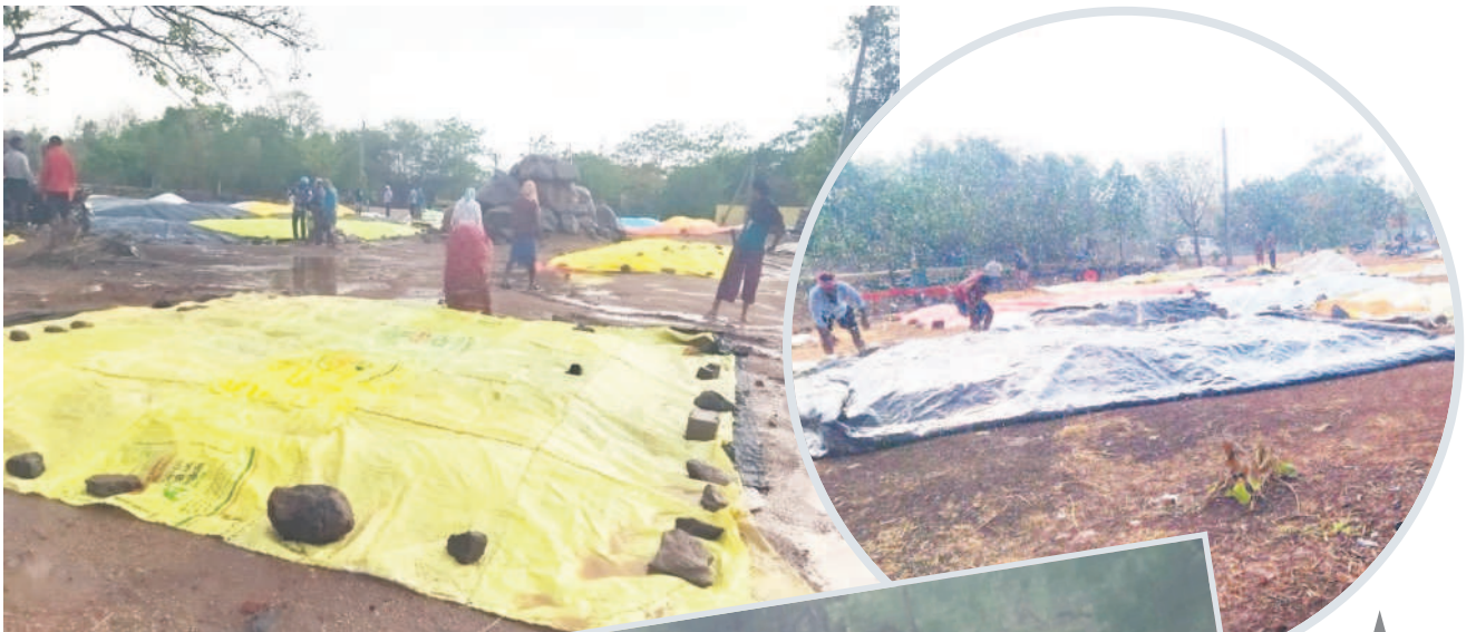
కడం : ధాన్యం వర్షపు నీరు నిలువగా కాలువలు తీసున్నాయి.