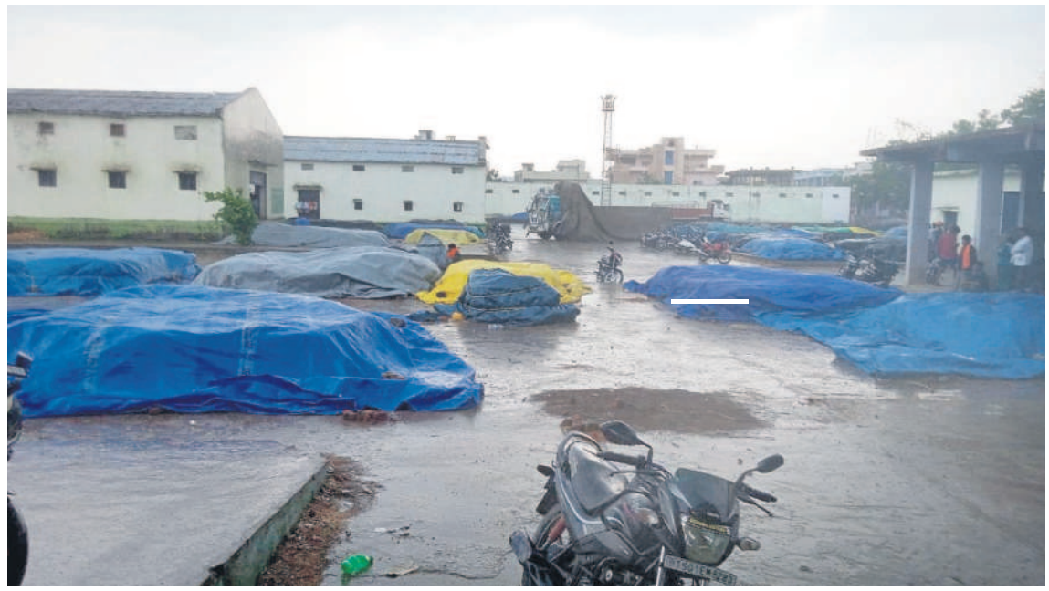
బోధ్ : మండల కేంద్రంలోని మార్కెట్ యార్డులో వర్షం కురుస్తుండగా జొన్న సంచలపై తడవకుండా టార్నాల్స్ కప్పిన రైతులు