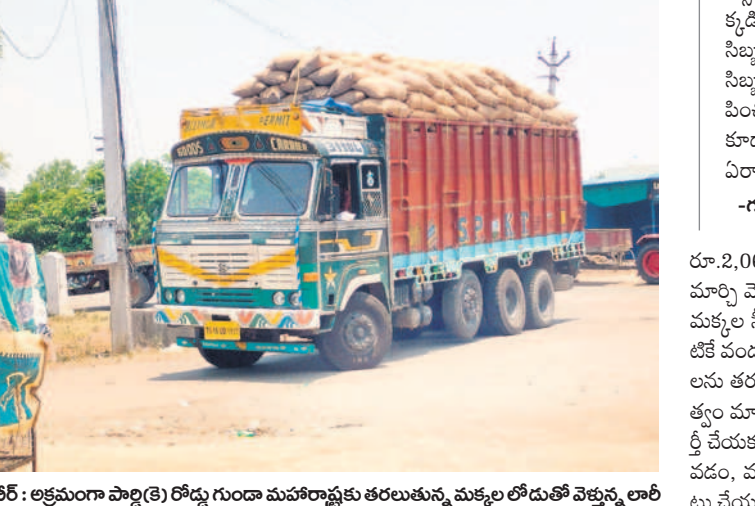
కుభేర్ : అక్రమంగా పార్కెట్ రోడ్డు గుండా మహారాష్ట్రకు తరలుతున్న మక్కల లోడుతో వెళ్తున్న లారీ

కుభేర్, మే 15 : నిర్మల్ జిల్లా కుభేర్ మార్కెట్ పరిధిలోని పార్కెట్, పట్టి, చాత, పార్కెట్, మాటాపా, సానా, సిగ్నల్ పాటు చాలా గ్రామాల నుంచి వీధి వ్యాపారులు మక్కలను మహారాష్ట్రకు తరలిస్తున్నారు. అయిప్పటికీ మార్కెట్లో శాఖ అధికారులు చూసి చూడన