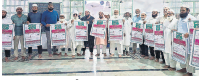
జల్సా పోస్టర్లను అభివృద్ధిస్తున్న ముస్లిం పెద్దలు

మిర్యాలగూడ, మే 15 : ఈనెల 19న మిర్యాలగూడలోని ఉస్మానియా మజిలీలో మౌలానా అబ్దుల్ రెహమాన్ అధ్వర్యంలో అజీమీన్ షాన్ జల్సా నిర్వహిస్తున్నట్లు మిర్యాలగూడ ముస్లిం పెద్దలు హాఫీజ్ డి.ఎ.ఎ. అధ్వర్యంలో అభివృద్ధి చేయాలని కోరారు. కాల్వల అభివృద్ధి చేయాలని కోరారు. కాల్వల అభివృద్ధి చేయాలని కోరారు. కాల్వల అభివృద్ధి చేయాలని కోరారు.