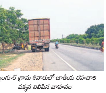
కట్టంగూర్ గ్రామ శివారులో జాతీయ రహదారి పక్కనే నిలిపిన వాహనం

కట్టంగూర్, మే 15 : నిత్యం రోడ్డు గాంధీ హైదరాబాద్-విజయవాడ రహదారి పక్కనే వాహనాలను నిలిపి వేస్తున్నారు. దాంతో ఇతర వాహనాలకు రాకపోకలకు ఇబ్బందులు కలగడంతో పాటు ప్రమాదాలు చోటు చేసుకుంటున్నాయి. మండలంలోని అయిదు ములు సుని పాముగుండ్ల వరకు దాఖలు, చిన్నపాటి హోటళ్లు ఉండడంతో వాహనదారులు రహదారిపై గంటల తరబడి నిలువడంతో ట్రాఫిక్ సమస్యలు తలెత్తి ప్రమాదాలు జరుగుతున్నాయి. దాంతో ఎప్పుడు ఏ ప్రమాదం జరుగుతుందో నని వాహనదారులు భయాందోళన చెందుతున్నారు. రోడ్డు పక్కనే వాహనాల నిలిపివేయడం పట్ల ఇటీవల ప్రమాదాలు జరిగి