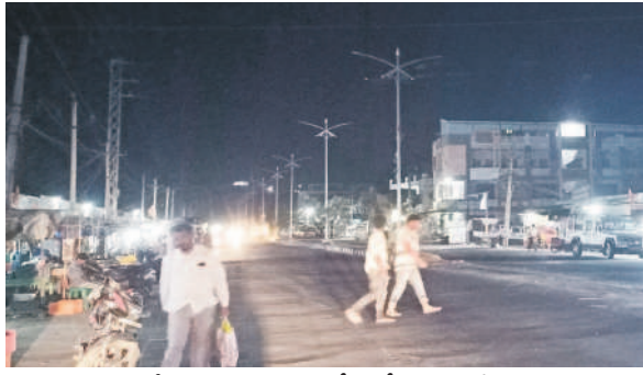
కొండమల్లేపల్లి : హైదరాబాద్ రోడ్డులో వెలుగని వీధి దీపాలు