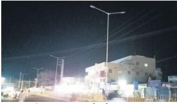
కొండమల్లేపల్లి: నాగార్జునసాగర్ రోడ్డులో వెలుగని హైవేపై లైట్లు

కొండమల్లేపల్లి, మే 15: కొండమల్లేపల్లి పట్టణంలో హైదరాబాద్-నాగార్జున సాగర్ ప్రధాన రహదారిపై వీధి దీపాలు వెలుగకపోవడంతో ప్రజలు, వాహనదారులు తీవ్ర ఇబ్బందులు పడుతున్నారు. గత ప్రభుత్వం లక్షల రూపాయలు వెచ్చించి ఏర్పాటు చేసిన వీధి దీపాలు ఏర్పాటు చేసినది, అధికారుల నిర్లక్ష్యం, నిర్లక్ష్యం లోపంతో ఎప్పుడు వరుసగా రెండు రోజులు వెలిగిన పాపం పోయింది. దాంతో నిత్యం ప్రమాదాలు చోటు చేసుకుంటున్నాయి. గత టీఆర్ఎస్ ప్రభుత్వం హైదరాబాద్ రోడ్డులో ఎమ్మెల్యే నిధులు రూ. 57 లక్షలతో అక్టోబర్ 4న హైవేపై లైట్లను ప్రారంభించారు. ఇవి గ్రామపంచాయతీ నిర్వహణలో జరుగుతుండగా ప్రత్యేక విద్యుత్ ట్రాన్స్ఫార్మర్ల ఏర్పాటు చేయకపోవడంతో ఒక్క రోజు లైట్లు వెలిగితే మళ్లీ పడి, పదిహేను రోజుల వరకు వెలుగడం లేదని స్థానికులు ఆరోపిస్తున్నారు.