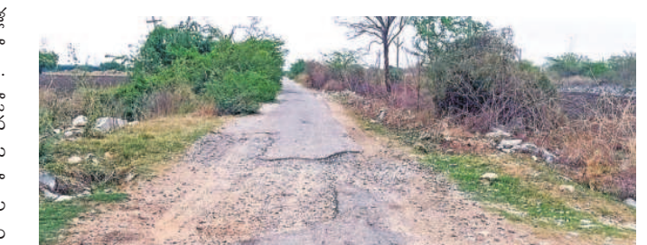
గుంతల మయంగా మారిన తాళ్లవీరప్పగూడెం - ఇర్రిగూడెం రహదారి

దామరచర్ల, మే 15: మండలంలోని తాళ్ల వీరప్పగూడెం నుంచి ఇర్రిగూడెం వెళ్లే రహదారి పూర్తిగా అధ్యానంగా మారింది. రోడ్డుంతా గుంతల మయంగా మారి చుట్టూ కంపెయిట్ పెరగడంతో ప్రయాణికులు ఆస్థలు పడుతున్నారు. ఆసలే గుంతలు అందులో కంపెయిట్ పెరుగడంతో ఎదురుగా వచ్చే వాహనాలు కనిపించక ప్రమాదాల బారిన పడుతున్నారు. తాళ్లవీరప్పగూడెం నుంచి ఇర్రిగూడెం వెళ్లే రహదారి సుమారు 4 కిలోమీటర్లు ఇదే పరిస్థితి నెలకొంది. ఈ రోడ్డు గుండా రైతులతో పాటుగా రెండు గ్రామాల ప్రజలు నిత్యం ప్రయాణిస్తుంటారు. దామరచర్ల చేరుకోవాలంటే ఇదే దగ్గర రహదారి కావడంతో నిత్యం కచ్చిగా ఉంటుంది. రాసున్నది వాసకాలం కావడంతో వర్షాలు పడి రోడ్డు గుంతల్లో నీరు నిల్వడంతో ప్రమాదాలు