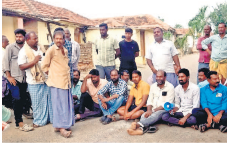
వడ్ల ఎందుకు కొనడం లేదని ఆగ్రహిస్తూ మల్కపేటలో ధర్మా చేస్తున్న రైతులు