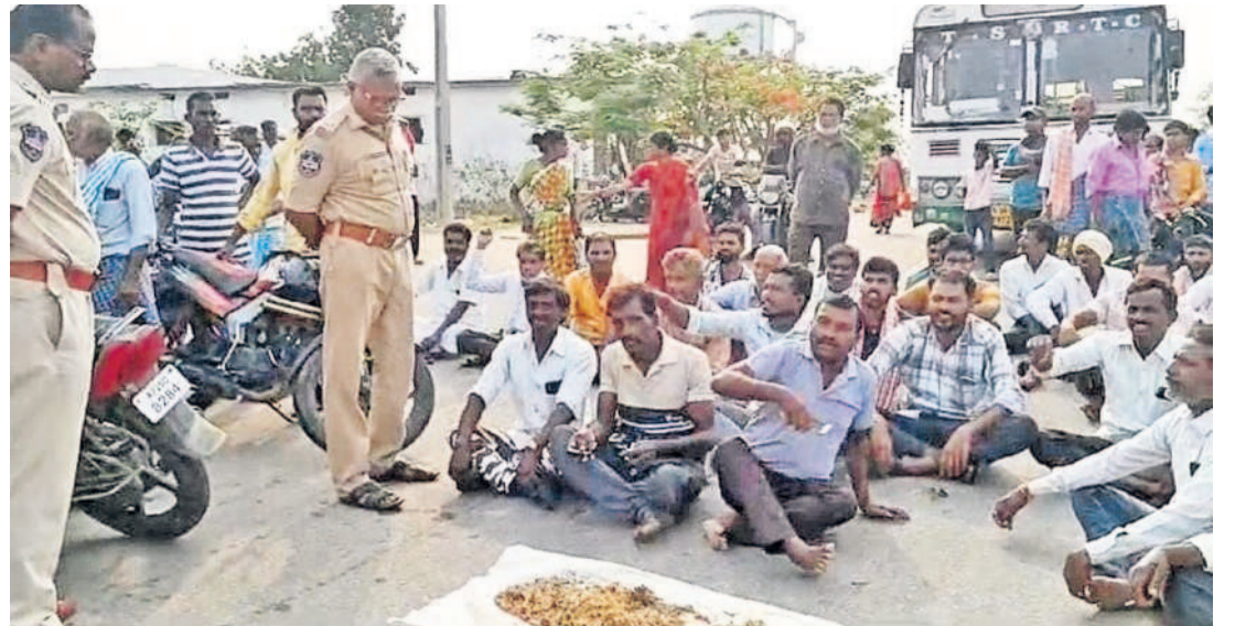
మీరే చూడాలి సారూ.. ఇంత అన్యాయమా? | మెదక్ జిల్లా డి ధర్నారం గ్రామంలో మొలకెత్తిన ధాన్యంతో రాస్ట్రోకోక్ చేస్తున్న రైతులు