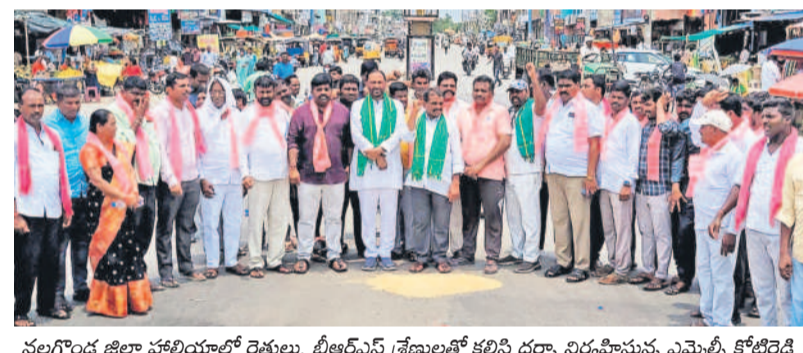
నల్లగొండ జిల్లా హాలియాలో రైతులు, బీఆర్ఎస్ శ్రేణులతో కలిసి ధర్నా నిర్వహిస్తున్న ఎమ్మెల్యే కోటిరెడ్డి