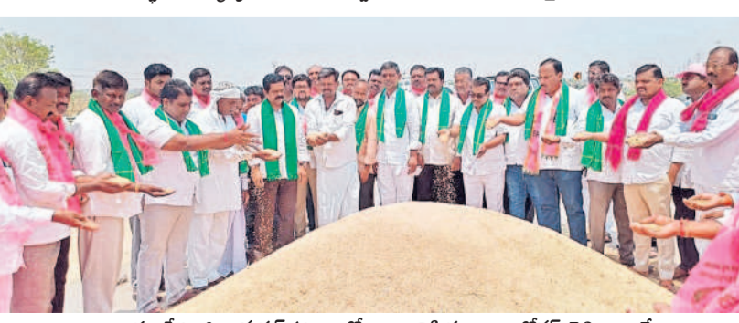
నారాయణపేట జిల్లా ముక్తల్ పట్టణంలో ధాన్యానికి రూ.500 బోనర్స్ చెల్లించాలనే నిరసనలో భాగంగా వడ్లకు పరిశీలిస్తున్న మాజీ ఎమ్మెల్యే చిట్టెం రామ్మోహన్ రెడ్డి