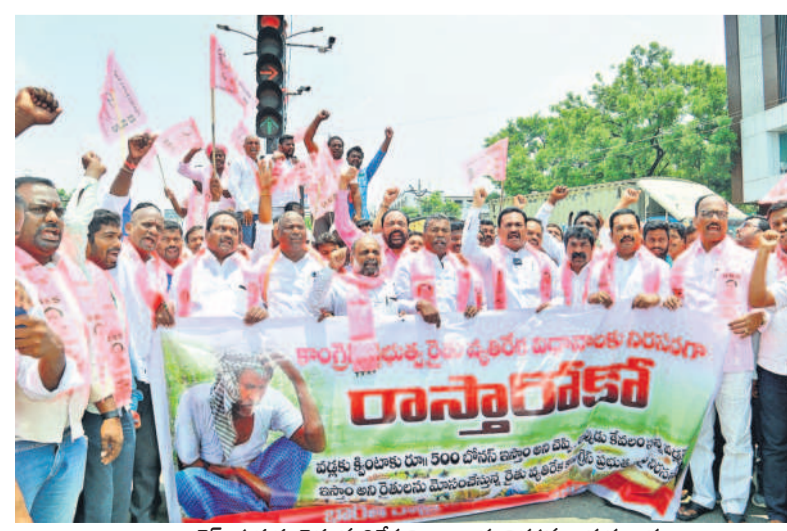
కాంగ్రెస్ ప్రభుత్వ రైతు వ్యతిరేక విధానాలకు నిరసనగా గురువారం కామారెడ్డిలో భారీ ప్రదర్శన చేపట్టి సినాదాలు చేస్తున్న రైతులు, బీఆర్ఎస్ శ్రేణులు