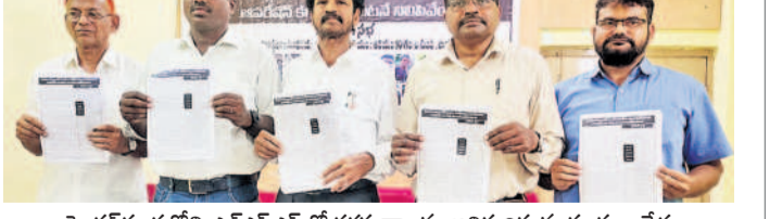
హైదరాబాద్ లోని ఎన్ఎస్ఎన్లో కరవిత్రాయణ ఆవిష్కర్తున్న సంఘం నేత