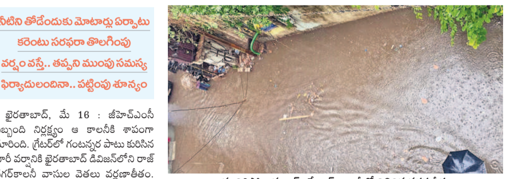
మునిగిపోయిన బాక్స్ డ్రైయిన్, కాలనీలో నిలిచిన వరద నీరు

నాలా పరిహారక ప్రాంతం కావడంతో ఇక్కడ ఎప్పుడూ వరద ముంపు ప్రమాదం పొంది ఉంటుంది. ఆ సమస్యను కొంత సులభంగా పరిష్కరించాలని మేయర్ గద్దూర్ విజయలక్ష్మి తీసుకువచ్చినా, అధికారుల దృష్టికి తీసుకువచ్చినా పట్టించుకోవడంలేదని స్థానికులు ఆరోపిస్తున్నారు.