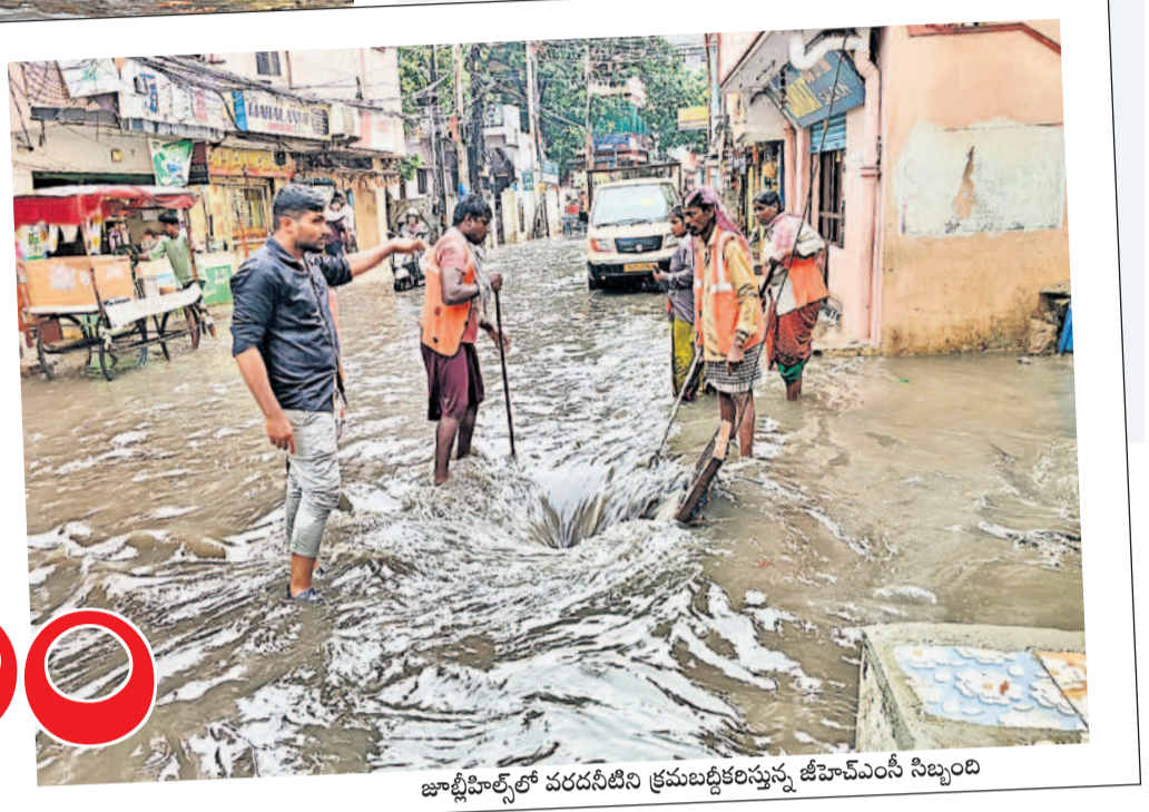
జూబ్లీహిల్స్ లో వరదనీటిని క్రమబద్ధీకరిస్తున్న జీహెచ్ఎస్ సిబ్బంది