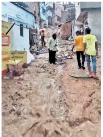
ఫిలిం నగర్ లోని బండారు బాల్ రెడ్డినగర్ బస్ స్టాప్ వరదనీటి కారణంగా కొట్టుకు పోయిన రోడ్డు

తరలిపోయిన సహాయక చర్యలకు చెప్పవచ్చు. మ్యూన్సిపల్ కార్పొరేషన్ పేరుకు పోయిన పంట పంటలు ముంపు పొందాయి.