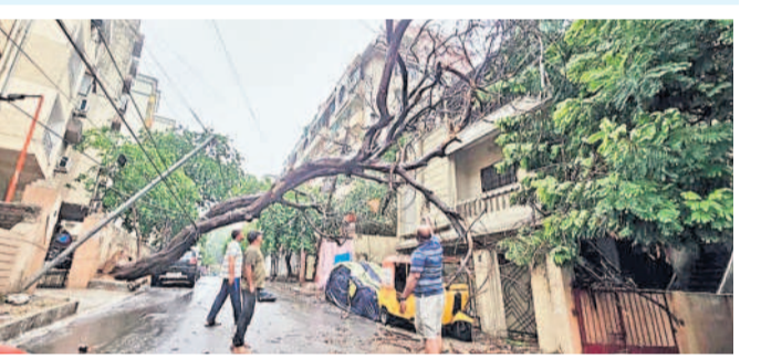
హిమాయత్ నగర్ లో రోడ్డుకు అడ్డుగా కూలిన చెట్టు

నిటమూనిగిన కాలనీలు.. ఇండ్రలోకి చేరిన వరదనీరు తీవ్ర ఇబ్బందులు ఎదుర్కొన్న వాహనదారులు, కాలనీల వాసులు అతలాకుతలం బంజారాహిల్స్ లో 8.3 సెంటీమీటర్లు ఉదయనగర్ లో వరదనీటిలో కొట్టుకుపోయిన వాహనాలు