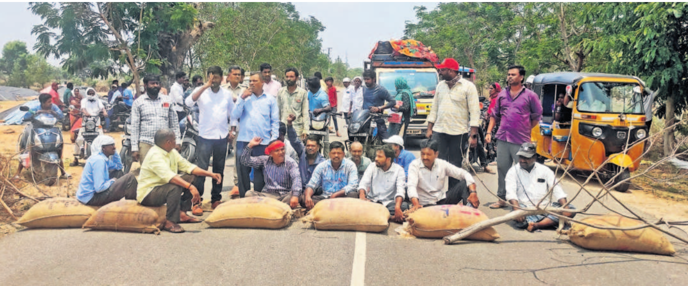
కాంగ్రెస్ సర్కారుపై కర్షకుల కనెర్ర | రాజస్థాన్ నిలిపివేత జిల్లా కోనరావుపేటలో దొడ్డు వడ్లకూ బోనర్స్ చెల్లించాలని ధమాకాలో ఆధ్వర్యం వహించిన పెట్టి ధర్మా చేస్తున్న రైతులు