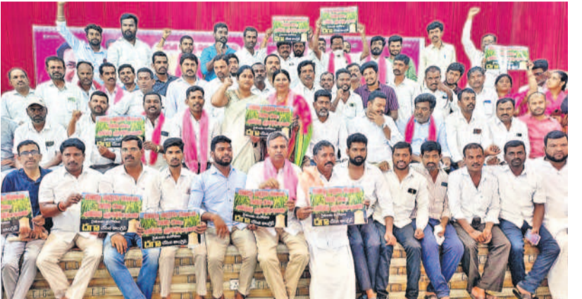
రైతులను దగాచేసిన కాంగ్రెస్ సర్కార్ | జనగామ జిల్లా కేంద్రంలో రైతులు, బీఆర్ఎస్ నాయకులతో కలిసి ధర్మా నిర్వహిస్తున్న ఎమ్మెల్యే పల్లూ రాజేశ్వరరెడ్డి