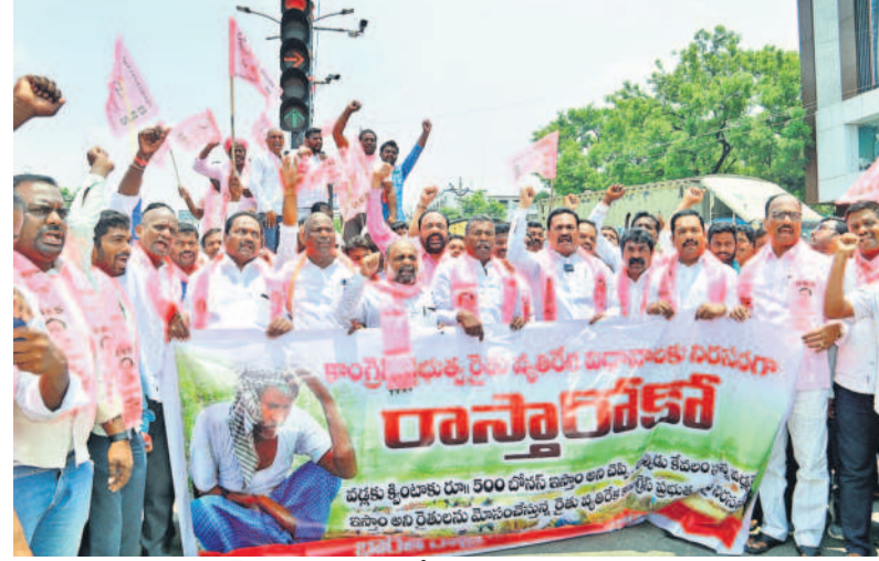
కాంగ్రెస్ ప్రభుత్వ రైతు వ్యతిరేక విధానాలకు నిరసనగా గురువారం కామారెడ్డిలో భారీ ప్రదర్శన చేపట్టి నినాదాలు చేస్తున్న రైతులు, బీఆర్ఎస్ శ్రేణులు

ఉమ్మడి మెదక్ జిల్లాలోని నియోజకవర్గ కేంద్రాల్లో బీఆర్ఎస్ ఆధ్వర్యంలో ఆందోళనలు చేపట్టారు. ఆందోల్ మాజీ ఎమ్మెల్యే క్రాంతిరేఖ ఆధ్వర్యంలో జోగిపేటలోని హనుమాన్ చౌరస్తాలో బీఆర్ఎస్ శ్రేణులు, రైతులతో కలిసి ధర్మా నిర్వహించారు.