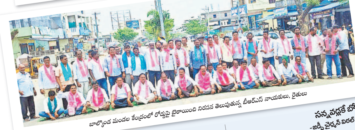
బాలాకొండ మండల కేంద్రంలో రోడ్డుపై బైతాయింది నిరసన తెలుపుతున్న బీఆర్ఎస్ నాయకులు, రైతులు