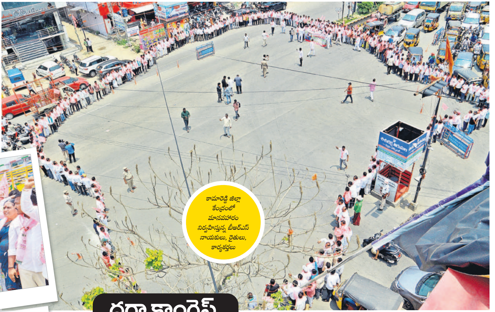
కామారెడ్డి జిల్లా కేంద్రంలో మానవజాతి నిర్వహిస్తున్న బీఆర్ఎస్ నాయకులు, రైతులు, కార్యకర్తలు