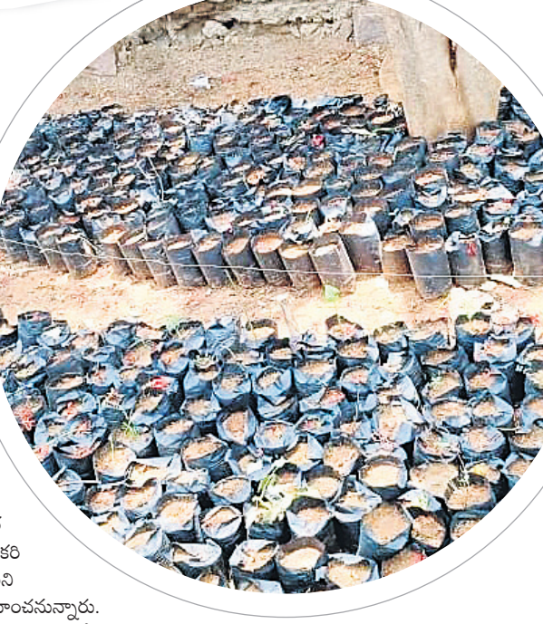
వట్టిచుకోవడంలో భాగంగా దర్జానుమిస్తున్న బ్యాగులు

కామారెడ్డి, మే 16: రాష్ట్రంలో హరితపథకం తీర్చిదిద్దాలనే ఉద్దేశంతో బీఆర్ఎస్ హయాంలో తెలంగాణ తొలి ముఖ్యమంత్రి కేసీఆర్ హరితపథకం కార్యక్రమాన్ని ప్రారంభించారు. ప్రతిష్ఠాత్మకంగా చేపట్టిన హరితపథకంలో భాగంగా రోడ్లకు ఇరువైపులా, ప్రభుత్వ ఫాటీ స్టోలాలు, కార్యాలయాలు తదితర ప్రాంతాల్లో మొక్కలు నాటారు. ప్రతి సంవత్సరం జూన్ నెలలో తొలకరి వర్షాలు కురవగానే మొక్కలు నాటాలనే ఉద్దేశంతో గ్రామానికో నర్సరీని ఏర్పాటు చేశారు. మరో 20రోజుల్లో హరితపథకం కార్యక్రమం నిర్వహించనున్నారు. అందులో భాగంగా కామారెడ్డి జిల్లా సదాశివనగర్ మండలంలోని పలు గ్రామాల్లోని నర్సరీల్లో ముందస్తు ప్రణాళికతో మట్టిని తీసుకొచ్చి బ్యాగ్ ఫిల్లింగ్ చేసి విత్తనాలు చేశారు. వేసవి, నర్సరీల నిర్వహణపై అధికారుల పర్యవేక్షణ కరువు విత్తనాలు మొలకెత్తలేదు. మొక్కల సంరక్షణకు తగిన చర్యలు తీసుకోలేదనే ఆరోపణలు వినిపిస్తున్నాయి. పలు గ్రామాల్లో అంతంత మాత్రంగానే విత్తనాలు మొలకెత్తాయని, మిగతా జాగ్రత్త చర్యలు పాటించకపోవడంతో వచ్చిన మొలకలు సైతం ఎండిపోయాయి. అవేన్నూ ప్లాంటింగ్ లో మొక్కలు నాటాలంటే రెండు మీటర్ల పొడవు, అటవీ ప్రాంతాల్లో నాటాల్సిన మొక్కలు రెండు, మూడు ఫీట్ల పత్త ఉండాలని అధికారులు చెబుతున్నారు. ఇప్పటికిప్పుడు కొత్తగా విత్తనాలు వేసినా అవి మొక్కలుగా మారేందుకు రెండు, మూడు నెలల సమయం పడుతుందని పలువురు పిల్లంటున్నారు. జూన్ చివరి వారం లేదా జూలై మొదటి వారంలో నిర్వహించే హరితపథకం కార్యక్రమంపై నీలినీడలు కమ్ముకున్నాయి.