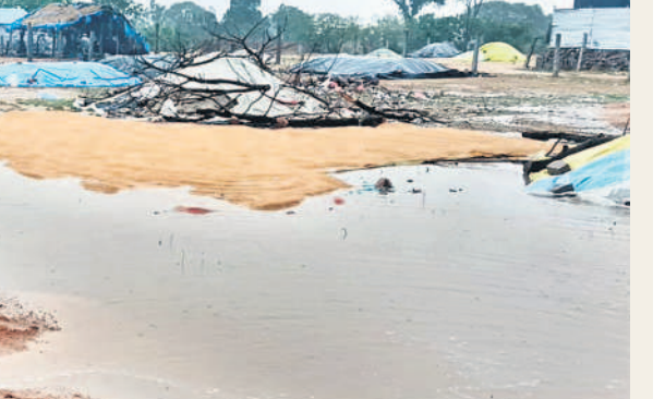
భీకరూరు మండలం పెద్దమల్లారెడ్డి గ్రామంలో గురువారం ఆకాలవర్షానికి తడిసిన ధాన్యం

ఆర్కూర్ లోని, మే 16 : ఆర్కూర్ లోని జీవన్ రెడ్డి షాపింగ్ మార్లను ఆర్టీసీ అధికారులు గేసు వారం సీజ్ చేశారు. గడుపులోపు బకాయిలు చెల్లించని కారణంగా మార్లను స్వాధీనం చేసు కుంటున్నట్లు ప్రకటించారు. ఈ మేరకు ప్రధాన గేట్లకు తాళం వేశారు. వారం క్రితం జీవన్ రెడ్డి మార్లకు వచ్చిన ఆర్టీసీ అధికారులు.. మార్లను సీజ్ చేస్తామని మైక్ ద్వారా ప్రకటించారు. తాజాగా మళ్లీ గురువారం ఉదయం మార్లకు వచ్చిన అధికారులు సాయంత్రంలోపు ఖాళీ చేయాలని దుకాణదారులకు సూచించారు. వారు చెప్పినట్లుగానే సాయంత్రం వచ్చి నకాలలో ఆర్డీ చెల్లించని కారణంగా మార్లను స్వాధీనం చేసుకుంటున్నట్లు షేక్సీ ఏర్పాటు చేసి, ప్రధాన గేట్లకు తాళం వేశారు.