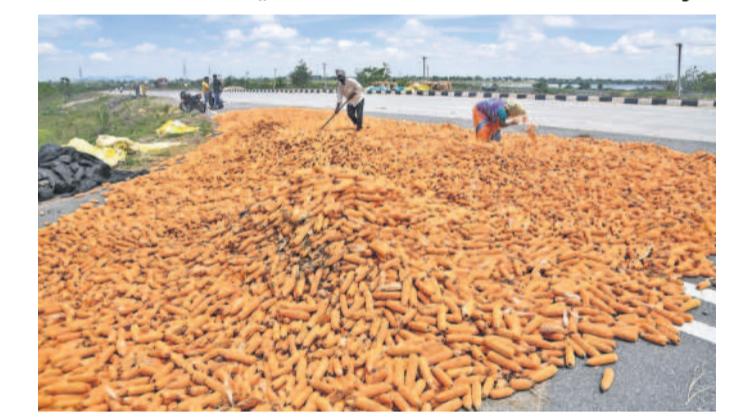
హనుమకొండ జిల్లా హనువపల్లి మండలం రెడ్డిపురం లింగ్ రోడ్డుపై శుక్రవారం తడిసిన వత్సజొన్నను ఆరబోస్తున్న రైతులు