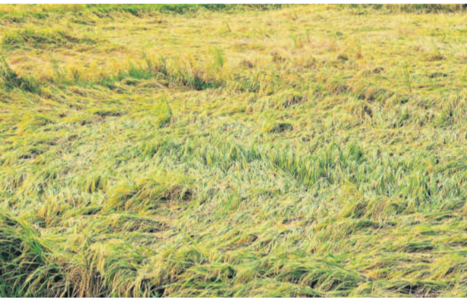
జయశంకర్ భూపాలపల్లి మున్సిపాలిటీ పరిధిలోని కాళీపల్లిలో తోటదారులు అలతో శుక్రవారం కురిసిన వర్షానికి నేలవాలిన వరిపైరు