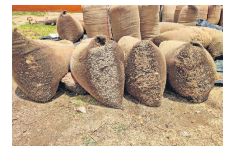
మహబూబాబాద్ జిల్లా నర్సింపాలపేట మండలం ముంగిమదుగు ధాన్యం కొనుగోలు కేంద్రంలో కాంటా అయినప్పటికీ సకాలంలో లోడ్ ఎత్తక మొలకెత్తిన బస్సాల్లోని ధాన్యం