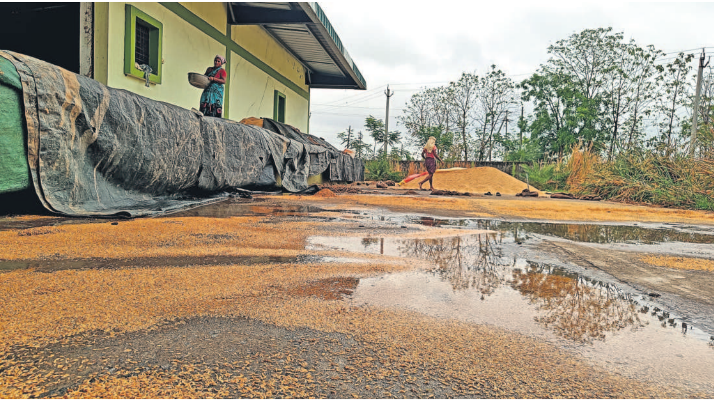
వరదపాలిన వడ్డు మంచిర్యాల జిల్లా కోటపల్లి మండలకేంద్రంలోని పీపీసీఎస్ కొనుగోలు కేంద్రంలో భారీ వర్షానికి కొట్టుకుపోయిన వడ్డు