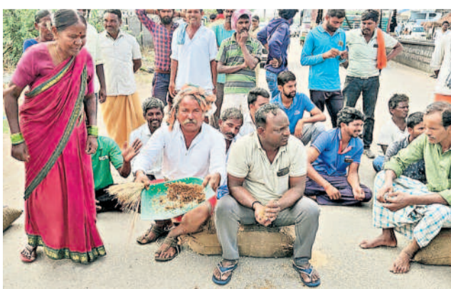
మెడక్ జిల్లా రామాయంపేటలో మొలకెత్తిన ధాన్యాన్ని చూపిస్తున్న రైతులు

నమస్తే తెలంగాణ, న్యూస్ నెట్ వర్క్, మే 17: రైతులు ఆరుగంటల కష్టంపడి పండించిన ధాన్యాన్ని అమ్ముకునేందుకు కొనుగోలు కేంద్రాలకు తీసుకొస్తే.. 47 రోజులు కావేస్తున్నా ప్రభుత్వం కొనడం లేదని అన్నదాతల ముందేమీ చేపట్టారు. యాదాద్రి భువనగిరి జిల్లా అత్యుత్సాహి(ఎం)లోని సబ్ మార్కెట్ యార్డు ప్రధాన గేటుకు తాళం వేసి నిరసన తెలిపారు. అనంతరం మోత్యూర్-భువనగిరి ప్రధాన