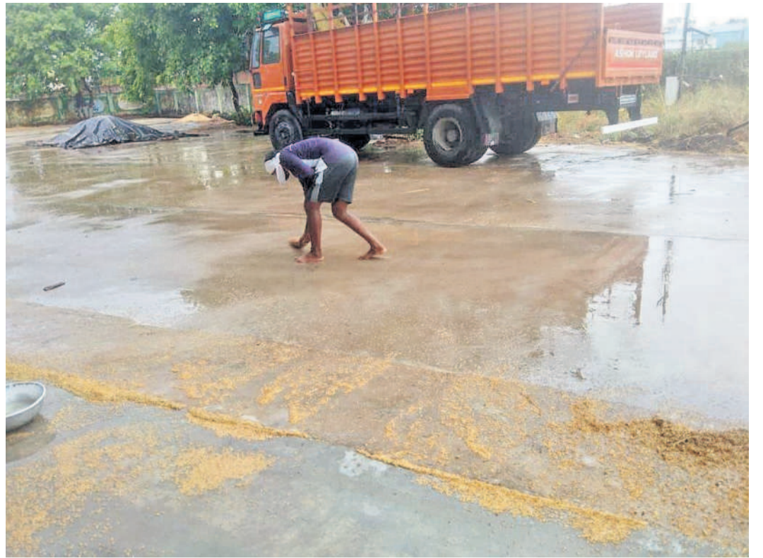
చివరికి మిగిలింది.. పెద్దపల్లి జిల్లా మంథనిలో వరదనీటిలో కొట్టుకుపోయిన దాన్యాన్ని ఎత్తుతున్న రైతు