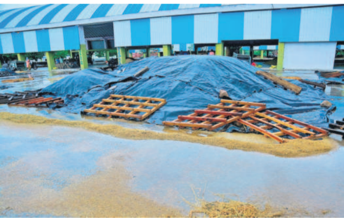
సిద్దిపేట మార్కెట్ యార్డులో శుక్రవారం కురిసిన భారీ వర్షానికి ధాన్యం రాశులను ముంచెత్తిన వరదనీరు