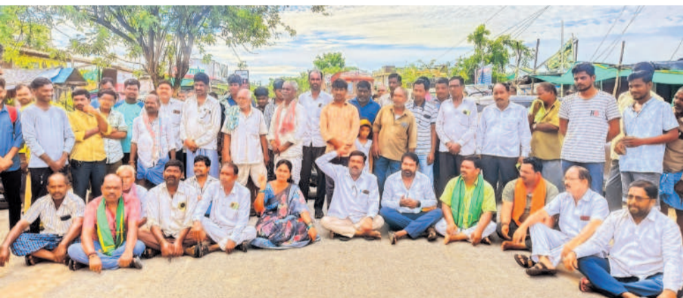
యాదాద్రి భువనగిరి జిల్లా అత్యుత్సాహి (ఎం)లోని మార్కెట్ యార్డుకు తాళం వేసి ప్రధాన రోడ్డుపై రాస్తారోకో చేస్తున్న రైతులు