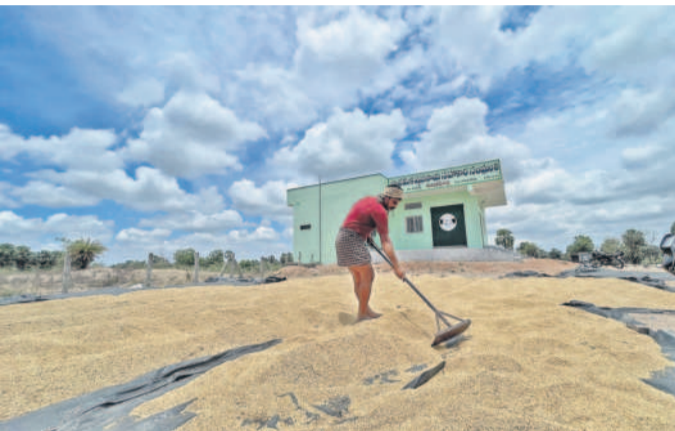
హనుమకొండ జిల్లా హనువపల్లి మండలం సిద్దాపురం, మత్తారెడ్డిపల్లి ప్రాథమిక వ్యవసాయ సహకార సంఘం వడ్డు తడిసిన వడ్డును ఆరబోస్తున్న రైతులు, అటు కమ్మతున్న మేఘాలు