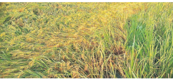
పెద్దపల్లి జిల్లా మంథని మండలం వెంకటాపూర్ నేలకొరిగిన వరి పంట

నమస్తే తెలంగాణ నెట్ వర్క్: రాష్ట్రవ్యాప్తంగా పలు జిల్లాల్లో కురిసిన అకాల వర్షం రైతులను అతలాకుతలం చేసింది. కొనుగోలు కేంద్రాల్లో ఆరబోసిన వడ్డు భారీ వర్షంతో మళ్లీ తడిసిముద్దయ్యాయి. పలుచోట్ల వడ్డు గింజలు వరదలో కొట్టుకుపోయాయి. శుక్రవారం ఉమ్మడి వరంగల్, కరీంనగర్, మెదక్, ఆదిలాబాద్ జిల్లాల్లో పలుచోట్ల ఈమధ్యగాలులతో భారీ వర్షాలు కురిశాయి. ఉమ్మడి వరంగల్ జిల్లావ్యాప్తంగా గురువారం రాత్రి నుంచి ఆర్ష రాత్రి వరకు భారీ వర్షం కురిసింది. జనజీ వనం స్తంభించిపోయింది. వారులు, వంకలు ఉప్పొంగడంతో పలు గ్రామాలకు రాకపోకలు నిలిచిపోయాయి. వడ్డు తడిసిముద్దయ్యాయి. మహబూబాబాద్ జిల్లా నర్సింపాలపేట మండలం, మహబూబాబాద్ మండలం గాంధీ పురం, ముడుపుగల్ కొనుగోలు కేంద్రాల్లో ధాన్యం తడిసి మొలకెత్తింది. గార్ల మండలం రాంపూర్ చెక్ డ్యాం నుంచి వరద పొంగిపూర్ గడంతో మండలంలోని 15 గ్రామాలకు రాక పోకలు నిలిచిపోయాయి. బయ్యారం మండలంలో పందిపంపుల, మసీదా గుట్టతంగా ప్రవహిస్తున్నాయి. జంగాలపల్లి క్రాస్ రోడ్డులో జంగాలపల్లి, ఇంచర్లకు చెందిన 30 మంది రైతుల మూడువేల క్వింటాళ్ల ధాన్యం తడిసి ముద్దయింది. గోవిందరావుపేట, వెంకటాపూర్, మంగపేట, ఏటూరుగారం, ములుగు, వాజేపేట, వెంకటాపూరం (నూగూరు), కన్యామూడెం మండలాల్లో ధాన్యం తడిసి పోయింది. జయశంకర్ భూపాలపల్లి జిల్లాలో కురిసిన భారీ వర్షానికి కొనుగోలు కేంద్రాల్లోని ధాన్యం నీళ్లపాలైంది. ఆరబోసిన వడ్డు తడిసి మొలకెత్తుతున్నాయి. హనుమకొండ జిల్లాలో వరి మండలాల్లో కురిసిన వర్షానికి రోడ్డుపై ఆరబోసిన మళ్లీసారి వడ్డు తడిసిముద్దయ్యాయి. వాటిని ఆరబెట్టుకునేందుకు రైతులు నానా తంటాలు పడుతున్నారు. కొనుగో