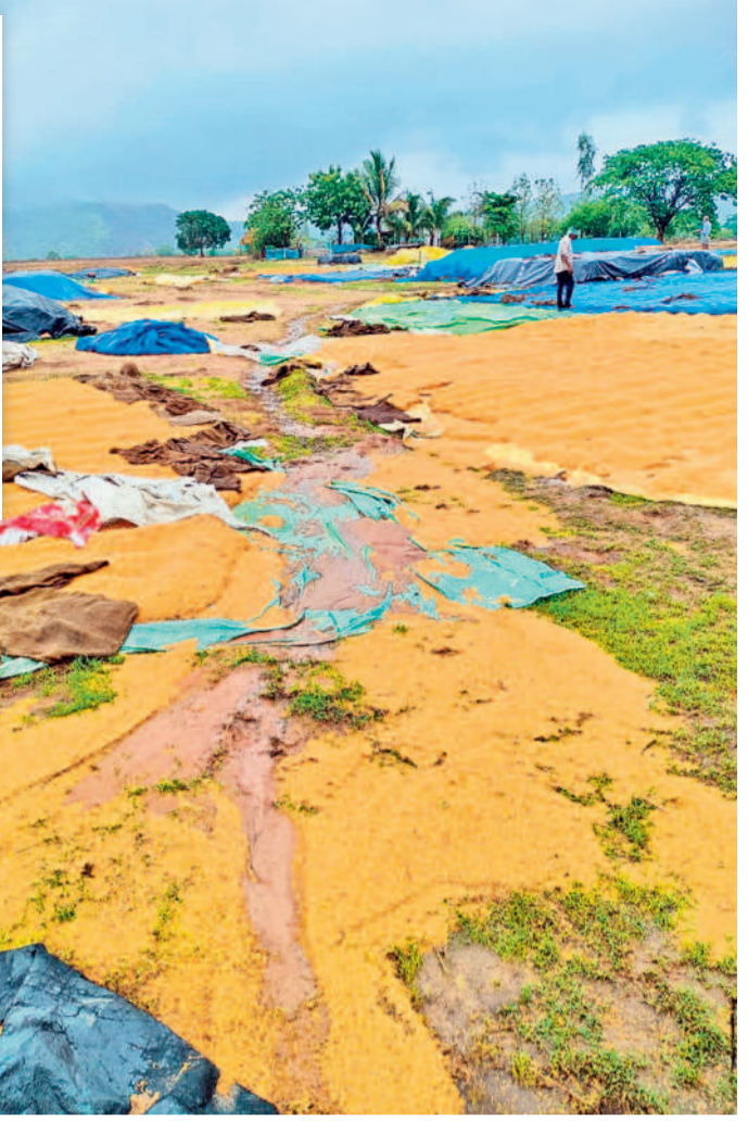
వెంకటాపూర్ మండలంలోని కొనుగోలు కేంద్రంలో కొట్టుకుపోయిన పద్దు