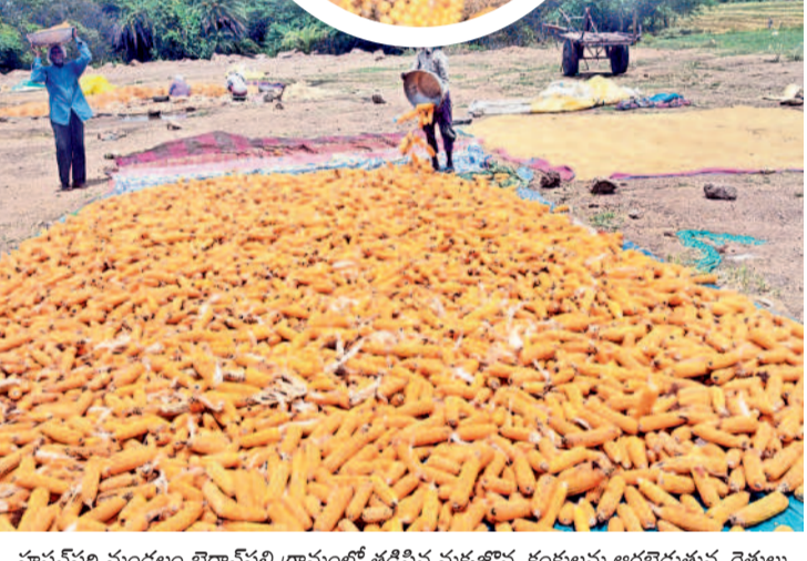
హనుమకొండ మండలం బైరానపల్లి గ్రామంలో తడిసిన మక్కజొన్న కంకులను అరబెడుతున్న రైతులు