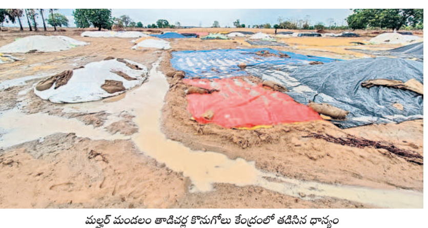
మల్లర్ మండలం తాడిపత్తర్ కొనుగోలు కేంద్రంలో తడిసిన ధాన్యం