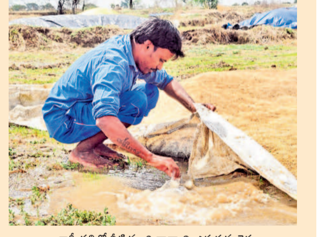
కాళిందల్లో నీటి నుంచి ధాన్యాన్ని ఎత్తుతున్న రైతు

జయశంకర్ భూపాలపల్లి, మే 17 (నమస్తే తెలంగాణ): యాసంగి వద్ద ఇప్పటి వరకు అధికారులు కేవలం 16,204 టన్నుల కొనుగోలు చేశారు. సుమారు లక్ష టన్నులు లక్షంగా పెట్టుకొని ఇప్పటి వరకు 116 కేంద్రాల ద్వారా 16,204 టన్నుల ధాన్యం కొనుగోలు చేశారు. ఇంకా 73 కేంద్రాలను ప్రారంభించలేదు. ఈ ధాన్యాన్ని కాటారం, కొయ్యూరు, గొల్లపేట, చిట్టాల, గణపూరికి చెందిన ఆరు మిల్లులతో పాటు వరంగల్ లోని మిల్లులకు సరఫరా చేశారు. ఇంకా కొనుగోలు కేంద్రాల్లో నాలుగు వేలకు పైగా టన్నుల ధాన్యం ఉండగా, ఇంకా వస్తోంది. మరో పదిహేను రోజుల్లో ధాన్యం మొత్తం కల్లాల్లో నుంచి లిఫ్ట్ చేయాలి ఉంది. వర్ష ప్రభావం పెరుగుతుందిని వాతావరణ శాఖ హెచ్చరిస్తున్నా ఎక్కడి ధాన్యం అక్కడే ఉంటోంది. జిల్లాలో ఇంకా 80 వేల టన్నుల ధాన్యాన్ని సేకరించాల్సి ఉంది. రెండు రోజుల శ్రీతం కురిసిన వరదలకు కల్లాల్లో ధాన్యం తడిసిపోగా గురువారం కురిసిన వర్షానికి కేంద్రాలు నీటిమయమయ్యాయి. శుక్రవారం వర్షం ఏకకలాపంగా కురుస్తూనే ఉంది. కేంద్రాల్లో రైతులు ధాన్యం కాపాడుకునేందుకు అవ్వని పడుతూనే ఉన్నారు.