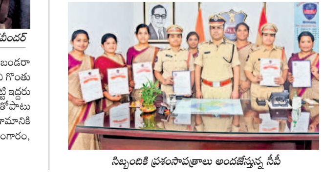
సిబ్బందికి ప్రశంసాపత్రాలు అందజేస్తున్న సీపీ