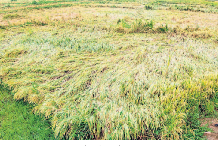
భూపాలపల్లిలోని కాళిందల్లో నేలకొరిగిన వరిపైరు