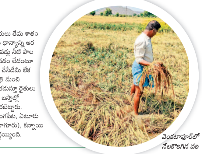
వెంకటాపూర్లో నేలకొరిగిన వరి

ములుగు, మే17(నమస్తే తెలంగాణ): అధికారులు తేమ శాతం పేరుతో పెట్టిన కొర్రలతో 20 రోజులుగా రైతులు ధాన్యాన్ని అరబోశారు. గురువారం రాత్రి నుంచి వర్షం కురిసి పద్దు నీటి పాలయ్యాయి. నిబంధనల ప్రకారం తేమ శాతం రావడం లేదంటూ కేంద్రాల నిర్వాహకులు వంకలు చెప్పగా రైతులు చేసేదేమీ లేక ధాన్యాన్ని అరబోయగా వరుణుడి పాల్గొంది. రాత్రి నుంచి ధాన్యం రాసులపై పరదాలు కప్పితూ వర్షానికి తడుస్తూ రైతులు కల్లాల వద్ద ఉండిపోతూ వర్షానికి ఏర్పడింది. బస్తాల్లో నింపిన ధాన్యం సైతం తడిసిపోవడంతో మళ్ళీ అరబెట్టారు. ములుగు, గోవిందరావుపేట, వెంకటాపూర్, మంగలూరు, ఏటూరు నాగారం, ములుగు, వాజేడు, వెంకటాపూర్(నూగూరు), కన్నాయి గూడెం మండలాల్లో రైతుల ధాన్యం తడిసి ముద్దయ్యింది.