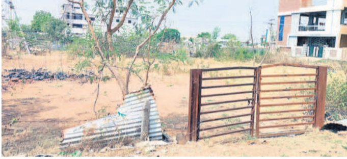
నీసిన నన్నూర్ : పట్టణ ప్రకృతివనంలో ఎండిపోయిన మొక్కలు

చెట్లంటే.. సమస్త జీవరాశికి 'ఆయువు పట్టు.. ఆక్రె, కార్బన్, వండ్రె ఆకలి తీర్చే కల్ప 'తరువు'.. కలకాలం చల్లని నీడే, తోడై, ప్రాణవాయువు కాపాడే వ్యక్తం.. వాతావరణ సమతౌల్యతను కాపాడే కాలుష్య నియంత్రక.. అలాంటి చెట్లను రక్షించేందుకు కేసీఆర్ సర్కారు 'హరితహారం' ఉద్యమంలా చేపట్టిగా, జాతీయంగా, అంతర్జాతీయంగా ప్రశంసలందుకున్నది. ప్రపంచంలోనే మూడో అతిపెద్ద కార్యక్రమంగా ఐక్యరాజ్యసమితి గుర్తించింది. అంతటి సత్కలితాలిచ్చిన కార్యక్రమం నేడు కాంగ్రెస్ సర్కారు నిర్లక్ష్యంతో ప్రమాదంలో పడింది. నాడు.. పచ్చగా కళకళలాడిన ఉద్యాన, పల్లె ప్రకృతి వనాలు, బృహత్ ప్రకృతి వనాలు, అర్బన్ పార్కులు, ఏకో పార్కులు, ఎవెన్యూ ఫ్లాంటేషన్లు నేడు.. ఆనవాళ్లు కోల్పోయి అధ్యానంగా మారాయి. మొక్కలు, చెట్లన్నీ ఎండిపోయి ఎదారులను తలపిస్తున్నాయి. కోట్లాది రూపాయల ప్రజాధనం వృధా అవుతున్నా పట్టణం మునుపటి నాథుడే కరువవ్వడంతో సర్వలా విమర్శలు వెల్లువెత్తుతున్నాయి.