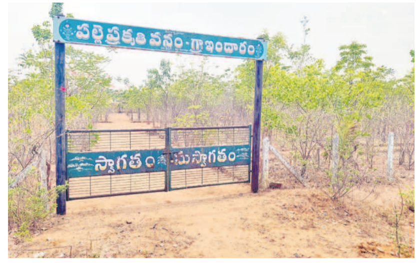
బైసూర్ : వెలవెల బోతున్న ఇందారం పల్లె ప్రకృతి వనం