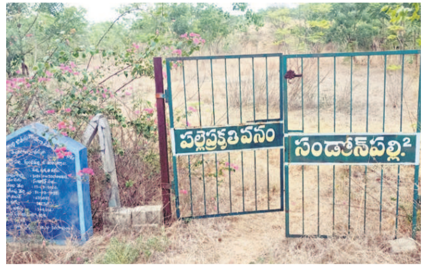
మందమలూరల్ : అధ్యానంగా సండాన్ పల్లి ప్రకృతి వనం