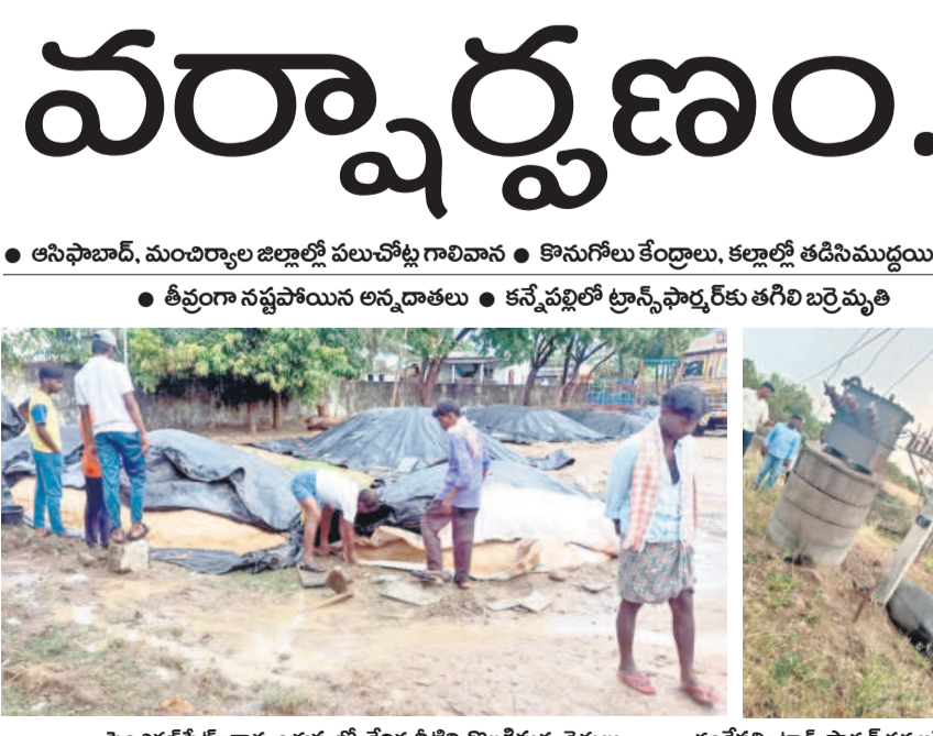
పెంజిరల్ పేట్ : ధాన్యం కుప్పల్లో చేరిన నీటిని తొలగిస్తున్న రైతులు

కారులు చూసేచూడనట్లు వ్యవహరిస్తున్నారు. ఒకప్పుడు పచ్చదనానికి ఎక్కువ ప్రాధాన్యమిచ్చిన పంచాయతీరాజ్, రూరల్ డెవలప్ మెంట్, మున్సిపాలిటీ, పార్లమెంట్ శాఖలు ఇప్పుడు అసలు అటువైపు కన్నెత్తి కూడా చూడడం లేదు. కొత్తవి పెట్టకపోగా.. ఉన్నవాటిని కూడా కాపాడుకునే ప్రయత్నం చేయకపోవడంపై విమర్శలు వెల్లువెత్తుతున్నాయి. మంచెర్యాల జిల్లాలో 2015 నుంచి 2023 వరకు టీఆర్ఎస్ సర్కారు హయాంలో 5.95 కోట్ల మొక్కలు నాటారు. ఇందులో గడిచిన ఏడాది 45 లక్షలు మొక్కలని లక్ష్యం నిశ్చయించుకోగా.. ఈ ఏడాది మొక్కలు నాటి లక్ష్యాన్ని 31.20 లక్షలకు తగ్గించారు. గడిచిన తొమ్మిదేళ్లలో ఇదే అతి తక్కువ టార్గెట్ కావడం గమనార్హం. టీఆర్ఎస్ హయాంలో హరితహారం కార్యక్రమానికి ఎక్కువ ప్రాధాన్యం ఉండేదని, మొక్కలు ఎండిపోడానికి అవకాశమే లేకుండా మానిటరింగ్ ఉండేది. కానీ ఇప్పుడు పరిస్థితి లేక ఎక్కడ చూసినా ఎండిపోయిన మొక్కలు, ఎదారిగా మారిన ప్రకృతి వనాలు దర్శనమిస్తున్నాయి.