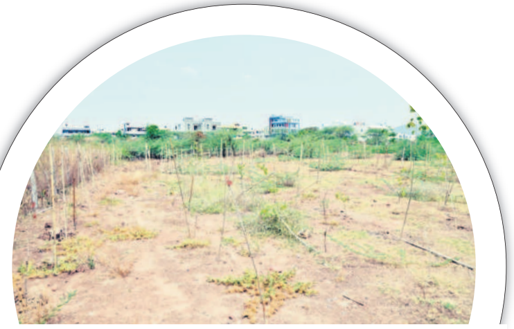
మంచెర్యాలటౌన్ : పట్టణంలోని ప్రకృతివనంలో ఎండిపోయిన మొక్కలు