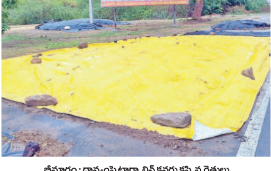
భీమారం : ధాన్యంపై టార్పాలిన్ కవర్ చేస్తున్న రైతులు