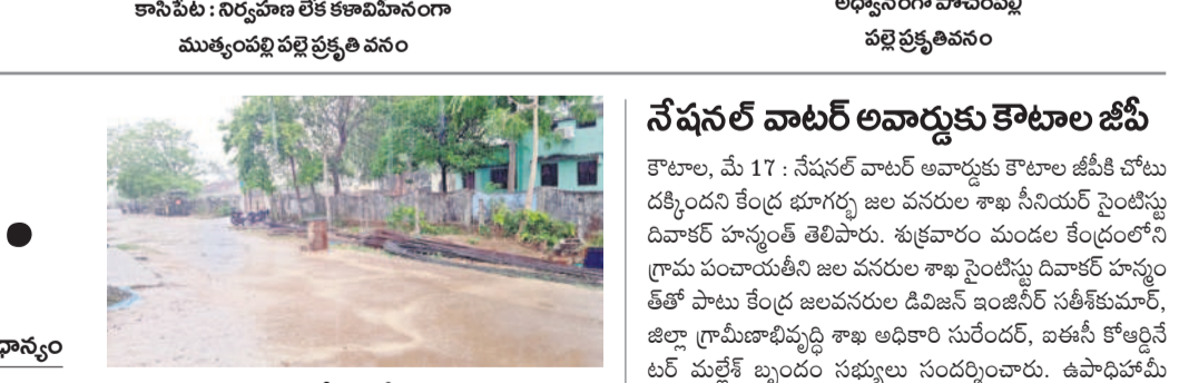
తాండూర్ : నిర్వహణ లేక అధ్యానంగా పోవంపల్లి పల్లె ప్రకృతి వనం