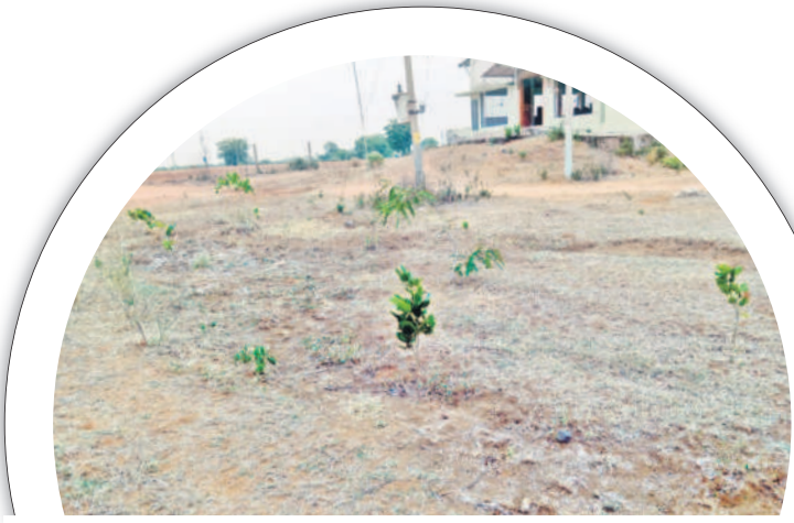
బెల్లంపల్లిరూరల్ : తాళ్ల గురిజాల రైతు వేదిక వద్ద ఎడగని హరితహారం మొక్కలు