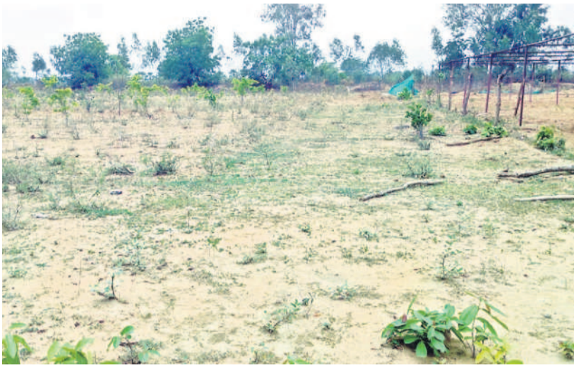
చెన్నూర్ : బృహత్ పట్టణ ప్రకృతి వనంలో ఎండి పోయిన మొక్కలు