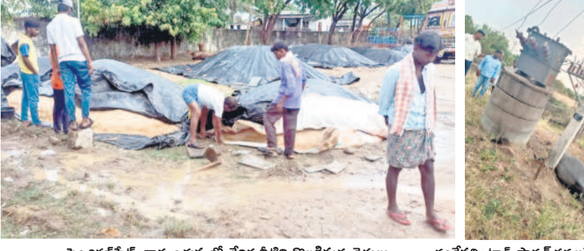
పెంజిరల్ పేట్ : ధాన్యం కుప్పల్లో చేరిన నీటిని తొలగిస్తున్న రైతులు