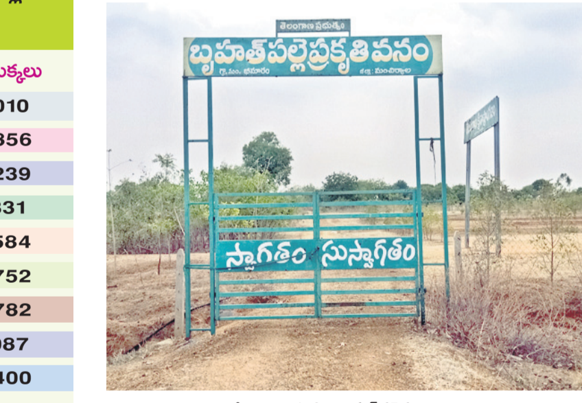
భీమారం : కళ తప్పిన బృహత్ పల్లె ప్రకృతి వనం