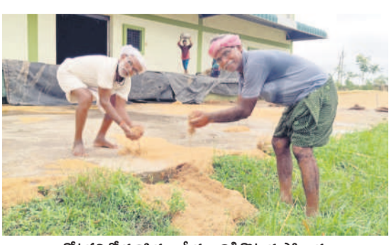
కోటపల్లిలో కురిసిన భారీ వర్షానికి కొట్టుకుపోయిన వరి ధాన్యాన్ని ఎత్తుతున్న రైతులు