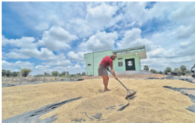
హనుమకొండ జిల్లా హనునపల్లి మండలం సిద్దాపురం, మత్తారెడ్డిపల్లి ప్రాథమిక వ్యవసాయ సహకార సంఘం వడ్డు తడిసిన వడ్డును ఆరబోస్తున్న రైతులు, అటు కమ్మతున్న మేఘాలు