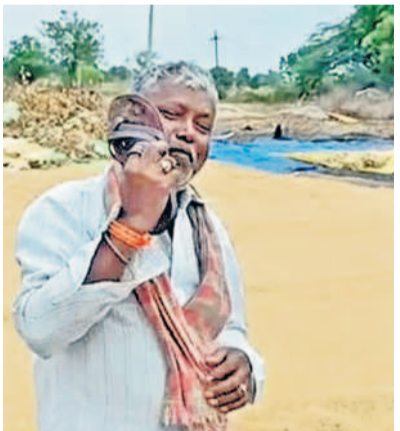
మళ్లీ వరి వేయని చెప్పతో కొట్టుకుంటున్న రైతు నిర్ణయ్య