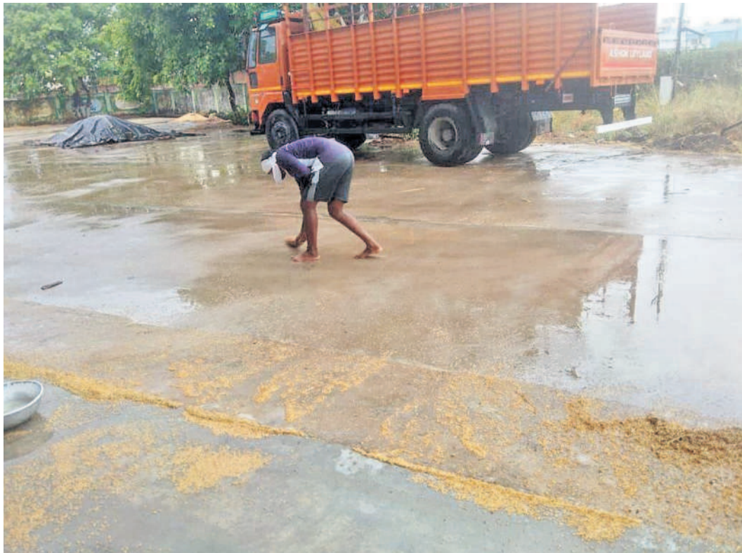
చివరికి మిగిలింది.. పెద్దపల్లి జిల్లా మంథనిలో వరదనీటిలో కొట్టుకుపోయిన దాన్యాన్ని ఎత్తుతున్న రైతు