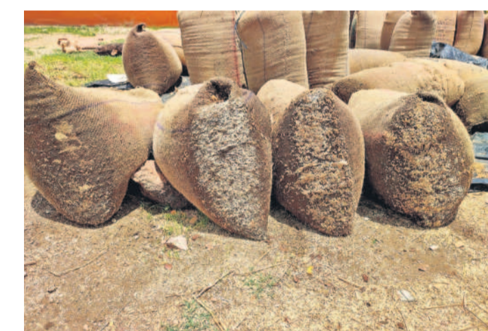
మహబూబాబాద్ జిల్లా నర్సింపాలపేట మండలం ముంగిమదుగు ధాన్యం కొనుగోలు కేంద్రంలో కాంటా అయిన వడ్డుతో సకాలంలో లోడ్ ఎత్తక మొలకెత్తిన బస్సాల్లోని ధాన్యం