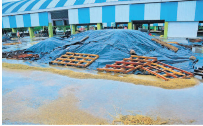
సిద్దిపేట మార్కెట్ యార్డులో శుక్రవారం కురిసిన భారీ వర్షానికి ధాన్యం రాశులను ముంచెత్తిన వరదనీరు