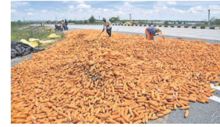
హనుమకొండ జిల్లా హనునపల్లి మండలం రెడ్డిపురం లింగ్ రోడ్డుపై శుక్రవారం తడిసిన వడ్డును ఆరబోస్తున్న రైతులు