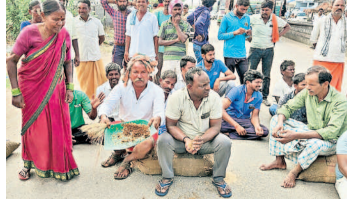
మెదక్ జిల్లా రామాయంపేటలో మొలకెత్తిన ధాన్యాన్ని చూపిస్తున్న రైతులు

నమస్తే తెలంగాణ, న్యూస్ నెట్ వర్క్, మే 17: రైతులు ఆరుగాలం కష్టంపడి పండించిన ధాన్యాన్ని అమ్ముకునేందుకు కొనుగోలు కేంద్రాలకు తీసుకొస్తే.. 47 రోజులు కావచ్చున్నా ప్రభుత్వం కొనడం లేదని అన్నదాతలు మండిపడుతున్నారు. మార్కెట్ యార్డులు, కొనుగోలు కేంద్రాల్లో దాన్యాన్ని రాశులుగా పోసి అధికారులు ఎప్పుడు కాంటాలు వేసి కొంటారోనని రోజు తరబడి నిరీక్షిస్తున్నారు. సర్కారు నిర్ణయం కారణంగా అకాల వర్షాలకు ధాన్యం తడిసి మొలకెత్తుతున్నది. మరెక్కొచ్చి చోట్ల వరద నీటికి కొట్టుకుపోతున్నదని ఆగ్రహించిన అన్నదాతలు శుక్రవారం ఆందోళనలు చేపట్టారు. యాదాద్రి భువనగిరి జిల్లా అత్యుత్సాహి(ఎం)లోని సబ్ మార్కెట్ యార్డు ప్రధాన గేటుకు తాళం వేసి నిరసన తెలిపారు. అనంతరం మోత్యూర్-భువనగిరి ప్రధాన