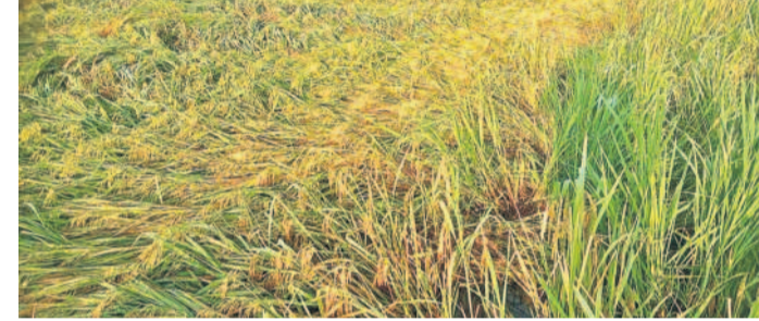
పెద్దపల్లి జిల్లా మంథని మండలం వెంకటాపూర్ నేలకొరిగిన వరి పంట

నమస్తే తెలంగాణ నెట్ వర్క్: రాష్ట్రవ్యాప్తంగా పలు జిల్లాల్లో కురిసిన అకాల వర్షం రైతులను అతలాకుతలం చేసింది. కొనుగోలు కేంద్రాల్లో ఆరబోసిన వడ్డు భారీ వర్షంతో మళ్లీ తడిసిముద్దయ్యాయి. పలుచోట్ల వడ్డు గింజలు వరదలో కొట్టుకుపోయాయి. శుక్రవారం ఉమ్మడి వరంగల్, కరీంనగర్, మెదక్, ఆదిలాబాద్ జిల్లాల్లో పలుచోట్ల ఈడూరుగాలులతో భారీ వర్షాలు కురిశాయి. ఉమ్మడి వరంగల్ జిల్లావ్యాప్తంగా గురువారం రాత్రి నుంచి ఆర్ష రాత్రి వరకు భారీ వర్షం కురిసింది. జనజీ వనం స్తంభించిపోయింది. వారులు, వంకలు ఉప్పొంగడంతో పలు గ్రామాలకు రాకపోకలు నిలిచిపోయాయి. వడ్డు తడిసిముద్దయ్యాయి. మహబూబాబాద్ జిల్లా నర్సింపాలపేట మండలం, మహబూబాబాద్ మండలం గాంధీ పురం, ముడుపుగల్ కొనుగోలు కేంద్రాల్లో ధాన్యం తడిసి మొలకెత్తింది. గార్ల మండలం రాంపూర్ చెక్ డ్యాం నుంచి వరద పొంగిపొరడంతో మండలంలోని 15 గ్రామాలకు రాకపోకలు నిలిచిపోయాయి. బయ్యారం మండలంలో పందిపంపుల, మసీదా గుట్టతంగా ప్రవహిస్తున్నాయి. జంగాలపల్లి క్రాస్ రోడ్డులో జంగాలపల్లి, ఇంచర్లకు చెందిన 30 మంది రైతుల మూడువేల క్వింటాళ్ల ధాన్యం తడిసి ముద్దయింది. గోవిందరావుపేట, వెంకటాపూర్, మంగపేట, ఏలూరుగూడల, ములుగు, వాణేపేట, వెంకటాపూరం (నూగూరు), కన్యామూడెం మండలాల్లో ధాన్యం తడిసిపోయింది. జయశంకర్ భూపాలపల్లి జిల్లాలో కురిసిన భారీ వర్షానికి కొనుగోలు కేంద్రాల్లోని ధాన్యం నీళ్లపాలైంది. ఆరబోసిన వడ్డు తడిసి మొలకెత్తుతున్నాయి. హనుమకొండ జిల్లాలో వరి మండలాల్లో కురిసిన వర్షానికి రోడ్డుపై ఆరబోసిన మళ్లీసారి వడ్డు తడిసిముద్దయ్యాయి. వాటిని ఆరబెట్టుకునేందుకు రైతులు నానా తంటాలు పడుతున్నారు. కొనుగో