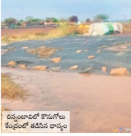
చిన్నంబావిలో కొనుగోలు కేంద్రంలో తడిసిన ధాన్యం

వెల్లిలో 18.8, అలంపూర్లో 0.2 మి.మీటర్లు పెంపు వెల్లిలో 6.5 సెంటీమీటర్ల వర్షపాతం నమోదైనట్లు అధికారులు తెలిపారు. అలంపూరు మున్సిపాలిటీలో శుక్రవారం సాయంత్రం కురిసిన వర్షపాటి వరదానికి అక్కర్ పేట కాలనీవాసులు ఇబ్బందులు ఎదుర్కొన్నారు. భారీ ఉష్ణోగ్రతలతో వేడికి వేడిగా గురు, శుక్రవారాల్లో కురిసిన వర్షానికి చల్లబడడంతో ప్రజలు ఉపశమనం పొందారు. కాగా కొన్నిచోట్ల ధాన్యం కాపాడుకోవడానికి అన్నదాతలు తీవ్ర ఇబ్బందులు పడ్డారు. ఈ వర్షానికి దుక్కులు దున్నుకుని పొలాల్లోని సిద్ధం చేసుకునే పనుల్లో రైతులు నిమగ్నమయ్యారు.