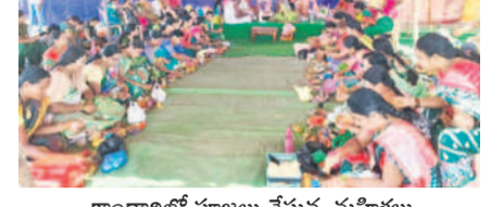
గాంధారిలో పూజలు చేస్తున్న మహిళలు