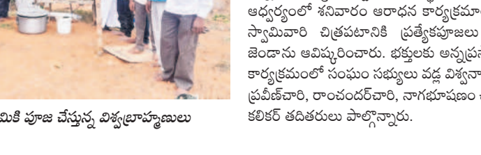
వీరబ్రహ్మేంద్రస్వామికి పూజ చేస్తున్న విశ్వజ్ఞాపూజులు