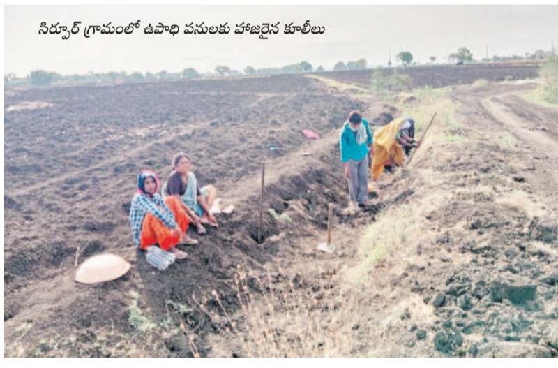
సిద్దార్ గ్రామంలో ఉపాధి పనులకు హాజరైన కూలీలు

దోంగ్రి, మే 18 : గ్రామీణ ప్రాంతాల్లోని కూలీలకు ఉపాధి కల్పించేందుకు ప్రవేశపెట్టిన జాతీయ గ్రామీణ ఉపాధి పథకం లక్ష్యం నెరవేరడం లేదు. అధికారుల నిర్లక్ష్యంతో కూలీలకు గిట్టుబాటు కూలి డబ్బులు రావడం లేదు. ఫీల్డ్ అసిస్టెంట్ కారణంగా తాము సప్లై పోతున్నామని పలువురు కూలీలు ఆరోపిస్తున్నారు. పనిచేయని వారికి కూడా ఫీల్డ్ అసిస్టెంట్లు మళ్లీ హాజరు వేస్తున్నారని, దీంతో పనిచేసే వారు సప్లై పోతున్నారని వారు ఆవేదన వ్యక్తం చేస్తున్నారు. పని చేయని వారికి హాజరు వేసేందుకు ఎఫ్ఎఫ్ఎల్ డబ్బులు తీసుకుంటున్నారని ఆరోపిస్తున్నారు. తగ్గుతున్న కూలీల సంఖ్య.. మండలంలోని పలు గ్రామాల్లో ఉపాధి పనులు చేసే కూలీల సంఖ్య క్రమంగా తగ్గుతున్నది. కొన్ని