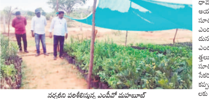
నర్సరీని పరిశీలిస్తున్న ఎంపీవో మహబూబ్

బిమ్మండ్ల, మే 18 : నర్సరీలో మొక్కలు ఎండిపోకుండా తగిన జాగ్రత్తలు తీసుకోవాలని ఎంపీవో మహబూబ్ అన్నారు. మండలంలోని బండ్లారెంజల్, గుడిసెమ్మి, వాజీ దేవగిరి గ్రామాల్లో ఆయన శనివారం పర్యటించారు.