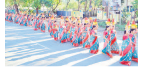
కామారెడ్డిలో కలశాలతో ఊరేగింపు నిర్వహిస్తున్న మహిళలు