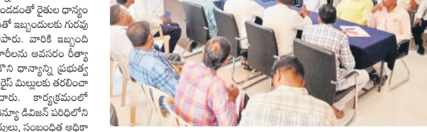
అధికారులు, సానైటీ కార్యదర్శులతో మాట్లాడుతున్న ఆర్డీవో