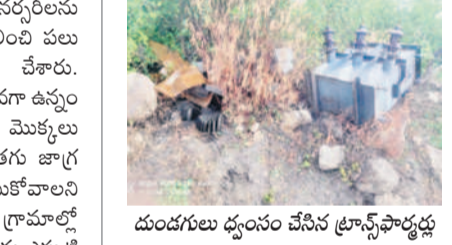
దుండగులు ధ్వంసం చేసిన ట్రాన్స్ ఫార్మర్లు

ఎల్లారెడ్డి, మే 18 : నాగిరెడ్డిపేట మండలంలోని లింగంపల్లి శివారం ఉన్న రెండు ట్రాన్స్ ఫార్మర్ల నుంచి గుర్తుతెలియని దుండగులు ఆయిల్ను దొంగిలించినట్లు ట్రాన్స్ ఫోర్మర్లకు తెలిసింది. కేసును తెలిపారు. ఎన్ఎస్ నంబర్ 22, 25ను దొంగలు ధ్వంసం చేసి వాటిలో ఉన్న సుమారు 150 లిటర్ల ఆయిల్ను కోరి చేశారు అన్నారు. దీంతో సంస్థకు సుమారు రెండు లక్షల రూపాయల నష్టం వాటిల్లిందని, ఈ విషయమై పోలీసులకు హిర్యాంతు చేసినట్లు చెప్పారు.