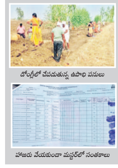
దోంగ్రిలో చేపడుతున్న ఉపాధి పనులు