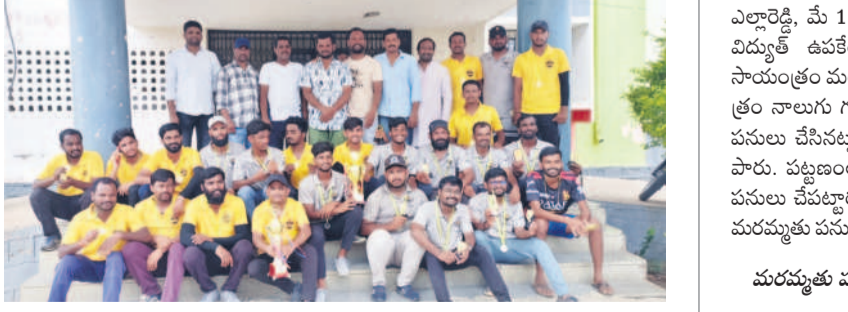
విజేత జట్టుతో బోర్డు నిర్వాహకులు