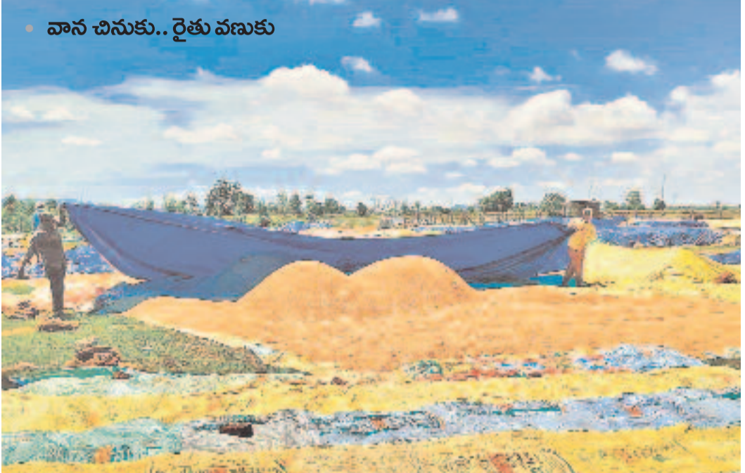
ములుగు జిల్లా ఏటూరునాగారం మండలంలో ధాన్యం కాంటాలు వారాల తరబడి జరగడం లేదు. చింతో కొనుగోలు కేంద్రాల్లో వడ్డు రాసులు పోసి ఉన్నాయి. ఆకాశం మేఘావృతం కావడంతో వడ్డుకుప్పలపై టార్పాలిన్ కప్పేతున్న రైతులు