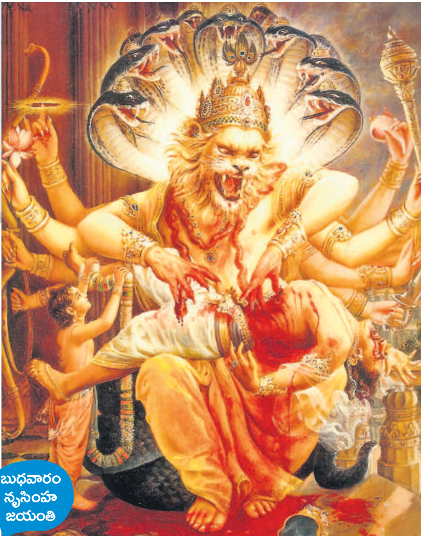
బుధవారం న్యూసింహ జయంతి