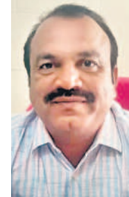
- నిర్వహణ, డిప్యూటీ డిఎంపీఎస్, జోగుళాంబ గద్వాల

గ్రామీణ వైద్యులు కేవలం ప్రథమ చికిత్సలు మాత్రమే చేయాలి తప్పా స్థాయికి మించి వైద్యచికిత్సలు చేయరాదు. రోగులకు సంబంధించిన ఆరోగ్య సమస్యలను దృష్టిలో ఉంచుకొని ప్రభుత్వ దవాఖానకు లేదా ఎంపీపీల డాక్టర్లకు రిఫర్ చేయాలి తప్ప గ్రామీణ వైద్యులు చికిత్సలు చేయరాదు. ఇప్పటికే జిల్లా వ్యాప్తంగా స్థాయికి మించి చేసే గ్రామీణ వైద్యుల క్లినిక్ లను తనిఖీ చేసి వారిపై చర్యలు తీసుకుంటున్నాం.