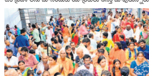
క్యూకాంప్లెక్స్ లో వేచి ఉన్న యాత్రికులు

శ్రీశైలం, మే 19 : శ్రీశైలంలో భక్తుల సందడి చెలరేగుతోంది. ఆదివారం, వారాంతపు సెలవులు కావడంతో వివిధ రాష్ట్రాల నుంచి యాత్రికులు స్వామి, అమ్మవారి దర్శనాలకు పోయారు. దీంతో ఆదివారం సాయంత్రం ప్రరవీధులన్నీ శివనామస్మరణతో మార్మొగాయి. భక్తుల ఆర్త కేసరీ పాల్గొనే అవకాశం కల్గింది. భ్రమరాంబామహిళార్చన స్వామి, అమ్మవార్ల ఉభయ అలయాల తోపాటు పరివార దేవతాలయాల దర్శనాలకు సుమారు నాలుగు గంటల సమయం పడుతుందని అధికారులు తెలిపారు. పర్యాటక ప్రదేశాలను మాసంపాడుకు యాత్రికులు ఆసక్తి చూపుతున్నారు.