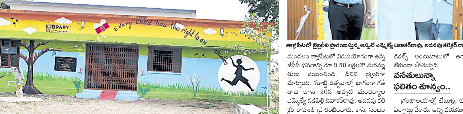
నిరుపయోగంగా మారిన గ్రంథాలయం

● తాళ్లపేటలో తెరుచుకోని లైబ్రరీ ● కేసీఆర్ ప్రభుత్వంలో ప్రారంభం.. నేడు నిరుపయోగం ● పాలకుల పట్టించుకోలేక తనం.. అధికారుల నిర్లక్ష్యం ● అన్ని వనతులున్నా ఫలితం శూన్యం