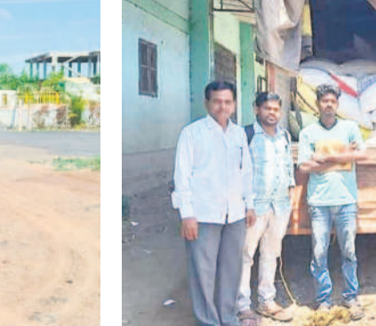
ఇటీవల కాగజేనగర్ చింతగూడ కోయవారు వద్ద అక్రమంగా మహారాష్ట్రకు తరలించేందుకు సిద్ధంగా 122 క్వింటాళ్ల బియ్యాన్ని పట్టుకున్న అధికారులు

తాల్లో లబ్ధిదారుల నుంచి రేషన్ షాపు వద్దనే కొనడం, మరొకటి ప్రాంతాల్లో లబ్ధిదారులకు ఇవ్వకుండానే నేరుగా రేషన్ బియ్యాన్ని అక్రమంగా తరలిస్తున్నారనే ఆరోపణలు వస్తున్నాయి. కిలో బియ్యాన్ని రూ. 12కు కొనుగోలు చేసే మహారాష్ట్రలోని సరిహద్దు ప్రాంతాల్లో రూ. 20కు వరకు విక్రయిస్తున్నారు. మహారాష్ట్రకు తరలి వెళ్తున్న బియ్యాన్ని పట్టుకునేందుకు మద్దతు ఎక్కడ చెకెపోస్తులు లేవు. ద్వితీయ వ్యాపారులు, అటోలు, చిన్న వ్యాపారులు అక్రమంగా, అక్రమంగా, సిర్పూర్-టీ మండలంలోని వెంట్రియావేట్, తదితర మహారాష్ట్ర సరిహద్దు ప్రాంతాలకు తరలిస్తున్నారు. అక్కడ గోదాముల్లో దండం చేసి, అక్కడి నుంచి భారీ వాహనాల్లో