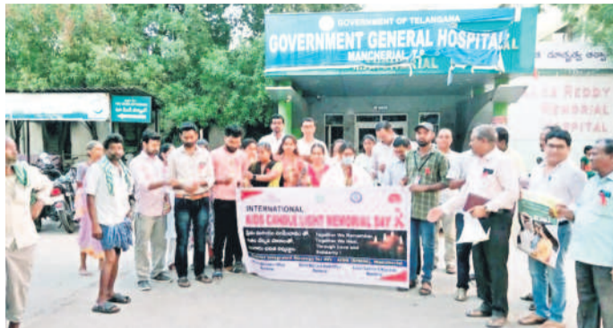
ర్యాలీని ప్రారంభిస్తున్న డిఎంహెచ్

జైనుర్, మే 19 : జైనుర్ మండలంలో శాంతిభద్రతలు అదుపులో ఉంచేందుకు ప్రజలు సహకరించాలని, ఎలాంటి సభలు, సమావేశాలు, ధర్నాలు, రాసారోకోలు, రా్యాలీలు నిర్వహించవద్దని ఆసిఫాబాద్ డిఎస్పీ సదయ్య ఆదివారం ఒక ప్రకటనలో విజ్ఞప్తి చేశారు. జైనుర్ మండల కేంద్రంలో ఉన్న అన్ని దుకాణాల సముదాయాలను తెలివి వ్యాపారాలను నిర్వహించుకోవచ్చని సూచించారు. ఈ మండలంలో లా అండ్ ఆర్డర్ సమన్వయ ఉన్నందున ఇతర మండలాల వారు జైనుర్లో నిర్వహించే సభలు, సమావేశాలకు హాజరయ్యేందుకు రావద్దని సూచించారు. మండల కేంద్రంలో పోలీసు బలగాలతో పట్టి బందోబస్తు నిర్వహిస్తున్నారని, ఇందులో భాగంగా ప్రధాన రాహదారిపై వాహనాలను తనిఖీలు నిర్వహిస్తున్నట్లు తెలిపారు. ఎలాంటి అలాంఘన సంఘటనలు జరగకుండా చర్యలు తీసుకుంటున్నట్లు పేర్కొన్నారు. సోమవారం నుంచి వ్యాపారాలను కొనసాగించుకోవచ్చని వ్యాపారులకు తెలిపారు. ఏదైనా ఇబ్బందులుంటే పోలీసులను సంప్రదించాలని సూచించారు. శాంతిభద్రతలకు భంగం కలిగించేలా మాట్లాడడం, ప్రచారం చేయవద్దన్నారు. ఇందుకు అన్ని వర్గాల ప్రజలు సహకరించాలని కోరారు. ప్రజలకు పోలీసులు పూర్తి స్థాయి భద్రత కల్పిస్తారని తెలిపారు. చట్ట వ్యతిరేక పరమైన చర్యలకు పాల్పడే వారిపై తీవ్ర చర్యలు తీసుకుంటామని హెచ్చరించారు.