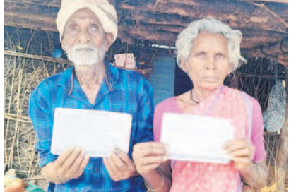
ప్రజాపాలన రసీదులను చూపుతున్న వృద్ధ దంపతులు

పూరి గుడిసెలో ఉండే వృద్ధులకు వర్తించని గృహజ్యోతి పథకం