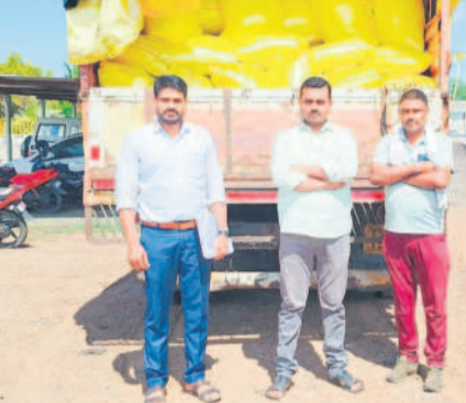
వాంకిడి: ఈ నెల 18న సరాండి బోర్డ్ షాణా వద్ద పట్టుకున్న 123 క్వింటాళ్ల బియ్యం వ్యాసీతో ఎన్ఫోర్స్ మెంట్ డివీజీ రాజకీయమార్

కుమ్రం భీం ఆసిఫాబాద్, మే 19 (నమస్తే తెలంగాణ) : జిల్లాలో దాడులు జరుగుతున్నా రేషన్ బియ్యం అక్రమం దండా ఆగడం లేదు. పక్కా సమాచారంతో టాన్స్ ఫార్మ్ అధికారులు దాడులు చేస్తున్నా అక్రమార్కుల్లో మార్పు రావడం లేదు. స్థానిక అధికారుల అందడం, రాజకీయ నాయకుల సహాయ సహకారాలతోనే బియ్యం దండా యధేచ్ఛా కొనసాగుతున్నదనే అసమానాలు కలుగుతున్నాయి. బియ్యం రవాణా చేస్తూ పట్టుబడుతున్న వారిపై కేసులు నమోదవుతున్నప్పటికీ అక్రమ బియ్యం దండా మాత్రం ఆగడం లేదు. అక్రమార్కులు వివిధ మార్గాల్లో రేషన్ బియ్యాన్ని అక్రమంగా తరలిస్తున్నారు. ప్రతి నెలా ప్రభుత్వం రేషన్ బియ్యాన్ని రేషన్ దుకాణాల ద్వారా అభిదారులకు పంపిణీ చేస్తుంది. బియ్యం అక్రమ రవాణాపై నిఘా పెంచి పట్టుకున్న అధికారులు ఇటీవల అక్రమ రవాణాపై దృష్టి సారించకపోవడంతో అక్రమ వ్యాపారులు చెలరేగిపోతున్నారనే ఆరోపణలు వస్తున్నాయి. జిల్లాలో రేషన్ బియ్యం అక్రమ రవాణా మాఫియా మారినది. కాగజేనగర్ అడ్డా ఇటు మంచెర్యాల, బెల్లంపల్లి నుంచి, మరో వైపు ఆసిఫాబాద్ నుంచి సిర్పూర్-టీ మీదగా చౌక బియ్యం పారుతున్నా రవాణాకి రవాణా అవుతున్నది. ఈ దండా ప్రతి నెలా రేషన్ దుకాణాల్లో లబ్ధిదారులకు బియ్యం ఇవ్వడం నుంచి మొదలవుతున్నది.