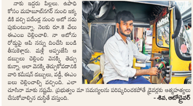
నాకు ఇద్దరు పిల్లలు. ఉపాధి కోసం మహబూబ్ నగర్ నుంచి ఇక్కడికి వచ్చి పదేండ్ల నుంచి ఆటో నడుపుతుంటున్నా. నెలకు రూ.8 వేల ఈఎంబి చెల్లించాలి. నా ఆటోను రోడ్డుపై ఆటో నన్ను దింపి బండి తీసుకెళ్లారు. మళ్లీ అప్పుడే ఆ డబ్బులు చెల్లించి వెళ్లితే ఆ డబ్బులు అలా వెనక్కి తెచ్చుకోవడానికి వారి కమిషన్ డబ్బులు, పక్కీ ఈఎంబి చెల్లించాలి వచ్చింది. ఎలా చూసానా మాకు నన్ను. ప్రభుత్వం మా సమస్యలను పరిష్కరించకపోతే డ్రైవర్లకు ఆత్మహత్యలు చేసుకోవాల్సిన దుస్థితి వస్తుంది.