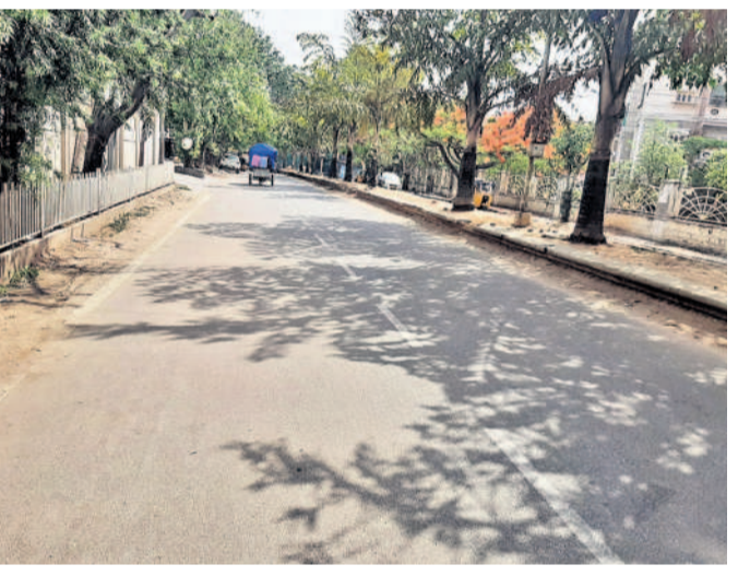
హైదర్ గూడ జనప్రియ ప్రధాన రహదారిపై వేగ నియంత్రణ సూచికలు లేని దృశ్యం

అత్తాపూర్, మే 19: ప్రధాన రహదారులపై స్పీడ్ బ్రేకర్లు లేకపోవడంతో పాదచారులు, సీనియర్ సిటీజన్లు తీవ్ర ఇబ్బంది పడుతున్నారు. వాహనదారులు రయ్యింటూ దూసుకుపోతుండడంతో తరచూ ప్రమాదాలు జరుగుతున్నాయి. ఎన్నో సార్లు రాజేంద్రనగర్ సర్కిల్ జీహెచ్ఎంసీ అధికారులు లకు స్పీడ్ బ్రేకర్ల ఏర్పాటు చేయాలని చెప్పినా పట్టించుకోవడం లేదని అత్తాపూర్ ప్రజలు వాపోతున్నారు. అత్తాపూర్, హైదర్ గూడ, నందిముస్తాఫాగూడ, చూడకాలని లాంటి జనసాంద్రత ప్రాంతాల్లో వాహనాల రాకపోకలు ఎక్కువగా ఉంటాయి. ఈ ప్రాంతాల్లో మైనర్లు ఎక్కువగా వాహనాలు నడుపుతుంటారు. లంగర్ హౌస్ బాఫులూ బిడ్డి నుంచి హైదర్ గూడ వెళ్లే రహదారిపై స్పీడ్ బ్రేకర్లు లేని కారణంగా ప్రతిరోజూ ప్రమాదాలు జరుగుతున్నాయి. వాహనాల వేగం ఎక్కువగా ఉండడం వల్ల ప్రమాదాలు జరుగుతున్నాయని హైదర్ గూడ ప్రజలు