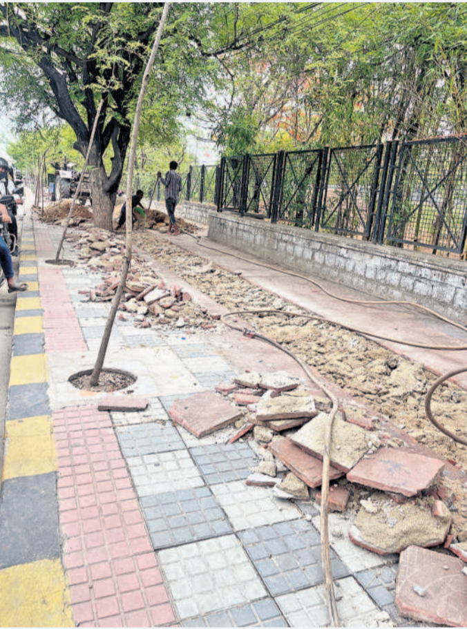
కేబిఆర్ పార్కు చుట్టూ పుట్పాతను తవ్వేస్తున్న దృశ్యం

బంజారాహిల్స్, మే 19: బంజారాహిల్స్ రోడ్ల నం-2లోని కేబిఆర్ పార్కు నుంచి జూబ్లీహిల్స్ వెళ్లేదారిలో డాకా కేబిఆర్ పార్కు చుట్టూ వేసిన పాదచారుల కోసం ఏర్పాటు చేసిన పుట్పాతను మరోసారి తవ్వేస్తున్నారు. లక్షలాది రూపాయల వ్యయంతో అరు నెలల క్రితం కేబిఆర్ పార్కు చుట్టూ పుట్పాత నిర్మించారు. పుట్పాత నిర్మించిన కొన్ని రోజులకే కేబుక్ కోసం అంబు గతంలో తవ్వేశారు. ఆ మరమ్మతులు పూర్తిచేసి రెండు మూడు నెలలు కూడా గడవక ముందే మరోసారి ఇలా తవ్వేస్తున్నారు. శాఖల మద్ద్యను సమస్యను కొరవడంతో లక్షలాది రూపాయల ప్రజాధనం రోడ్డు పాలవుతోందని స్థానికులు ఆవేదన వ్యక్తం చేస్తున్నారు.