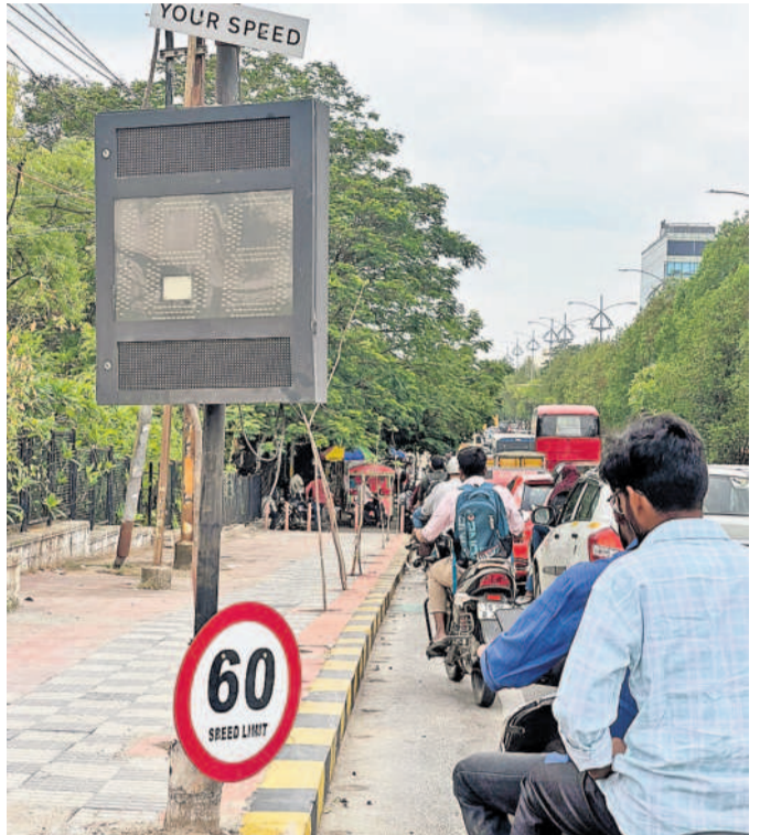
బంజారాహిల్స్లోని కేబిఆర్ పార్కు నుంచి జూబ్లీహిల్స్ వెళ్లేదారిలో నిరుపయోగంగా మారిన డివైజ్ బోర్డు

బంజారాహిల్స్, మే 19: అచివగంట్ వెళ్లే బాహుదారులను కట్టడి చేసేందుకు ట్రాఫిక్ పోలీసులు గత ప్రభుత్వంలో చేపట్టిన ప్రయోగాత్మక విధానాలు కొత్త ప్రభుత్వంలో నీరుగా రుతున్నాయి. బంజారాహిల్స్ రోడ్ల నం-2లోని కేబిఆర్ పార్కు నుంచి జూబ్లీహిల్స్ వెళ్లే పోస్ట్ రోడ్డులో అత్తనగర్ వేగంగా వాహనాలు వెళ్తుండగా కారణమవుతున్నాయని గుర్తించిన ట్రాఫిక్ ఉన్నతాధికారులు ఈ రోడ్డుపై వేగనియంత్రణ చర్యలు చేపట్టాలని నిర్ణయించారు. దీనిలో భాగంగా ఈ రోడ్డులో ఎలక్ట్రానిక్ స్పీడ్ బ్రేకర్లను ఏర్పాటు చేశారు. రోడ్డు మీద వెళ్తున్న వాహనాల వేగాన్ని లెక్కించే ఈ డివైజ్ లో కమోడరు వేగం ట్రాఫిక్ విభాగం సీనియర్ కెమెరాలతో అనుసంధించాలని గతంలో అధికారులు మీటింగ్ ఏర్పాటు చేశారు. నాలుగైదు నెలలు బాగానే పనిచేసిన ఈ డివైజ్.. ఇటీవల పనిచేయడం మానేసింది. దీని నిర్వహణపై ఎవరూ దృష్టి రోడ్డుపై వేగనియంత్రణ చర్యలు చేపట్టాలని నిర్ణయించారు.