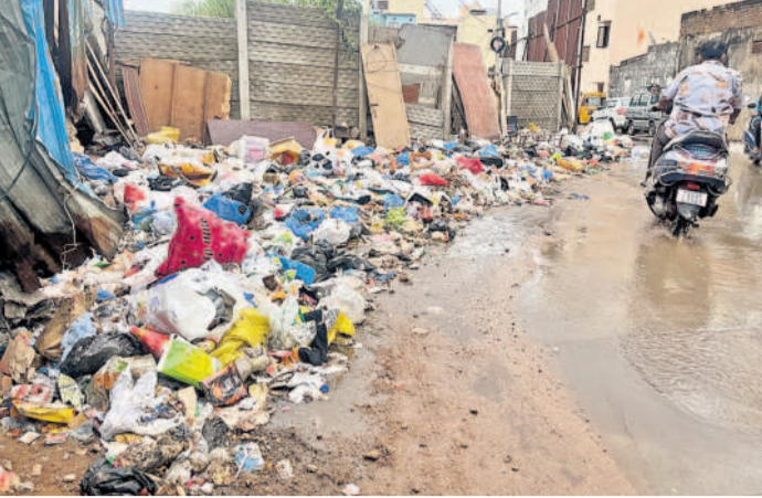
జూబ్లీహిల్స్లో అన్నపూర్ణ స్టూడియో ఎదురుగా కుప్పలగా పేరుకుపోయిన వ్యర్థాలు