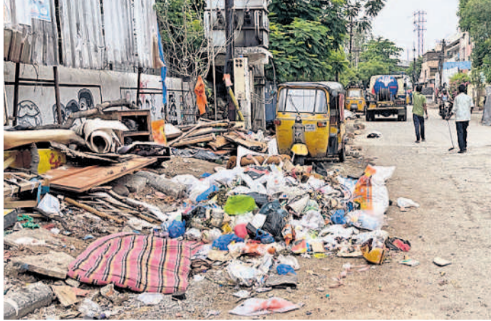
బంజారాహిల్స్ రోడ్లన 2లోని ఎల్ఐఆర్ ట్రస్ట్ భవన నుంచి ఇందిరానగర్ వెళ్లేదారిలో పేరుకుపోయిన చెత్తకప్పలు