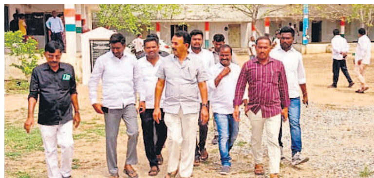
పెద్దదగడ పాఠశాలను పరిశీలిస్తున్న మంత్రి జూపల్లి కృష్ణారావు