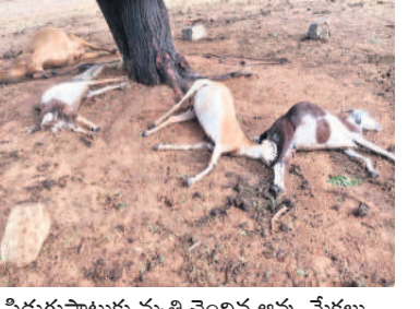
పిడుగుపాటుకు మృతి చెందిన ఆవు, మేకలు

• పిడుగుపాటుతో ఆవు, మేకలు మృతి వంగూరు, మే 19 : మండలంలోని పలు గ్రామాల్లో ఆదివారం సాయంత్రం తుపాను ములు, మెరుపులతో కూడిన భారీ వర్షం కురిసింది. ఉపరితల ద్రోణి కారణంగా వాతావరణం చల్లబడడంతో ప్రజలు తీవ్రమైన ఎండల నుంచి ఉపశమనం పొందారు. వర్షం కారణంగా లోతట్టు ప్రాంతాలు జలమయమయ్యాయి. వంగూరు మండల కేంద్రంలోపాటు డిండిలింకపల్లి, చౌదర్ పల్లి, పోల్లంపల్లి, గజార, నిజాంబాద్, మిట్టపదగోడు, ఉల్లూర్, రంగారాజ్, కొండార డ్డిపల్లితోపాటు పలు గ్రామాల్లో భారీ వర్షం కురిసింది. అకాల వర్షానికి తోడు పలు చోట్ల పిడుగులు పడ్డాయి. మండలంలోని నిజాంబాద్లో ఆదివారం పిడుగుపడి లింగమయ్యకు చెందిన ఆవు, పాపయ్యకు చెందిన మూడు మేకలు మృతి చెందాయి.