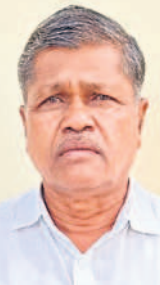
పెండింగ్లో ఉన్న గొర్రెల కాలనల సంపూర్ణ లక్ష్యాన్ని అధిష్టించు

కాంగ్రెస్ ప్రభుత్వానికి చేతగాకే గొర్రెల పంపిణీ పథకాన్ని ఆపేసింది. కేసీఆర్ ప్రభుత్వం చేపట్టిన పథకాలను కాంగ్రెస్ ప్రభుత్వం కావాలనే పెండింగ్లో పెడుతున్నది. దీనివల్ల పేద కుటుంబాలు ఉపాధిని కోల్పోతున్నాయి. పథకాన్ని రద్దు చేసినట్లు ప్రకటించకూడదా కేసీఆర్ ఆరోపణలతో సంతోషం పథకాలను ప్రభుత్వం సందిగ్ధంలో పడినది. ప్రజల్లో ఆదరణ ఉన్న పథకాలను తొలగించిన కాంగ్రెస్ ప్రజలు తగిన గుణపాఠం చెబుతారు.