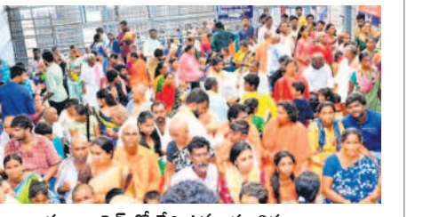
క్యూకాంపెక్ట్ లో వేచి ఉన్న యాత్రికులు

శ్రీశైలం, మే 19 : శ్రీశైలంలో భక్తుల సందడి చెలరేగింది. ఆదివారం, వారాంతపు సెలవులు కావడంతో వివిధ రాష్ట్రాల నుంచి యాత్రికులు స్వామి, అమ్మవారి దర్శనాలకు పోలితారు. దీంతో ఆదివారం సాయంత్రం ప్రరవీధులన్నీ శివనామస్మరణతో మార్మొగాయి. భక్తుల ఆర్త సేవలో పాల్గొనే అవకాశం కల్పించారు. భ్రమరాంబావలికార్డున స్వామి, అమ్మవార్ల కథలను అలంకారాలతో పాటు పరివార దేవతలయాల దర్శనాలకు సుమారు నాలుగు గంటల సమయం పడుతుందని అధికారులు తెలిపారు. పర్యాటక ప్రదేశాలను మానెందుకు యాత్రికులు ఆసక్తి చూపుతున్నారు.