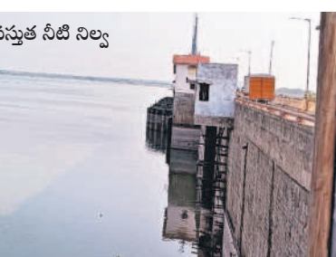
జూరాలలో ప్రస్తుత నీటి నిల్వ

ప్రతి విద్యార్థికి మెరుగైన విద్యనందించాలి • సొంత నిధులతో అభివృద్ధి పనులు చేపడుతూ : మంత్రి జూపల్లి కృష్ణారావు విస్తంబావి, మే 19 : అన్ని ప్రభుత్వ పాఠశాలల్లో కార్పొరేట్ పాఠశాలలకు దీటుగా మార్కెట్ వసతులు కల్పిస్తామని, ప్రతి విద్యార్థికి మెరుగైన విద్య అందించడమే ప్రభుత్వ లక్ష్యమని ఎన్టీఆర్, చర్యలకు శాఖల మంత్రి జూపల్లి కృష్ణారావు పేర్కొన్నారు. దేశానికి ప్రభుత్వ పాఠశాలలను మంత్రి పరిశీలిస్తూ అలాగే సొంత నిధులతో అన్ని రకాల సౌకర్యాల కల్పించే దరఖాస్తులు తీసుకుంటామన్నారు. తన స్వగ్రామమైన పెద్దదగడ, విద్యనందించిన పెద్దదగడ కల్పించి నిలబడవలసి పాటించని వారిపై చట్టపరమైన చర్యలు తీసుకోవడానికి అవకాశం ఉన్నట్లు ఆరోగ్యశాఖ అధికారులు వారిపై దృష్టి సారించడంలో విఫలం అవుతున్నారని ప్రజలు ఆరోపిస్తున్నారు.