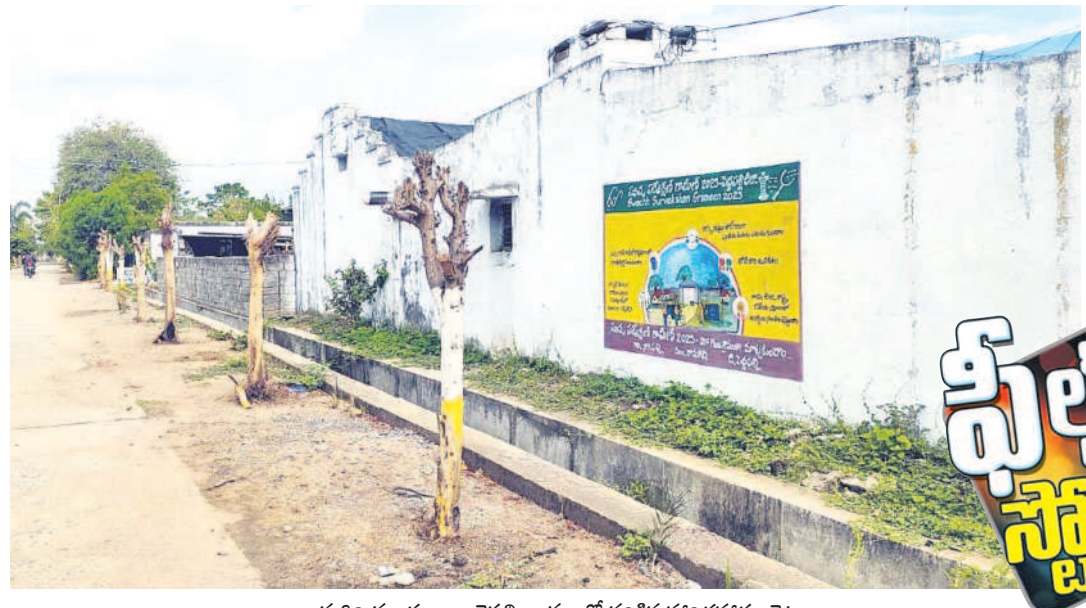
రామగిరి మండలం నాగపల్లి గ్రామంలో సరికైన హరితహారం చెట్లు

కొత్తపల్లి గ్రామంలో నలుగురు పారిశుధ్య కార్మికులు, ఒక ఎలక్ట్రిషియన్కు రెండు నెలల నుంచి జీతాలు అందలేదు. దాదాపు రూ.81 వేలు పెండింగ్లోనే ఉంది. రోజూవారి పారిశుధ్య పనుల కోసం వినియోగించిన డ్రాక్టర్లకు అవసరమైన రూ.49,600 డీజిల్ను డీజిల్ను పెట్రోల్ బంకల ద్వారా పంచాయతీ కార్యదర్శి పోయించాడు. ఇప్పటివరకు బిల్లులు రాలేదు. జీపీలో వాటర్ రెగ్యులేటర్ కార్మికుడు చేసిన వివిధ రకాల పనులకు సంబంధించి రూ.29,500 బిల్లులు పెండింగ్లో ఉన్నాయి. గ్రామంలో నిర్మించిన ఒక సైడ్ డ్రైన్, విద్యుత్ స్తంభాల విస్తరణ పనుల బిల్లు రూ.3లక్షలు పెండింగ్లోనే ఉంది. నిర్మించిన సీసీ రోడ్లకు సంబంధించిన రూ.1.20లక్షల బిల్లు గత సర్పంచ్కు రావాల్సి ఉన్నది.