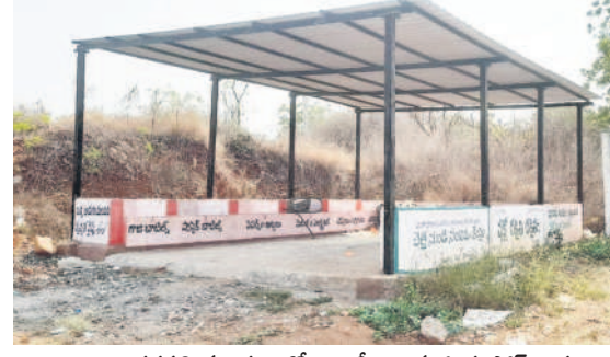
పెగడపల్లి మండలంలోని భాగీగా ఉన్న ఓ కంపోస్ట్ షెడ్డు

కరీంనగర్ జిల్లా హన్మాలేశ్వరి మండలంలోని 1,700 జనాభాగల ఒక చిన్న గ్రామానికి గతంలో ప్రతి నెలా రూ.1.20 లక్షల గ్రాంట్లు వచ్చేవి. ఇప్పుడు ఇవి నిలిచిపోవడంతో డ్రాక్టర్ నిర్వహణ కోసం స్టానిక పెట్రోల్ బంకోలో రూ.40 వేల క్రెడిట్ పెట్టారు. ఈ డబ్బు చెల్లించనిదే డీజిల్ పోయింది చెప్పడంతో గత నాలుగైదు నెలలుగా స్టానిక కార్యదర్శి ఇప్పటికే రూ.80 వేల వరకు భరించి డ్రాక్టర్ నిర్వహిస్తున్నారు. జిల్లాలోని అనేక చిన్న గ్రామ పంచాయతీల్లో ఇదే పరిస్థితి కనిపిస్తోంది. విద్యుత్ బిల్లులు చెల్లించేందుకు, మంచి నీటి సరఫరా చేసేందుకు కార్యదర్శులు ఆర్థిక భారాన్ని భరించాల్సి వస్తోంది.