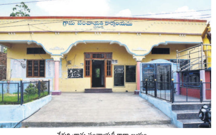
చేగర్ల గ్రామ పంచాయతీ కార్యాలయం

కరీంనగర్ మండలం చేగర్ల గ్రామం 1,530 మంది జనాభా ఉన్న చిన్న పంచాయతీ. గతంలో ఎన్ఎస్సీ, ఆర్థిక సంఘం కింద ప్రతి నెలా రూ.2.40 లక్షల వరకు నిధులు వచ్చేది. దీంతో డ్రాక్టర్, పారిశుధ్య నిర్వహణ, విద్యుత్ బిల్లులు చెల్లింపు వంటివి చేసేవారు. మిగిలిన నిధులతో అవసరమైన అభివృద్ధి పనులు చేసుకునేవారు. గడచిన ఆరు నెలలుగా ఎలాంటి నిధులూ లేక పోవడంతో అభివృద్ధి ఆగిపోయింది. ఉన్న కొద్ది పాటి నిధులతో పంచాయతీ నిర్వహణ జరుగుతోంది. దీనికి తోడు గత ఫిబ్రవరి నుంచి మిషన్ భగీరథ ఇంట్లా విలేజ్ పైన్ లైన్ నిర్వహణ పంచాయతీలకు ఇవ్వడంతో ఈ గ్రామంలో తరుమా పైన్ లైన్ వగిరి పోతోంది. ఇప్పుడు ఇది అదనపు ఖర్చుగా మారింది. ప్రతి నెలా రూ.10 వేల నుంచి రూ.15 వేలు పైన్ లైన్ నిర్వహణకు ఖర్చవుతోంది. ఉన్న నిధులు నిండుకుంట్లున్నాయి. ఇంకో నెల వరకు నిధులు సరిపోతాయి. కేంద్ర, రాష్ట్ర ప్రభుత్వాలు గ్రాంట్స్ విడుదల చేయకుంటే ఈ గ్రామం పరిస్థితి అగమ్యుగోచరమే. జిల్లాలో అనేక పంచాయతీల పరిస్థితి ఇలాగే ఉంది.