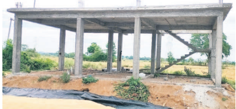
బాలరాజ్ పల్లిలో నిలిచిన కొత్త పంచాయతీ భవనం