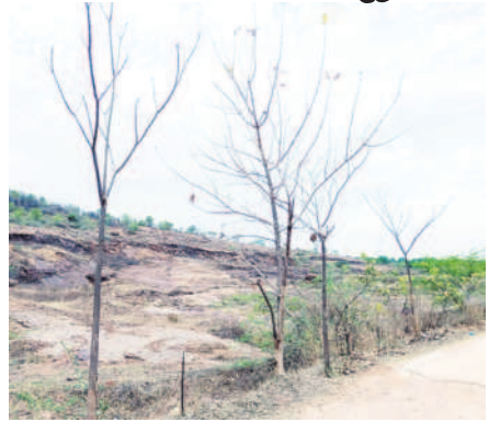
మోడల్ స్కూల్ రోడ్లో నీరు లేక ఎండిపోయిన చెట్లు