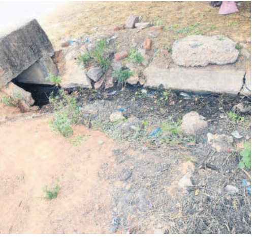
ఎలిగేడు మండలం రామాలపల్లిలో కూరుకుపోయిన డ్రైనేజీ

పల్లెలు తల్లడిల్లుతున్నాయి. మొన్నటిదాకా పచ్చని పొలాలు.. చిక్కని బంధాలు.. ఎటు చూసినా ఆహ్లాదకర వాతావరణం, ఇంటిముందు, ఇంటి వెనుక పెరకల్లో పరుచుకున్న పచ్చదనంతో నవ్వుమలైలుగా నిలిచిపోయిన గ్రామాలు, నేటి కాంగ్రెస్ ప్రభుత్వ పట్టింపులేమితో ఆనవాళ్లును కోల్పోయి స్థితికి చేరాయి. గత టీఆర్ఎస్ సర్కారు నెలనెలా నిధులు మంజూరు చేయగా, కొత్తగా కొలువుదీరిన సర్కారు నెలలుగా నిధులు ఇవ్వకపోవడంతో పనులన్నీ ఎక్కడిక్కడ ఆగిపోయి అడ్డంకంగా కనిపిస్తున్నాయి. కనీసం జీపీ సిబ్బందికి జీతాలు ఇవ్వకపోలేని, కరెంట్ బిల్లులు చెల్లించలేని దుస్థితిలో మగ్గిపోతుండగా, ప్రజల నుంచి విమర్శలు వెల్లువెత్తుతున్నాయి.