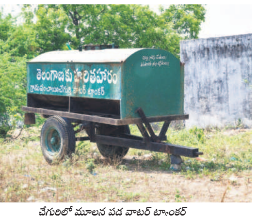
చేగర్లలో మూలన పడ్డ వాటర్ ట్యాంకర్