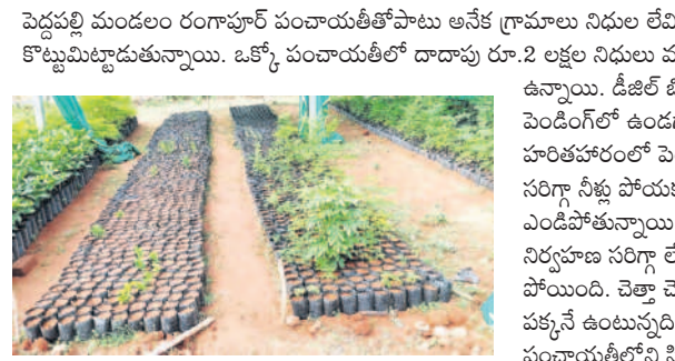
రంగాపూర్ సర్పటిలోని మొక్కల దుస్థితి

జీతం డబ్బులే పంచాయతీకి ఖర్చు అసలే అతనిది పేద కుటుంబం. 2019లోనే పంచాయతీ కార్యదర్శిగా ఉద్యోగం సాధించాడు. తల్లి దండ్రులు, భార్య పిల్లలు అతనిపైనే ఆధార పడి జీవిస్తున్నారు. వచ్చేది రూ.30 వేల జీతం. ఆరు నెలలుగా పంచాయతీలకు నిధులు రాకపోవడంతో అతని జీతం నుంచే పంచాయతీకి డబ్బులు ఖర్చు చేస్తుండగా తన ఇంటి అవసరాలు తీరడం లేదు. తల్లిదండ్రులకు మందులు, పిల్లల చదువులు, ఇంటి అద్దె, కుటుంబ పోషణ కష్టమవుతున్నది. వచ్చే జీతంలో దాదాపుగా రూ.15 వేల నుంచి రూ.20 వేల దాకా పంచాయతీ కరెంటు, డీజిల్ బిల్లులతో పోతున్నది. ఇది పెద్దపల్లి మండలంలో పనిచేస్తున్న ఓ పంచాయతీ కార్యదర్శి పరిస్థితి. ఇలాగేనే తామెలా బతికేదని వాపోతున్నాడు. ఇది ఈ ఒక్క కార్యదర్శి బాధ కాదు.. మొత్తం పంచాయతీల కార్యదర్శుల పరిస్థితి ఇలాగే ఉంది.