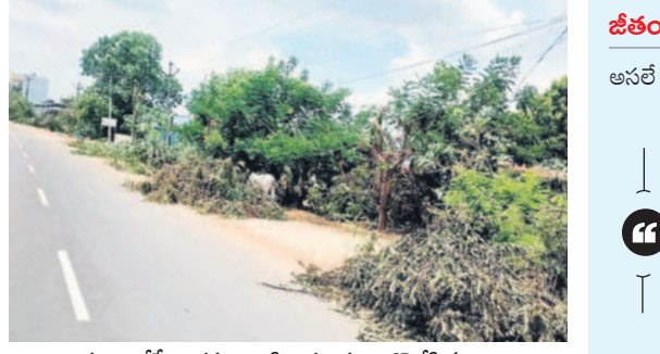
హన్మాలేశ్వరి రహదారికి ఇరువైపులా కొట్టేసిన చెట్లు

జీతం డబ్బులే పంచాయతీకి ఖర్చు అసలే అతనిది పేద కుటుంబం. 2019లోనే పంచాయతీ కార్యదర్శిగా ఉద్యోగం సాధించాడు. తల్లి దండ్రులు, భార్య పిల్లలు అతనిపైనే ఆధార పడి జీవిస్తున్నారు. వచ్చేది రూ.30 వేల జీతం. ఆరు నెలలుగా పంచాయతీలకు నిధులు రాకపోవడంతో అతని జీతం నుంచే పంచాయతీకి డబ్బులు ఖర్చు చేస్తుండగా తన ఇంటి అవసరాలు తీరడం లేదు. తల్లిదండ్రులకు మందులు, పిల్లల చదువులు, ఇంటి అద్దె, కుటుంబ పోషణ కష్టమవుతున్నది. వచ్చే జీతంలో దాదాపుగా రూ.15 వేల నుంచి రూ.20 వేల దాకా పంచాయతీ కరెంటు, డీజిల్ బిల్లులతో పోతున్నది. ఇది పెద్దపల్లి మండలంలో పనిచేస్తున్న ఓ పంచాయతీ కార్యదర్శి పరిస్థితి. ఇలాగేనే తామెలా బతికేదని వాపోతున్నాడు. ఇది ఈ ఒక్క కార్యదర్శి బాధ కాదు.. మొత్తం పంచాయతీల కార్యదర్శుల పరిస్థితి ఇలాగే ఉంది.