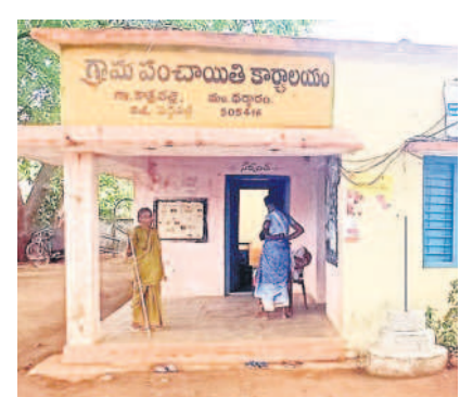
కొత్తపల్లి జీపీ కార్యాలయం

ధర్వారం, మే 19: ధర్వారం మండలంలోని ధర్వారం, కొత్తపల్లి గ్రామ పంచాయతీలను 'నమస్తే తెలంగాణ' విజిట్ చేసింది. ముందుగా ధర్వారం పంచాయతీని సందర్శించగా పలు విషయాలు వెలుగు చూశాయి. గ్రామంలో గత సర్పంచ్ నాలుగు సీసీ రోడ్లు, ఒక డ్రైనేజీ, ఒక బోర్డర్ వేయించాడు. ఇప్పటికీ అతనికి రూ.8 లక్షల బిల్లులు చెల్లింపు జరుగులేదు. గత మార్చిలో డ్రైనేజీకి చెక్కులు పంపించినప్పటికీ ఎన్నికల కోడ్ పేరుతో పెండింగ్లో పెట్టారు. ఇక గత సెప్టెంబర్ నుంచి ఇప్పటివరకు పారిశుధ్యం, హరితహారం కోసం వినియోగించిన డ్రాక్టర్లకు అవసరమైన రూ.2.80 లక్షల విలువైన డీజిల్ను పెట్రోల్ బంకల ద్వారా పంచాయతీ కార్యదర్శి పోయించాడు. ఇప్పటివరకు బిల్లులు రాలేదు.