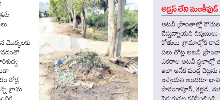
రంగాపూర్లో రోడ్డుపై చెత్తా చెదారం

లేదు. సర్పటిలో మొక్కల నిర్వహణ సరిగ్గా లేక ఎండిపోతున్నాయి. పలు గ్రామంలో తాజా మాజీ సర్పంచ్లు ఖర్చు చేసిన నిధుల బిల్లులు బకాయి రాలేదు. వచ్చే నెల నుంచి పంచాయతీ సిబ్బందికి జీతాలు ఇవ్వడం కూడా కష్టతరంగా మారనుంది.