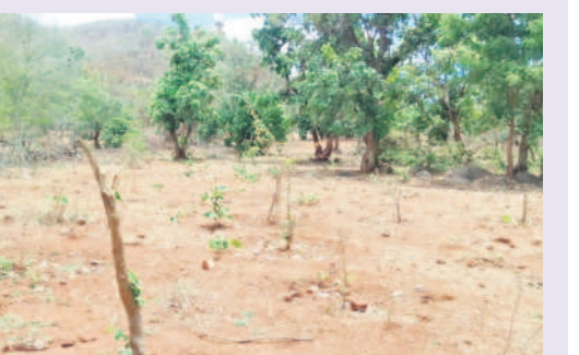
కల్లెడ గ్రామంలో ఆనవాళ్లు కోల్పోయిన మంకీఫుడ్ కోర్టు

కరీంనగర్ జిల్లా హన్మాలేశ్వరి మండలంలోని 1,700 జనాభాగల ఒక చిన్న గ్రామానికి గతంలో ప్రతి నెలా రూ.1.20 లక్షల గ్రాంట్లు వచ్చేవి. ఇప్పుడు ఇవి నిలిచిపోవడంతో డ్రాక్టర్ నిర్వహణ కోసం స్టానిక పెట్రోల్ బంకోలో రూ.40 వేల క్రెడిట్ పెట్టారు. ఈ డబ్బు చెల్లించనిదే డీజిల్ పోయింది చెప్పడంతో గత నాలుగైదు నెలలుగా స్టానిక కార్యదర్శి ఇప్పటికే రూ.80 వేల వరకు భరించి డ్రాక్టర్ నిర్వహిస్తున్నారు. జిల్లాలోని అనేక చిన్న గ్రామ పంచాయతీల్లో ఇదే పరిస్థితి కనిపిస్తోంది. విద్యుత్ బిల్లులు చెల్లించేందుకు, మంచి నీటి సరఫరా చేసేందుకు కార్యదర్శులు ఆర్థిక భారాన్ని భరించాల్సి వస్తోంది.