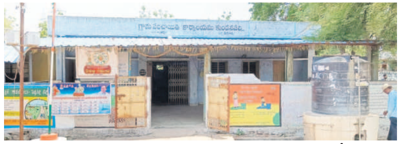
కుండనపల్లి గ్రామపంచాయతీ కార్యాలయం