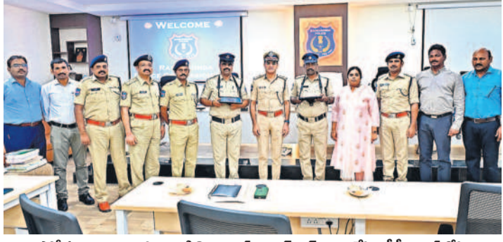
పోలీసు అధికారులు, సిబ్బందికి కొత్త ల్యాప్ టాప్, డెస్క్ టాప్ లు అందజేసిన సీపీ తరుణ్ జోషి

సిటీబ్యూరో, మే 21 (నమస్తె తెలంగాణ): నూతన న్యాయ చట్టాలపై పోలీసులు అవగాహన పెంచుకోవాలని రాచకొండ సీపీ తరుణ్ జోషి పేర్కొన్నారు. ఆరునెలల సాంకేతిక శిక్షణ అందిస్తున్నారని ప్రజలకు మరింత సమర్థవంతంగా సేవలందించగలమని సిబ్బందికి సూచించారు. పలువురు స్టేషన్ హౌస్ ఆఫీసర్లు, బ్లాక్ డిప్యూటీ, పిల్లల మైల్స్ సిబ్బందికి మంగళవారం సీపీ కొత్త ల్యాప్ టాప్, డెస్క్ టాప్ కంప్యూటర్లు అందజేశారు. రూ.1.38 కోట్ల వ్యయంతో కొనుగోలు చేసిన 170 ల్యాప్ టాప్లు, 18 డెస్క్ టాప్లు, 80 డెస్క్ టాప్ కంప్యూటర్లు ఆయా పోలీస్ స్టేషన్లకు పంపిణీ చేశారు. ఈ సందర్భంగా సీపీ మాట్లాడుతూ... ప్రజాసేవ తాతాపరతంతో లోకోత్సాహ ఎన్నికలు నిర్వహించడంలో సమర్థవంతంగా పనిచేసిన ఆన్ని విభాగాల అధికారులు, సిబ్బందికి అభినందలు తెలిపారు. ప్రస్తుత డిజిటల్ ప్రపంచంలో జరుగుతున్న నేలను అరికట్టడం అధునిక సాంకేతికతను సమర్థవంతంగా వినియోగించుకోవాలని సూచించారు. పోలీస్ శాఖలో పనిచేస్తున్న ప్రతి ఒక్కరికీ సాంకేతిక పరిజ్ఞానంపై ఒట్టు