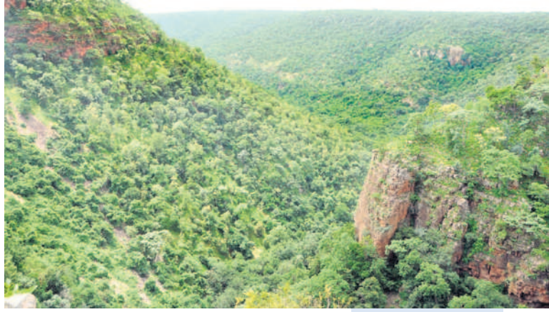
నల్లమల అటవీ ప్రాంతం