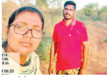
సర్వే చేసే దుతున్న అటవీ శాఖ సిబ్బంది

అచ్చంపేట, మే 21 : దేశంలో రెండో అతిపెద్దదైన అటవీ ప్రాంతం టైగర్ రిజర్వ్ (ఏటీఆర్) అటవీ ప్రాంతం జీవవైవిధ్యాన్ని కలిగిఉన్నది. నల్లమల అటవీ ప్రాంతం విభిన్న రకాల జంతుజాలానికి నిలయం. ఇది ముఖ్యమైన జీవవైవిధ్య జోన్ మాదిరిగా ఉంది. అటవీ ప్రాంతం, గడ్డి భూములు కలిగి ఉన్నది. టేకు, రోజ్ వుడ్, వెదురు, గూనెరెడ్డి, కిన్ చెట్లు అధికంగా ఉంటాయి. అటవీ ప్రాంతం రిజర్వ్ ఫార్మేషన్ చుట్టూ ఎత్తైన కొండలు, లోయలు, కృష్ణానది, జనసంచారానికి అవకాశాలు అంతగా లేకపోవడంతోపాటు బంపరజోన్ అధికంగా ఉండడంతో ఏటీఆర్ నల్లమల ప్రాంతం వన్యప్రాణులకు సేవకోసం మారింది. 25 పెద్దపులులు ఉండగా.. అందులో 12 కపుల్స్ ఉన్న అటవీశాఖ అధికారులు తెలిపారు. వీటిలో నాలుగు పెద్దపులులు పొరుగు రాష్ట్రాల నుంచి వచ్చినట్లు అంచనా.