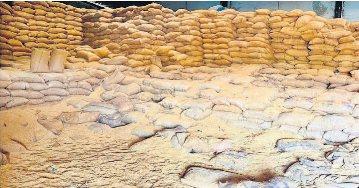
పెద్దాపూర్ గోదాంలో చోరీ అనంతరం మిగిలిన వడ్ల బస్తాల నిల్వలు (ఫైల్)