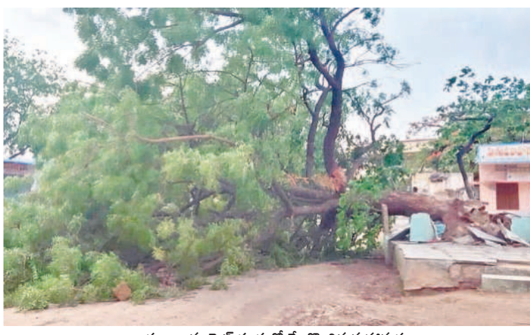
గద్వాల మార్కెట్ దుర్గాలో నేలకొరిగిన మహావృక్షం

రు. విషప్రయోగం చేసి కుక్కలను చంపారేమో అని అనుమానంగా ఉందని ఎస్సై తెలిపారు. కుక్కల స్పిండ్లని వాహనంలోనే తీసుకొచ్చి ఉంటారని, ఓల్డె నెలవయస్సు గ్రామంలోనే తీసుకున్నామన్నారు. వీలైతే సంవత్సరం కుక్కలను చంపిన వారిని పట్టుకొని పట్టణంవైపు చర్యలు తీసుకుంటామన్నారు. గతంలో పాస్కాల్ తో.. ఫిబ్రవరి 16వ తేదీన ఇదే మండలంలోని పొన్నకల్ గ్రామానికి చెందిన మహిళా వచ్చిన వ్యక్తి రాత్రి సమయంలో 25 కుక్కలను తుపాకీతో కాల్చి చంపారు. భూతూర్ సీపి రామకృష్ణ ఛాందోజింగ్గా తీసుకొని ఆ కేసును చేదించి నిందితులను కట్టకలార్లోకి పంపించారు. మళ్లీ అదే రీతిలో ఒకేసారి 15 కుక్కలను చంపి జాతీయ రహదారి పక్కన పడేశామని సిబ్బందితో కలిసి శవ పరీక్షలు నిర్వహించా