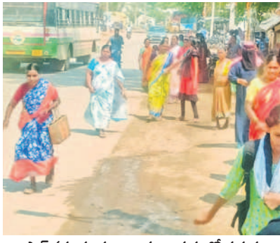
స్టాప్ వద్ద దూరంగా బస్సు ఆపడంతో పరుగులు పెడుతున్న మహిళలు

హన్మంతపేట, మే 21 : కాంగ్రెస్ ప్రభుత్వం అధికారంలోకి వచ్చిన తరువాత మహాలక్ష్మి పేరిట ప్రవేశపెట్టిన 'మహిళలకు ఉచిత బస్సు ప్రయాణం' అవస్థలు తెచ్చి పెడుతున్నది. చెయ్యొత్తిన చోట బస్సులు ఆపాలన్న నిబంధనలను తుంగలో తొక్కుతున్నారు. నిత్యం ఎక్కడో ఒక చోట కొట్టాటలు, మహిళల నుంచి నిరసనలు వ్యక్తమవుతూనే ఉన్నాయి. బస్టాప్ వద్ద కాకుండా మరో దగ్గర బస్సులు ఆపుతుండడంతో మహిళలు పరుగులు పెడుతున్నారు. వివరాలలోకి వెళ్తే.. హన్మంతపేట మండల కేంద్రంలో 9 గంటల సమయంలో వివిధ గ్రా