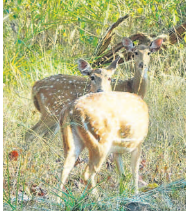
అడవిలో సంరక్షణ జంతులు, అడవిదస్తు (ఫైల్)

గణనీయంగా పెరిగిన శాఖాహార జంతువులు.. అటవీశాఖ అధికారులు తీసుకుంటున్న చర్యలతో శాఖాహార జంతువుల సంఖ్య గణనీయంగా పెరిగింది. విస్తారమైన గడ్డి శ్రేణులు, తాగునీటి కోసం సాగునీటిట్లు, ఊటకుంటలు, సోలార్ బోర్డు ఏర్పాటు