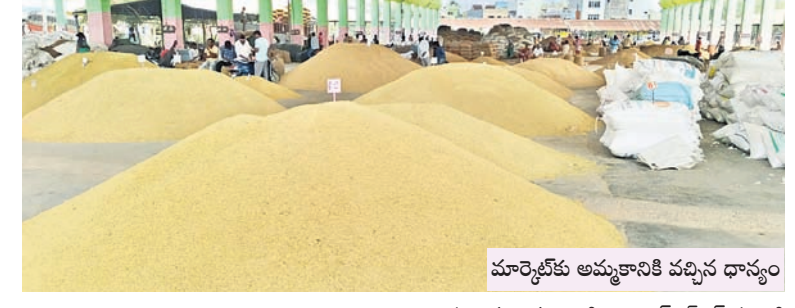
మార్కెట్ కు అమ్మకానికి వచ్చిన ధాన్యం