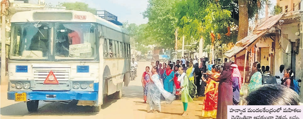
హన్మంతపేట మండల కేంద్రంలో మహిళలు చెయ్యొత్తినా అపకండా వెళ్తున్న బస్సు