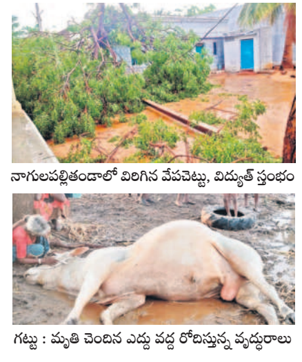
గట్టు : మృతి చెందిన ఎద్దు వద్ద లోనిస్తున్న వృద్ధురాలు