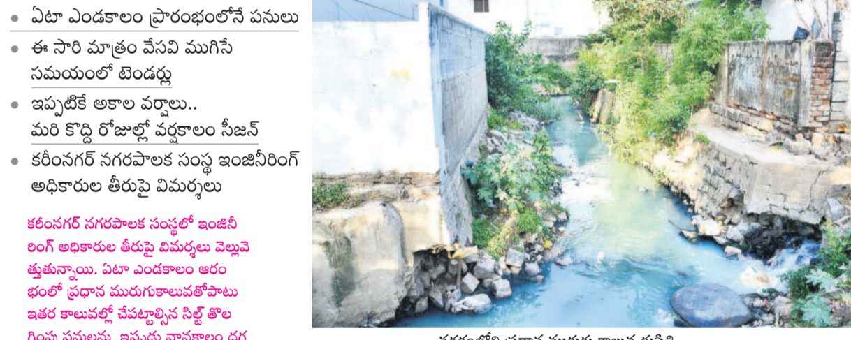
నగరంలోని ప్రధాన మురుగు కాలువ దుర్భితి