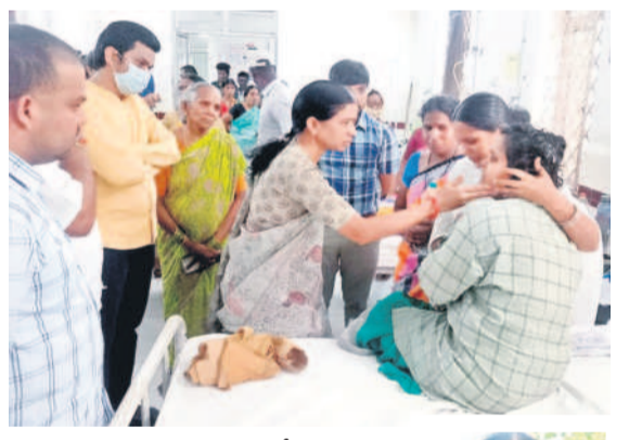
సిరిసిల్లా ఏరియా దవాఖానలో మహిళా కూలీని పరీక్షించుతున్న జడ్జి చైరెమన్స్ న్యాలికోండ అరుణ