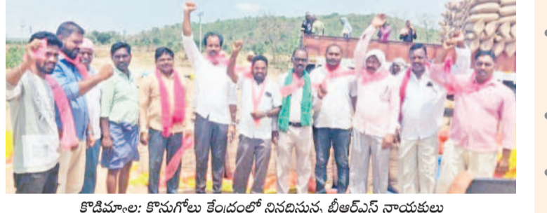
కొడిమ్యాల: కొనుగోలు కేంద్రంలో నినదించుతున్న బీఆర్ఎస్ నాయకులు