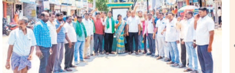
ధర్మాంధ్రం: ధర్మాంధ్రంలో అంబేద్కర్ వారసత్వం ధర్మా చేస్తున్న బీఆర్ఎస్ నాయకులు