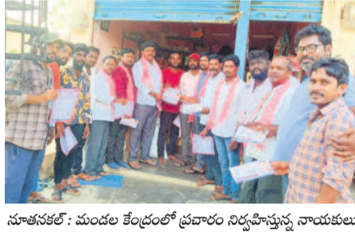
నూతనకల్ : మండల కేంద్రంలో ప్రచారం నిర్వహిస్తున్న నాయకులు