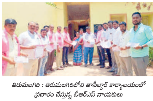
తిరుమలగిరి : తిరుమలగిరిలోని తాసీల్దార్ కార్యాలయంలో ప్రచారం చేస్తున్న టీఆర్ఎస్ నాయకులు