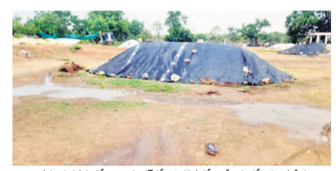
వర్షం కురవడంతో నిజామాబాద్ లోని ఓ కొనుగోలు కేంద్రంలో నిలిచిన నీరు