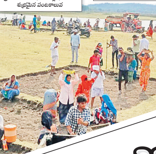
శ్రీనిగల్లో ఉపాధి పనుల్లో భాగంగా శుభ్రమైన పంటకాలువ

గ్రామాల వారిగా లక్ష్యాలు.. ప్రతి గ్రామ పంచాయతీ పరిధిలో నిత్యం పెద్ద సంఖ్యలో కూలీలు పనులకు హాజరయ్యేలా అధికారులు లక్ష్యాన్ని నిర్దేశించారు. ఊరూరా గ్రామసభలు, సమీక్షలు, కోరిన వారికి జాప్యం లేకుండా జాబ్ కార్డు అందజేత తదితర కారణాలతో కూలీలు పనులకు వెళ్లేందుకు ఉత్సాహం చూపుతున్నారు. వేసవి నేపథ్యంలో ఉపాధి పనుల వద్ద ఓఆర్ఎస్ ప్యాకెట్లు, షేడ్ నిల్లు పలుచొట్ట అందజేయడం ఉంచున్నారు. మరికొన్ని ప్రాంతాల్లో ఉపాధి కూలీలకు కనీస మౌలిక సదుపాయాలు కల్పించడం లేదన్న ఆరోపణలు ఉన్నాయి.