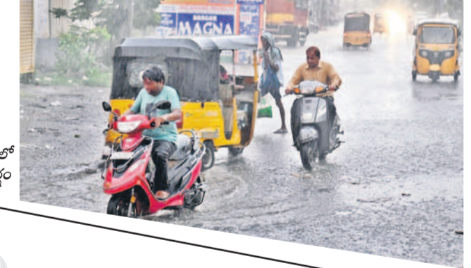
నిజామాబాద్ లో కురుస్తున్న వర్షం

• ఉమ్మడి జిల్లాలో పలు ప్రాంతాల్లో వాన • నేలకొరిగిన చెట్లు.. భయందోళనలో రైతులు ఖలిల్వాద్/ సిరికొండ/ నిజామాబాద్ జిల్లాలో బుధవారం సాయంత్రం మోస్తరు వర్షం కురిసింది. ఈదురుగాలులతో ప్రారంభమైన వాన పలుచోట్ల భారీగా కురిసింది. నిజామాబాద్ జిల్లా సిరికొండ మండలం తాళ్లరామగురిలోని అంబేద్కర్ విగ్రహం వెనకల ఉన్న భారీ వృక్షం ఈదురుగాలులకు నేలకొరిగింది. పోలీస్ స్టేషన్ ఆవరణలో ఉన్న చెట్టు విరిగి విద్యుత్ తీగలపై పడడంతో విద్యుత్ సరఫరాకు అంతరాయం ఏర్పడింది. నిజామాబాద్ మండలంలోని పలు గ్రామాల్లో వర్షం కురవగా కొనుగోలు కేంద్రాల్లో ఉన్న ధాన్యపు రాకుల చుట్టూ వర్షపు నీరు చేరింది. రైతులు ముందస్తుగానే తూటాల్ని పుచ్చుకోవడం దాన్యం తడవలేదు. గత వారం రోజులుగా మండలంపై ఎండలు, ఉక్కిరికరి తుపానులు కురిస్తున్న నేపథ్యంలో నిజామాబాద్ నగర ప్రజలు వర్షం కురవడంతో ఆనందం పొందారు. బాన్సువాడ పట్టణం తోపాటు పలు గ్రామాల్లో ఈదురు గాలులు, వర్షానికి విద్యుత్ సరఫరా నిలిచిపోయింది.