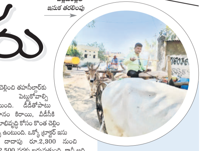
ఎడ్లబండ్లతో ఇసుక తరలింపు