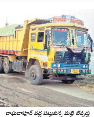
రామవాహుల్ వద్ద పట్టుకున్న మట్టి బిప్పర్లు

టలోల్ బుద్ధవారం ఏర్పాటు చేసిన విలేజ్ కలెక్షన్ల సమావేశంలో ఆయన మాట్లాడారు. జిల్లాలో ఇంకా 2 లక్ష మెట్రిక్ టన్నుల ధాన్యం కొన్నాడో ఉన్నదని, దానిని ఎప్పుడు కొనుగోలు చేస్తారో..? ప్రభుత్వం చెప్పాలని డిమాండ్ చేశారు. సన్నబి య్యాన్లు మార్కెట్లో ఎక్కడా లేని విధంగా కిలో ₹57 పెట్టి కొనుగోలు చేస్తున్నారని, ఈ కొనుగోళ్లలో ₹300 కోట్లకు పైగా డండుకునేందుకు ప్రయత్నాలు చేస్తున్నారని ఆరోపించారు. రాష్ట్రంలో ధాన్యం కొనుగోలుకు సంబంధించి 33 లక్షల మెట్రిక్ టన్నుల సేకరణ లక్ష్యంగా టెండర్ పిలిచారని, కానీ ఇప్పటి వరకు రెండు లక్షల మెట్రిక్ టన్నులు మాత్రమే కొనుగోలు చేశారన్నారు. ఈ టెండర్ పొడిగించి వేరీటూ ₹700 కోట్లు డండు కొనాలని చూస్తున్నారని, టెండర్ ను ఎట్టి పరిస్థితుల్లోనూ పొడిగించవద్దని డిమాండ్ చేశారు. డిస్ట్రిక్ ఉన్నతాధికారులకు ఫిర్యాదు చేస్తామని చెబుతున్నారని ఆరోపించారు. ఇన్వెస్టిగేటివ్ ఉత్తమకుమార్ రెడ్డితోపాటు జిల్లాకు చెందిన మంతులు పాస్టు ప్రకాశ్, శ్రీధర్బాబు ఏ మాత్రం పట్టించుకోవడం లేదని విమర్శించారు. ధాన్యం కొనుగోలుకు సంబంధించి ఇప్పటివరకు ఒక్క సమీక్ష కూడా నిర్వహించలేకపోయారని దుయ్యబట్టారు. కరీంనగర్ లోని ఓ ప్రైవేట్ హో