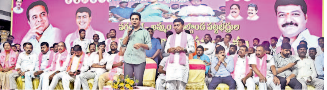
వరంగల్ తూర్పు నియోజకవర్గ ఎమ్మెల్యే సన్నాహక సమావేశంలో మాట్లాడుతున్న కేటీఆర్

కరెంటు కోతలతో ఉక్కిరిబిక్కిరి కరెంటు కోతలతో ప్రజలతోపాటు అన్ని వర్గాల ప్రజలు ఉక్కిరిబిక్కిరి అవుతున్నారని విమర్శించారు. ఉత్తర తెలంగాణకు పెద్ద దిక్కు అయిన ఎంపీల దమాఖానలో ఐదు గంటల పాటు కరెంటు నిలిచిపోవడం బాధాకరమన్నారు. కాంగ్రెస్ పార్టీ అధికారంలోకి వస్తే మామూలు అన్నారని, మార్పు అంటే ఇదేనా అని కేటీఆర్ ప్రశ్నించారు. ఎంపీల కరెంటు పోతే సర్దుకుపోవచ్చు కానీ ఎంపీల దమాఖానలో కరెంటు పోతే వెంటి లేట్లకు ఉన్న పేషెంట్లు, ఇంకొకటి ఉన్న సమస్యలకు పరిష్కరించే ఎంత దుర్మార్గులు ఉంటుంటే ఒక సారి ప్రజలు ఆలోచన చేయాలన్నారు. కేసీఆర్ ప్రభుత్వం ఉన్నప్పుడు కరెంటు ఎట్లా ఉండే కాంగ్రెస్ ప్రభుత్వంలో ఎట్లా ఉండో ప్రజలకు అర్థమవుతుందన్నారు.