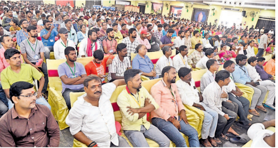
నర్సంపేట నియోజకవర్గ ఎమ్మెల్యే సన్నాహక సమావేశానికి హాజరైన పట్టభద్రులు