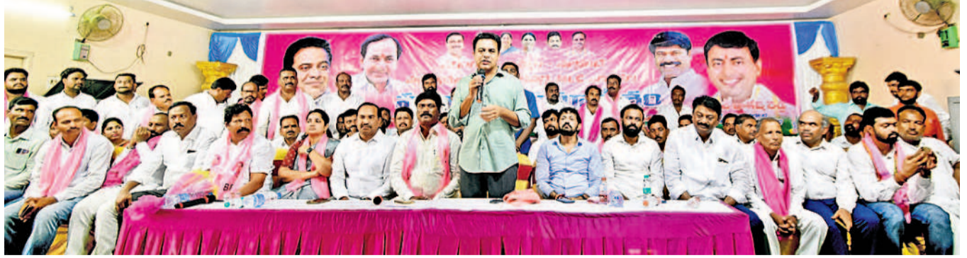
నర్సంపేట నియోజకవర్గ ఎమ్మెల్యే సన్నాహక సమావేశంలో మాట్లాడుతున్న బీఆర్ఎస్ వర్గం ప్రసిడెంట్ కేటీఆర్