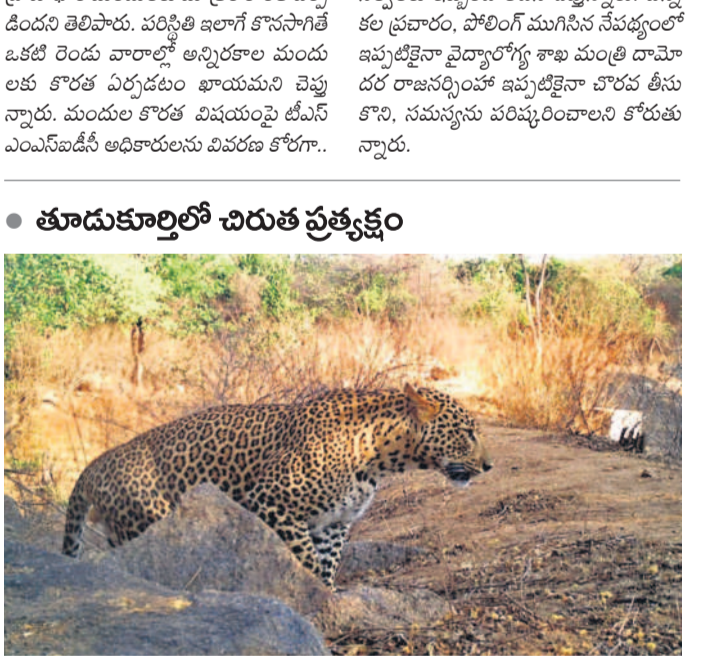
నాగర్ కర్నూల్ జిల్లా తూడుకూర్ల విహారులో చిరుత ప్రత్యక్షమైంది. బిజినేషియల్ మండలం సెల్వరేపేట ఫారెస్టులో కొద్ది రోజులుగా చిరుత సంచారంతో సమీప గ్రామాల ప్రజలు భయాందోళన చెందుతున్నారు. గురువారం ఎన్టీఆర్ ప్రసాద్ కంటి దవాఖానం వెనుక భాగంలో వ్యవసాయ పొలాలకు వెళ్లే రైతుల కంటపడింది. జంక పిల్లను తరుముతూ కనిపించడంతో రైతులు భయపడ్డారు. ఈ ప్రాంతంలో దాదాపు నాలుగు చిరుతలు తిరుగుతున్నట్లు స్థానికులు తెలిపారు. -నాగర్ కర్నూల్