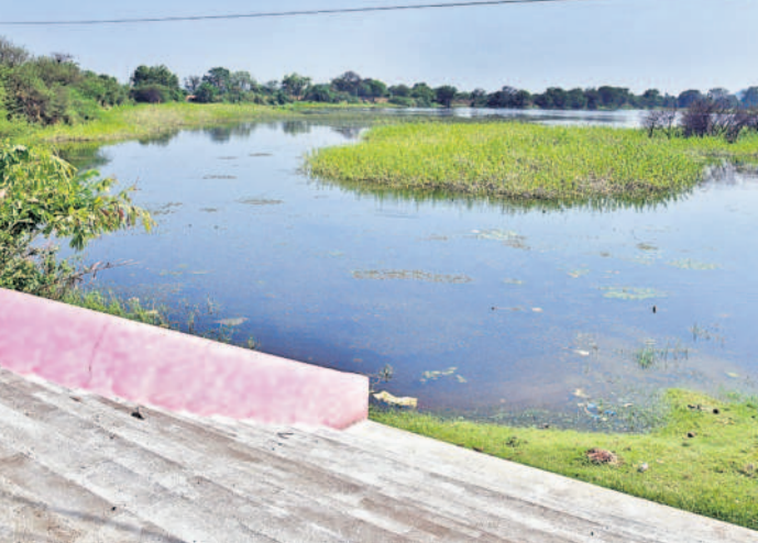
కరీంనగర్ జిల్లా చూరల్ మండలంలోని తాయరుకొండ గ్రామంలో నిధులు మే నెలలో నిధుగా ఉన్న చెరువు