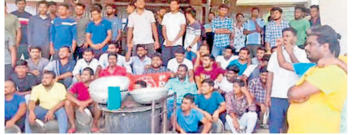
కేయా పరిపాలనా భవనం ఎదుట వంట సామగ్రి, ఫ్లెట్లతో నిరసన వ్యక్తం చేస్తున్న విద్యార్థులు